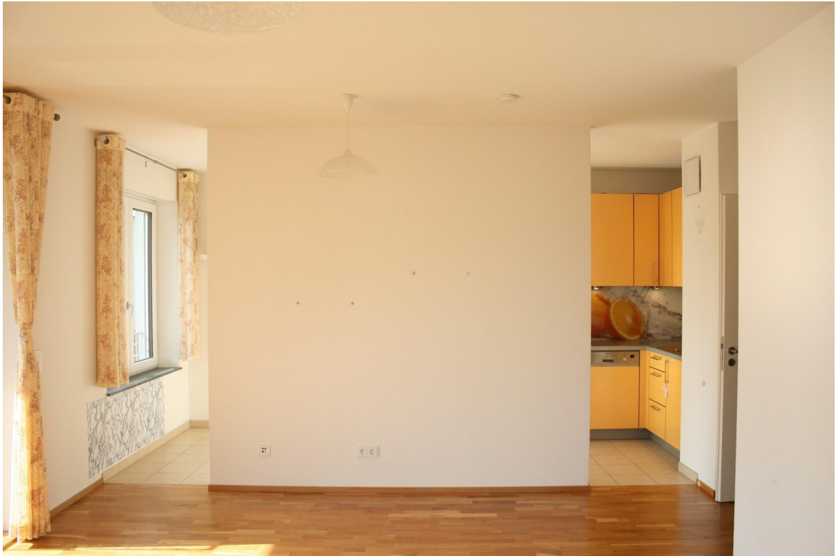
Wohnzimmer und Küche