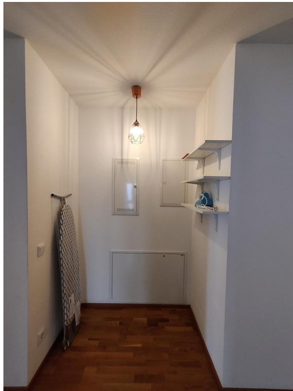
Abstellraum im Flur