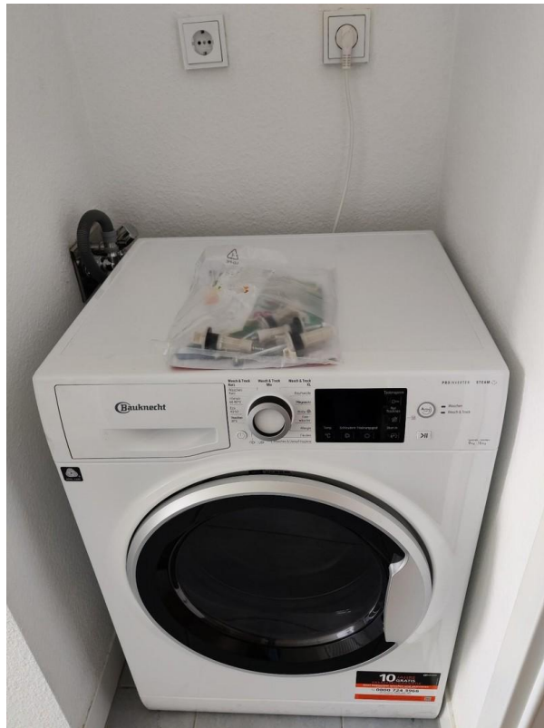
Waschmaschine in Badzimmer