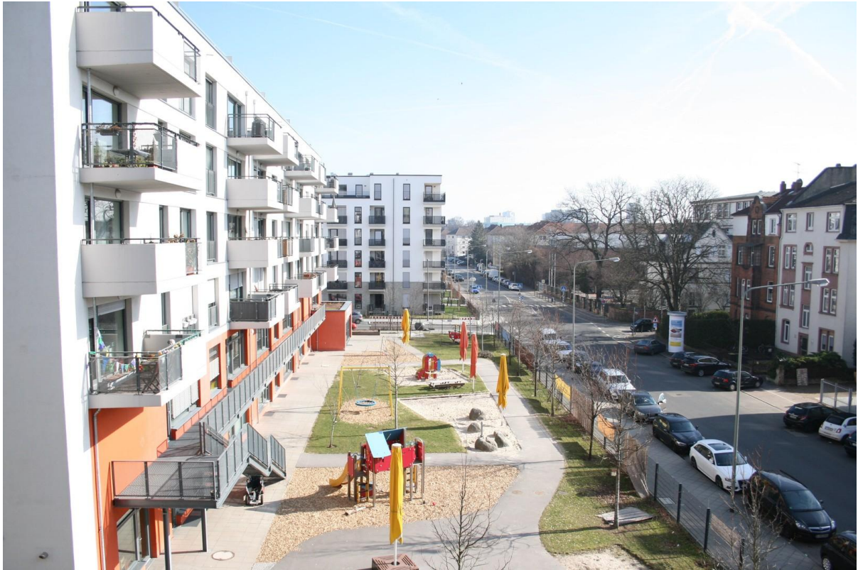
Blick aus dem Wohnzimmer