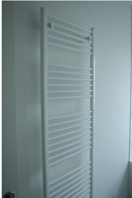
Heizung in Badzimmer