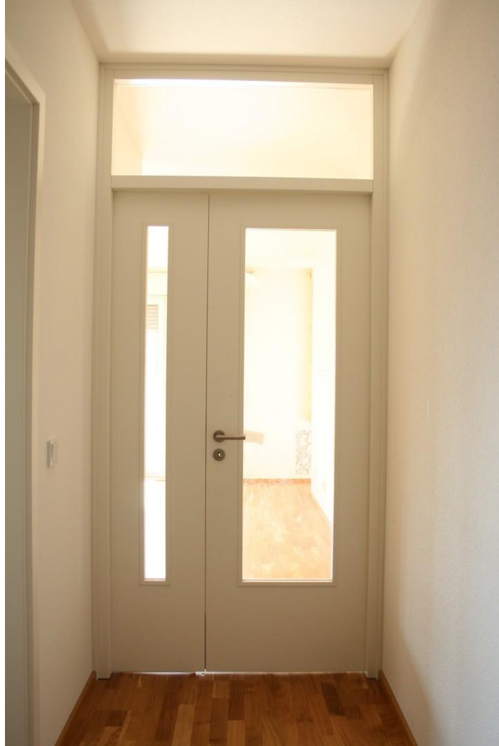
Flurtür getrennt vom Wohnraum