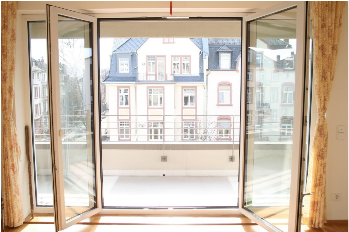
Terrasse vom Wohnzimmer