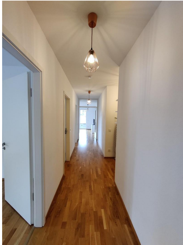
Flur mit Abstellraum