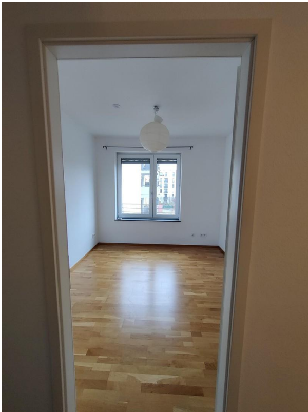
Arbeitszimmer / Kinderzimmer