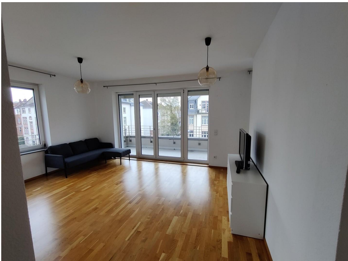
Wohnzimmer mit Möbel