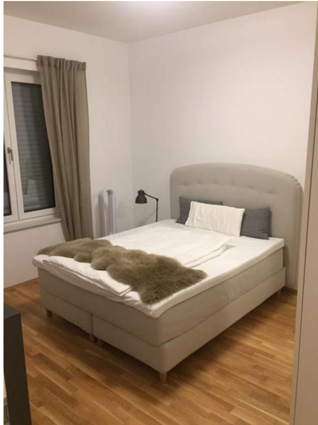
Schlafzimmer mit Boxspringbett