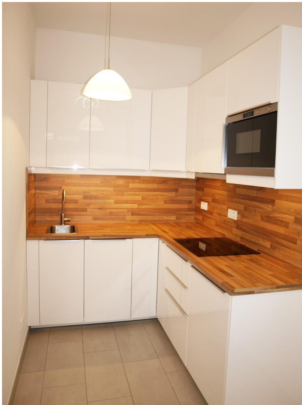
Küche - vollausgestattet