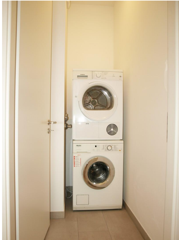
Wirtschaftsraum - inkl. WM + T