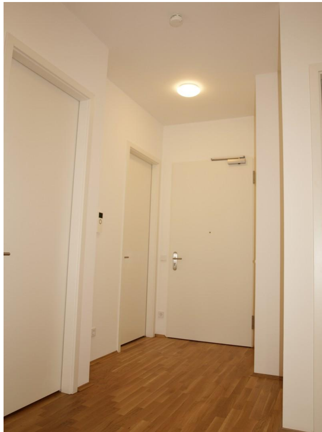
Eingangsbereich - Flur