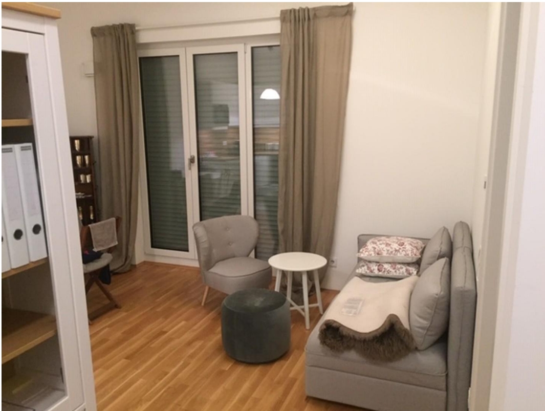
gemütliches Sofa mit Sessel