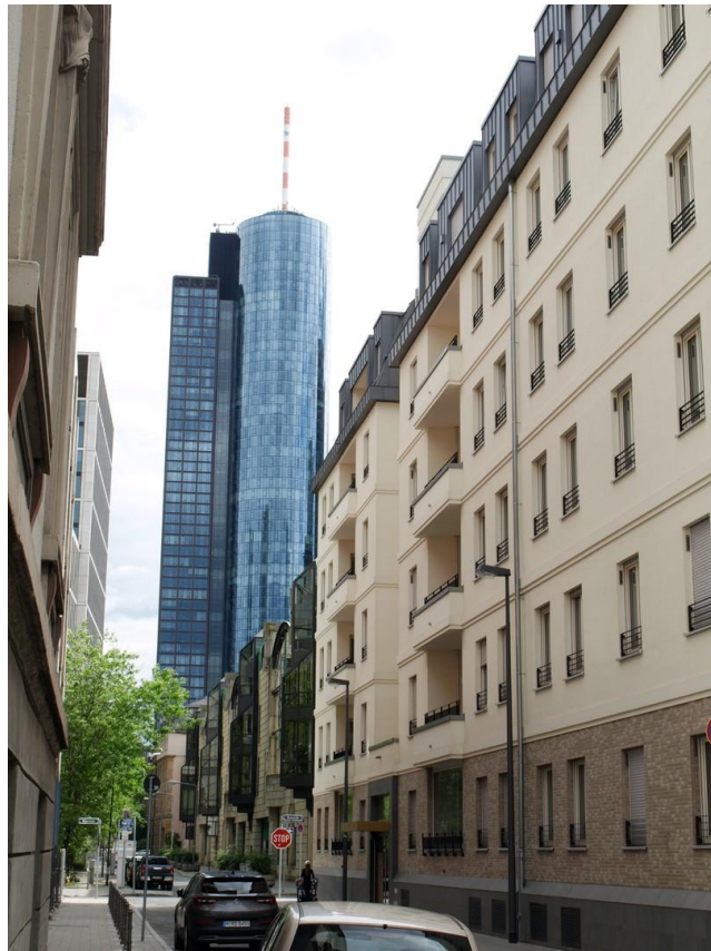
sehr ruhige Seitenstraße