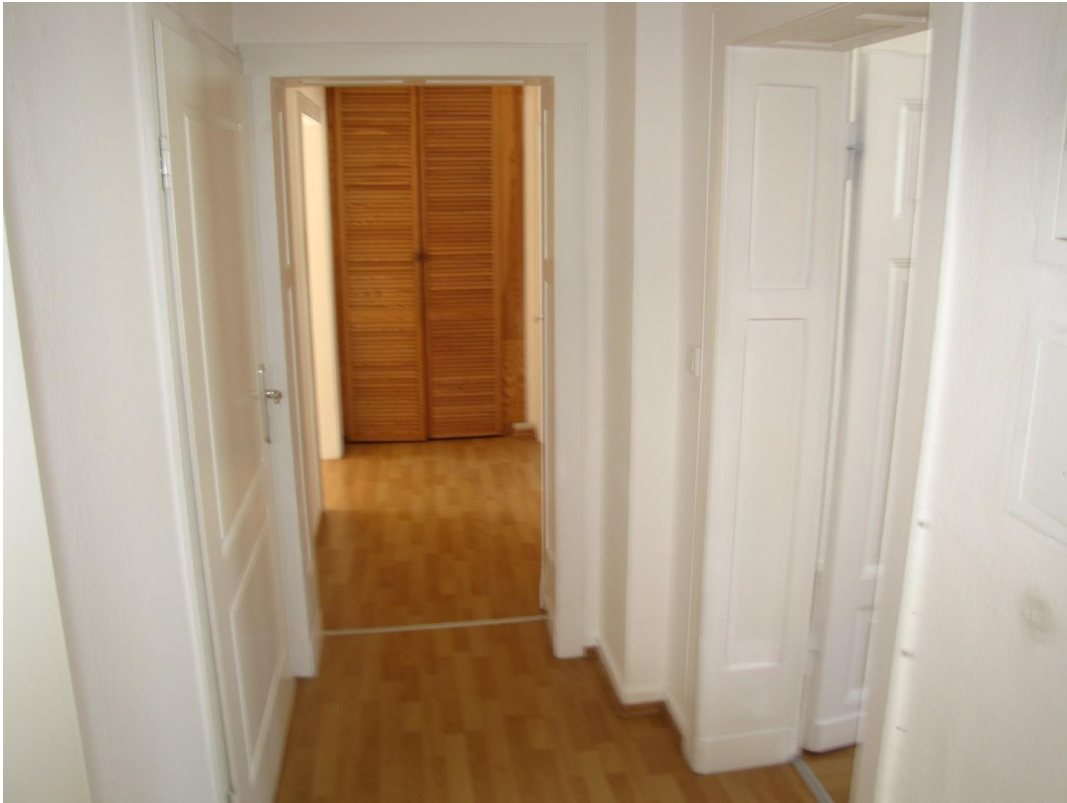
Diele mit Einbauschränk