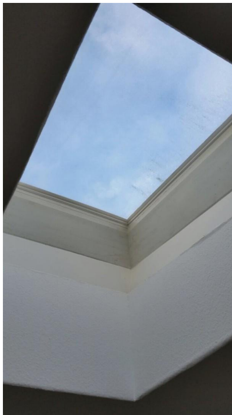
Dachfenster in der Küche