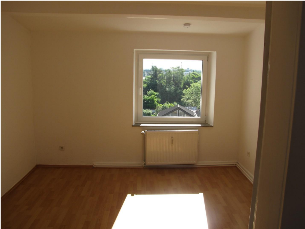
Schlafzimmer 2 o. Kinderzimmer