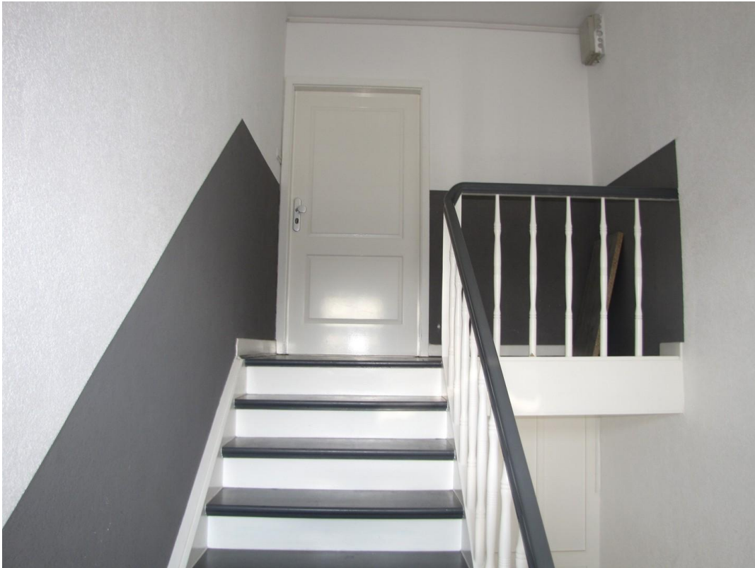
Eingang zur Wohnung