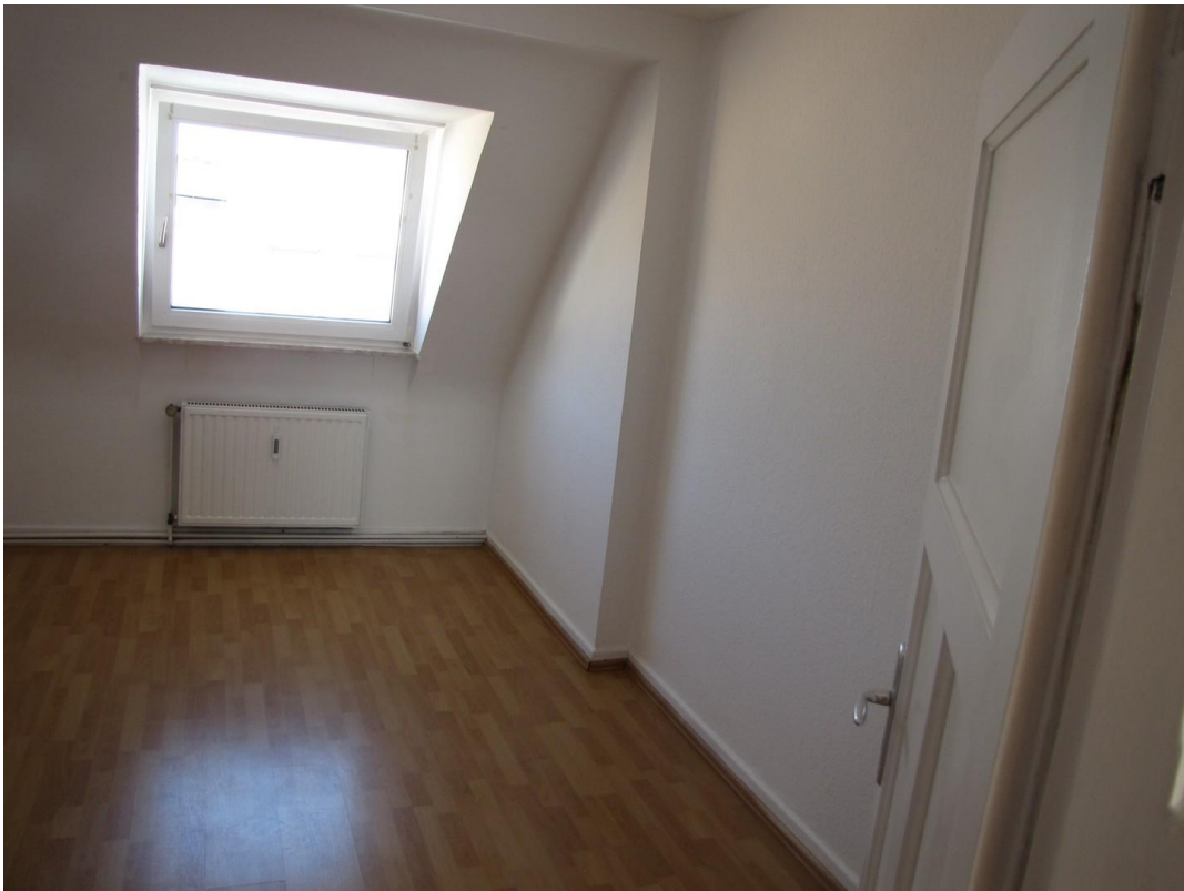
Schlafzimmer 1 o Kinderzimmer