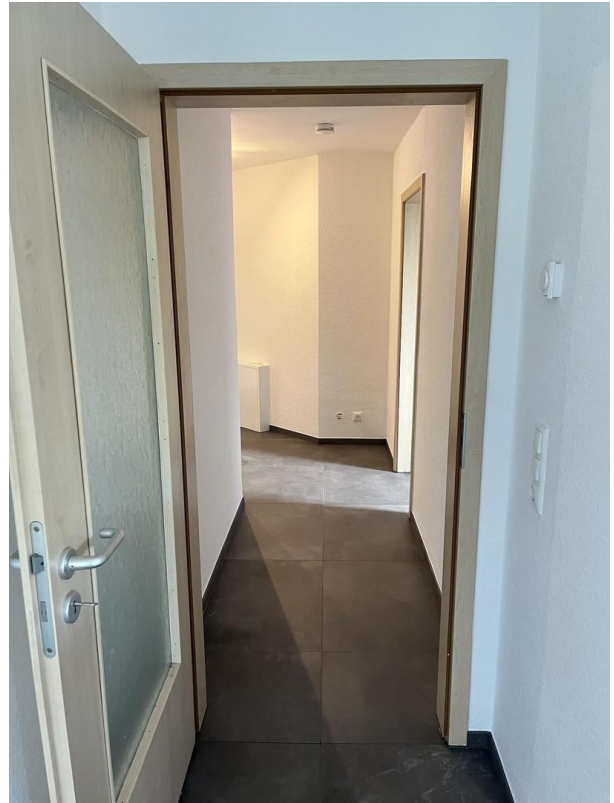
Flur Blick Eingangsbereich