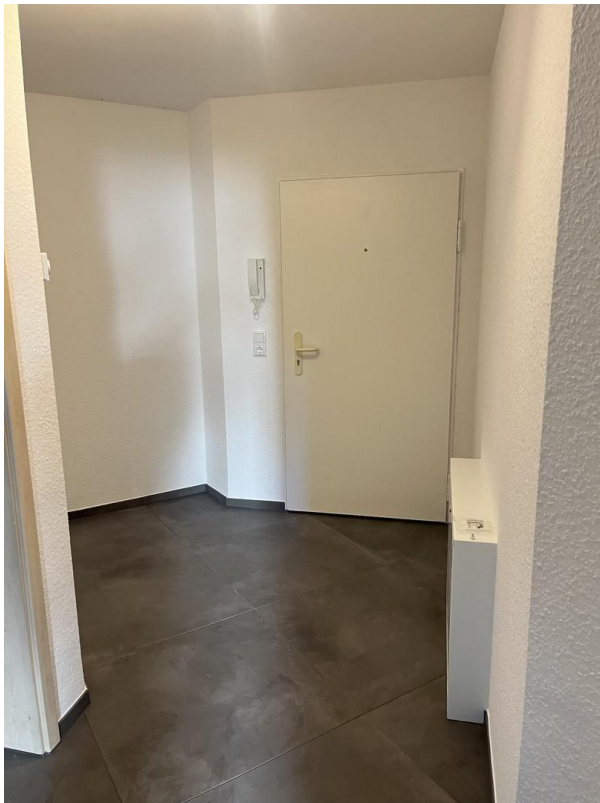
Flur Blick Eingangstür