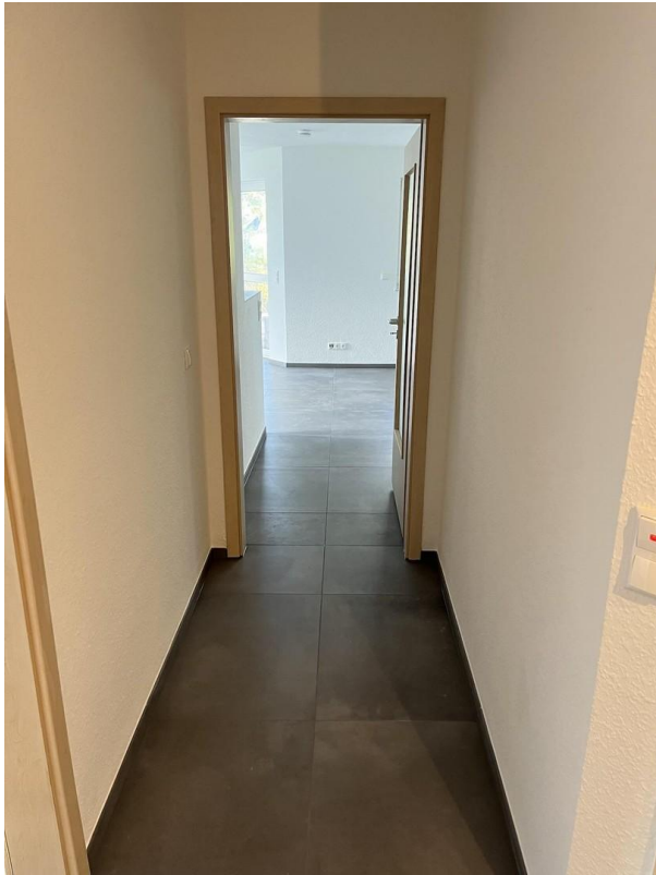
Flur Blick Wohnbereich