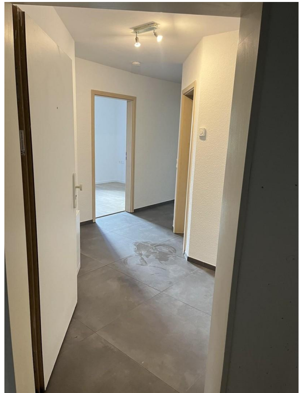
Flur Blick Schlafzimmer