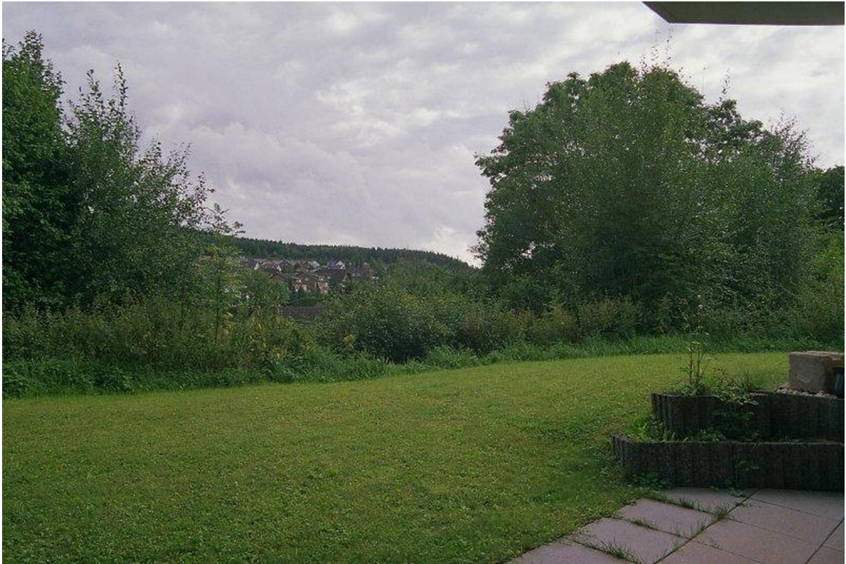
Blick von der Terasse