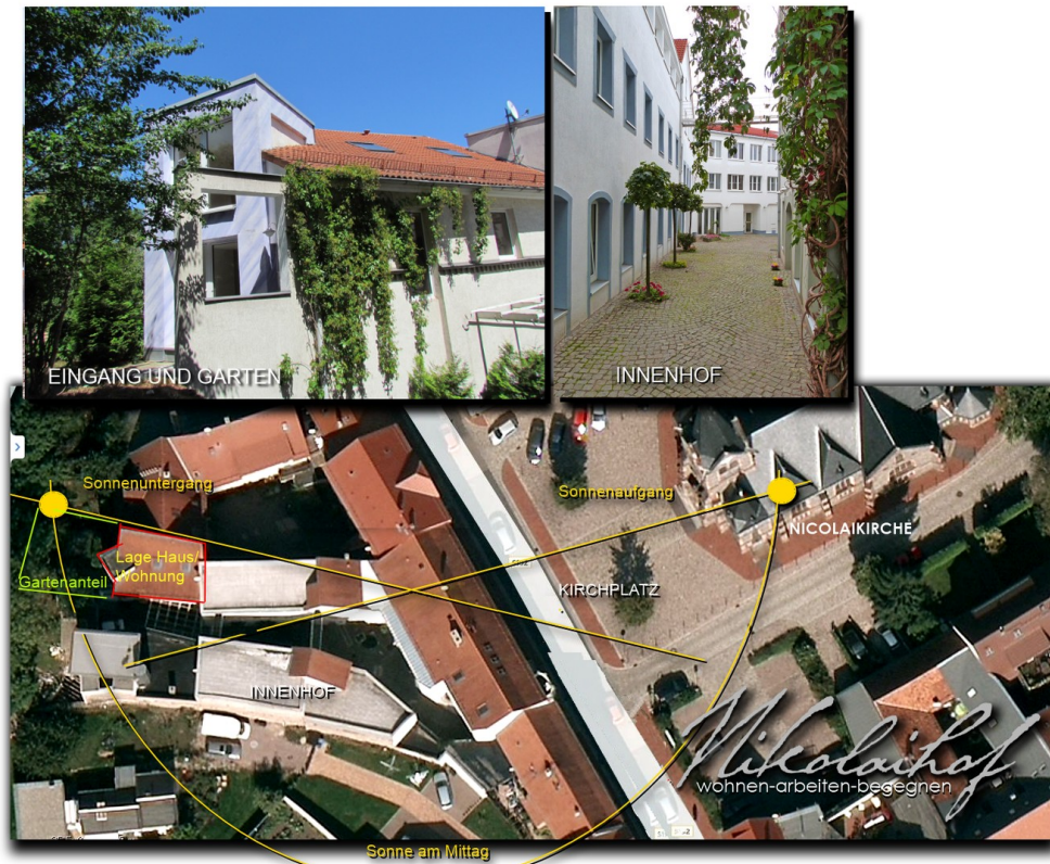
Lage & Sonne