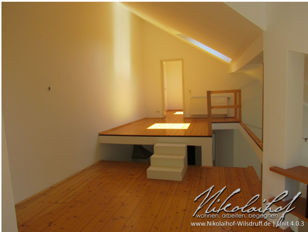
Galerie mit Schreibplatz