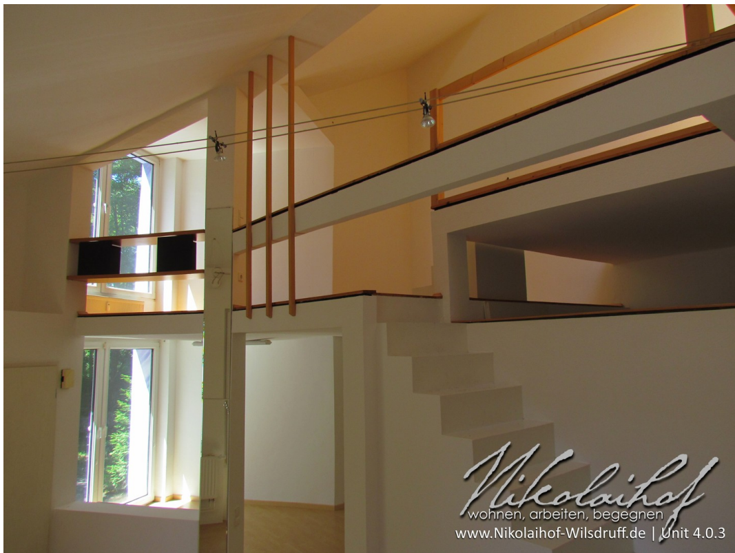
Wohnraum Aufgang zur Galerie