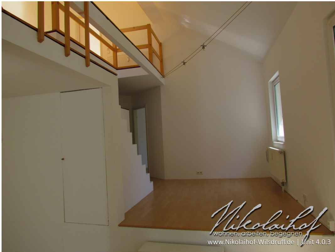
Wohnraum mit Essbereich