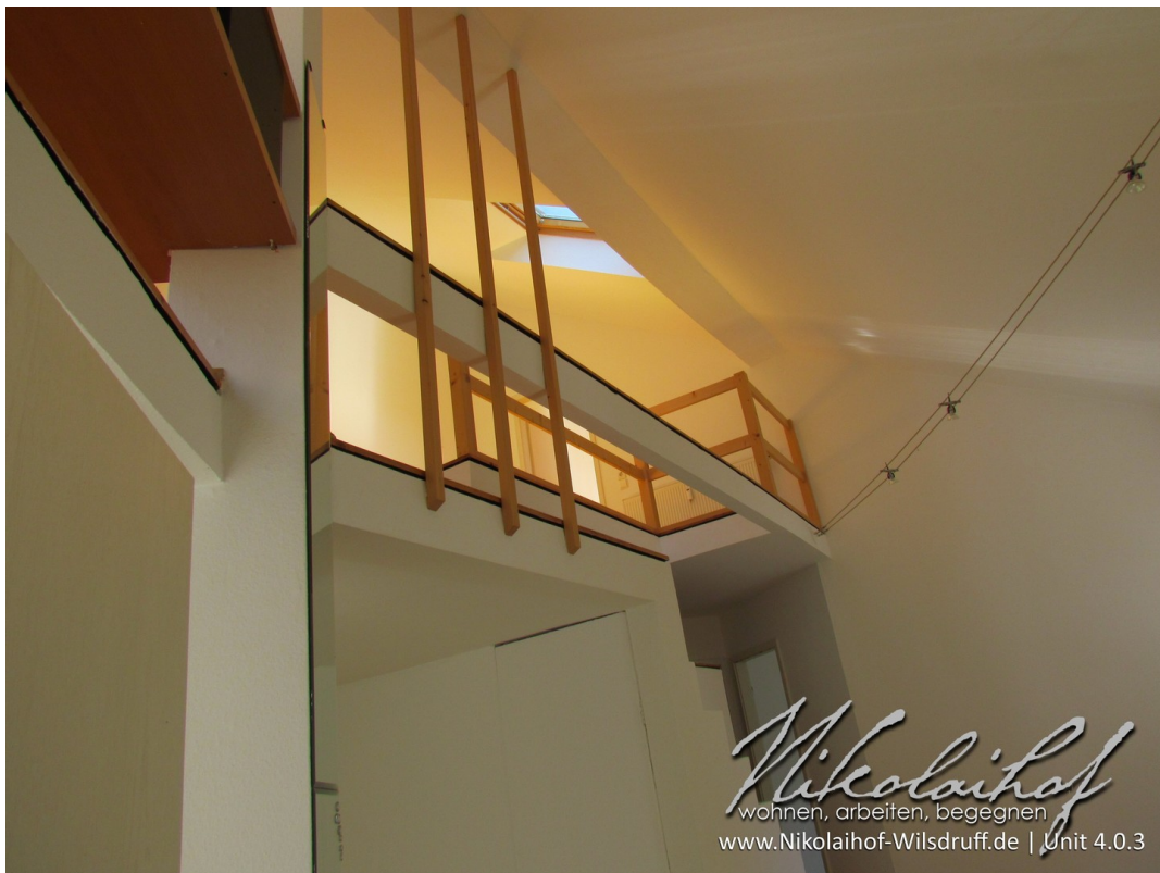
Wohnraum; Blick zur Galerie