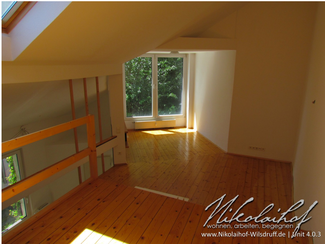
Galerieebene mit Garten-Blick