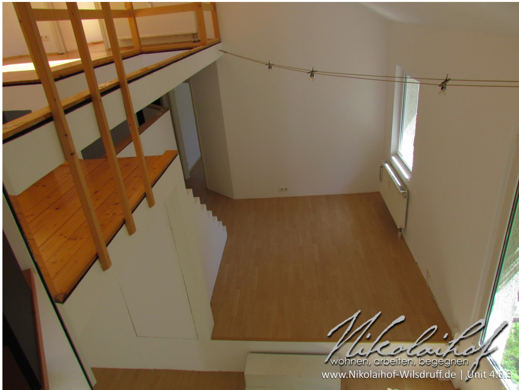
Blick zum Essbereich