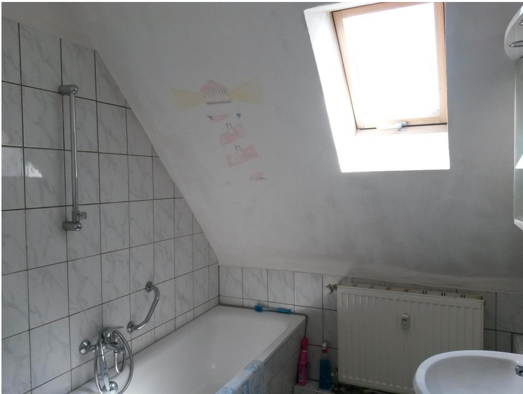
Bad mit WC