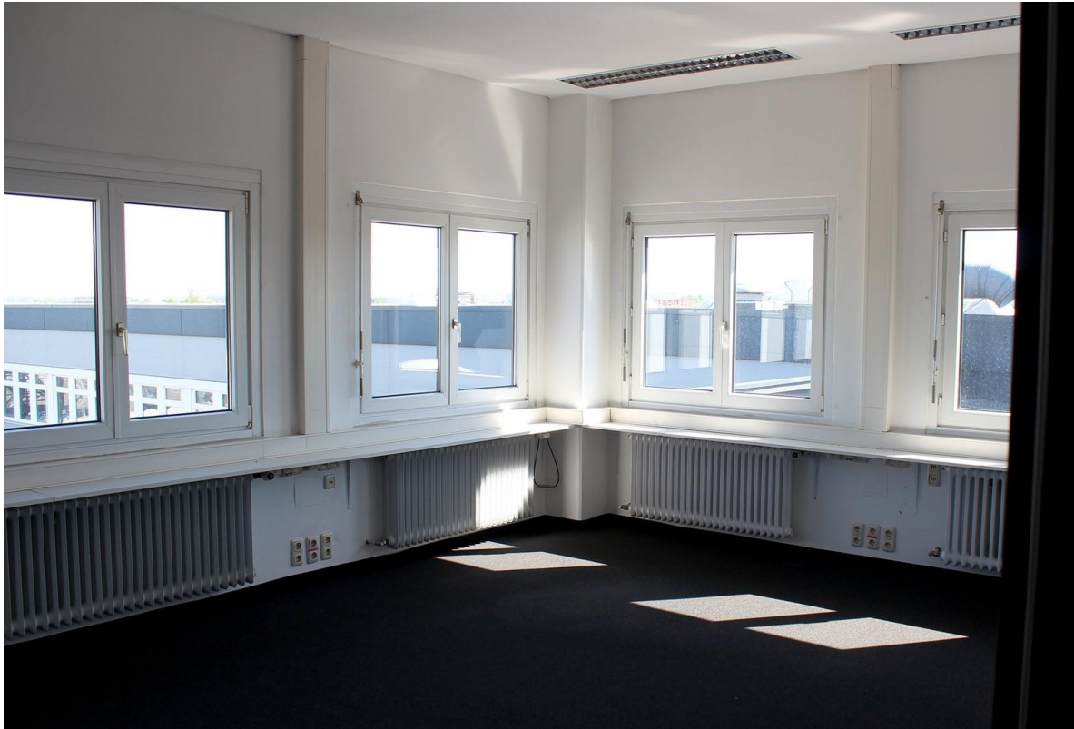
Büro mit 31 qm