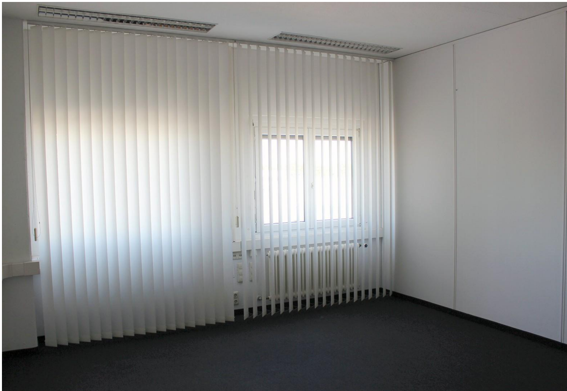
Büro mit 24 qm