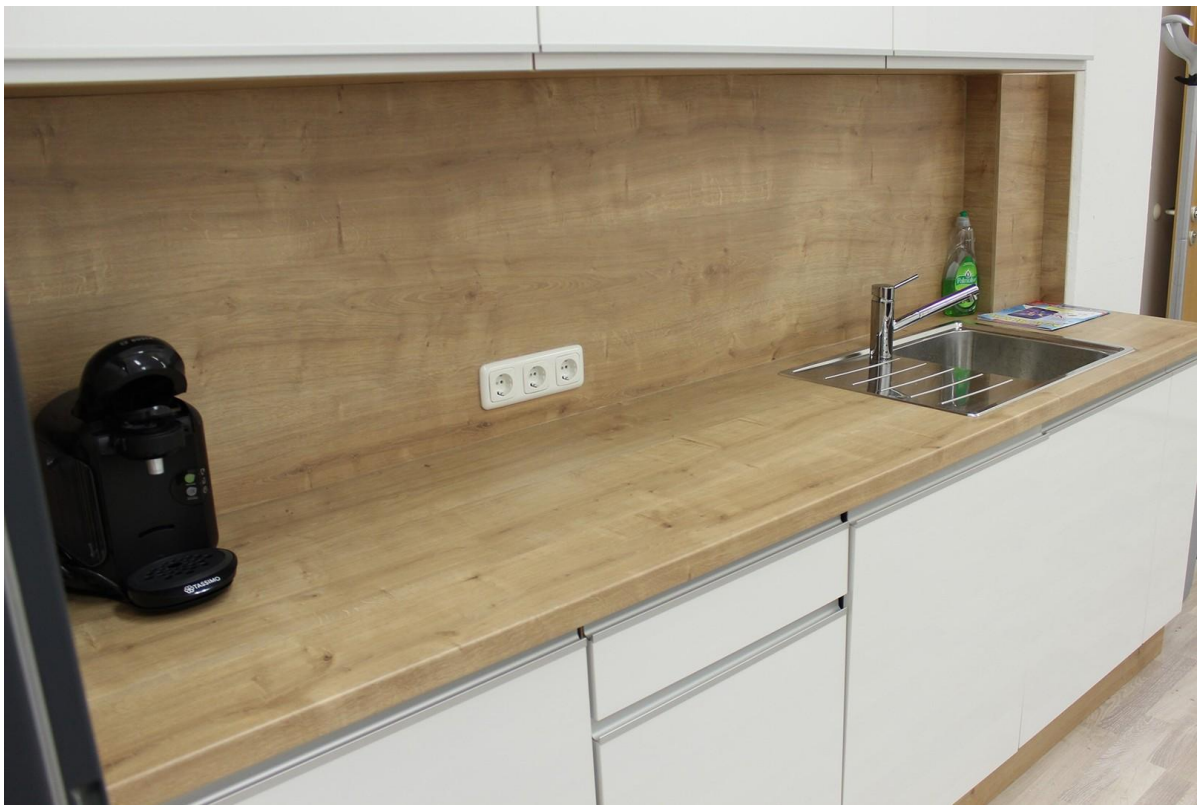
Küchenzeile und Kühlschrank