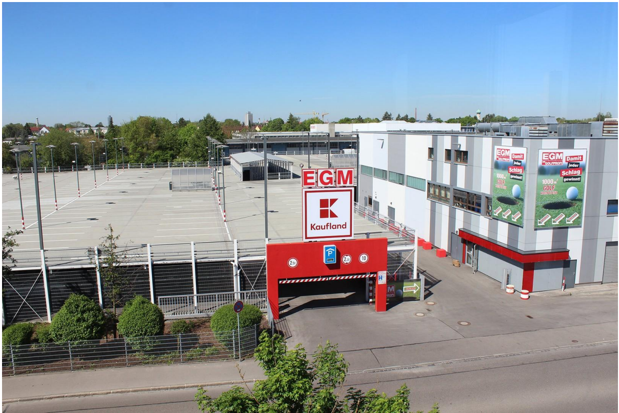
Blick auf Parkgebäude