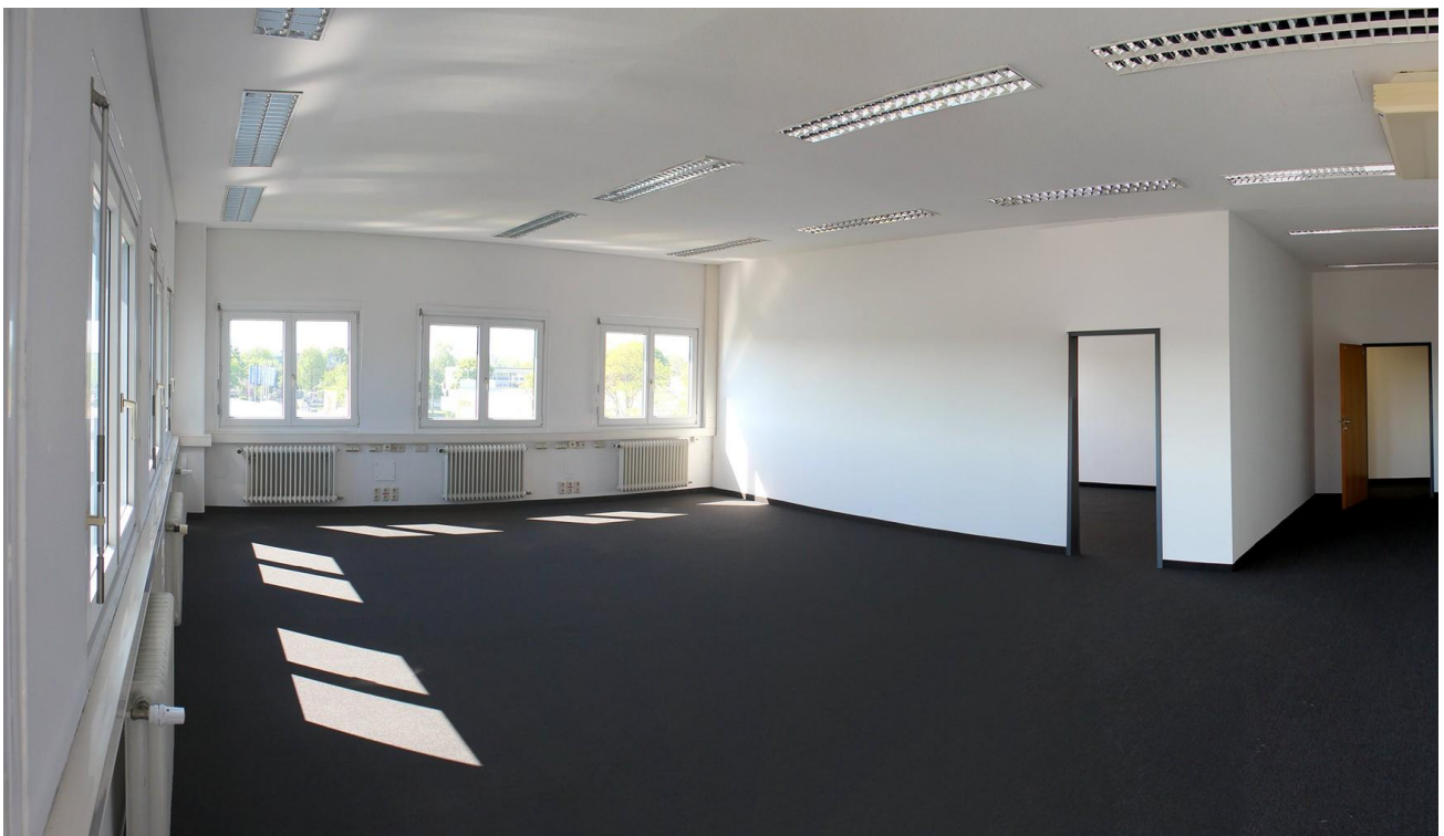
Büro mit 61 qm