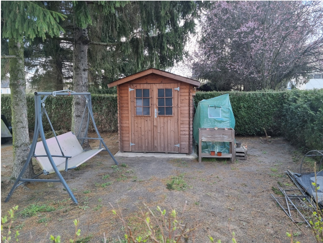
Garten plus Gartenhaus