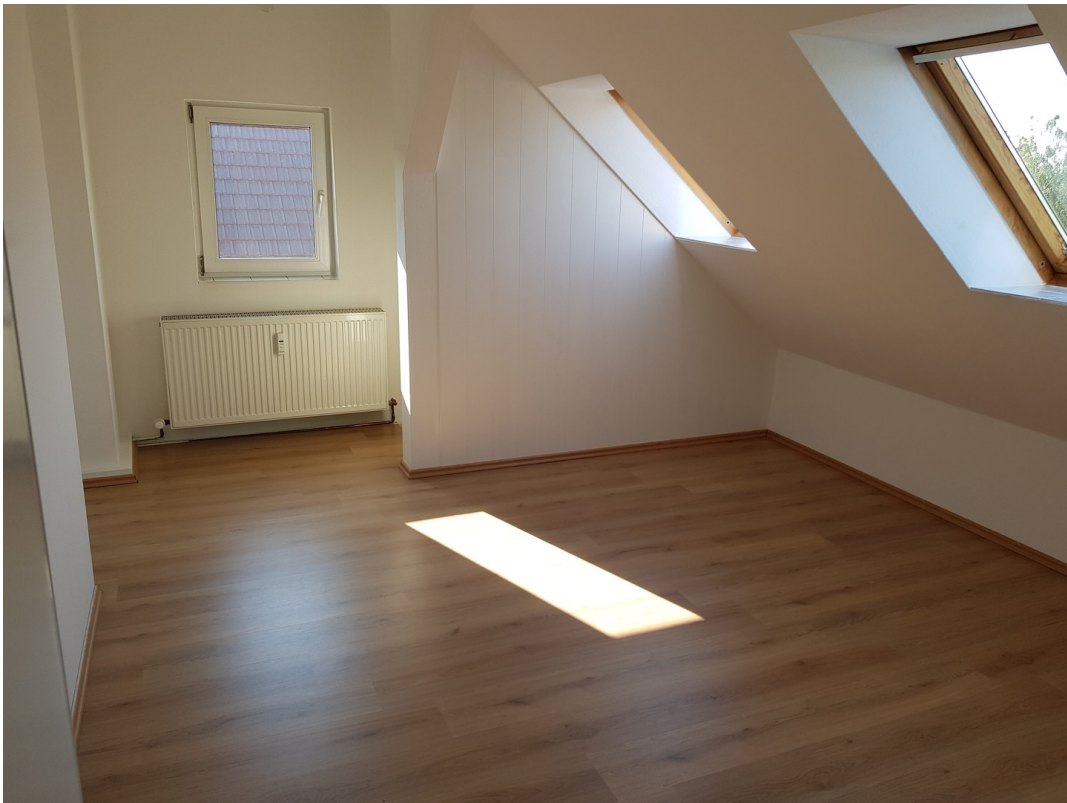
Zimmer zur Strasse