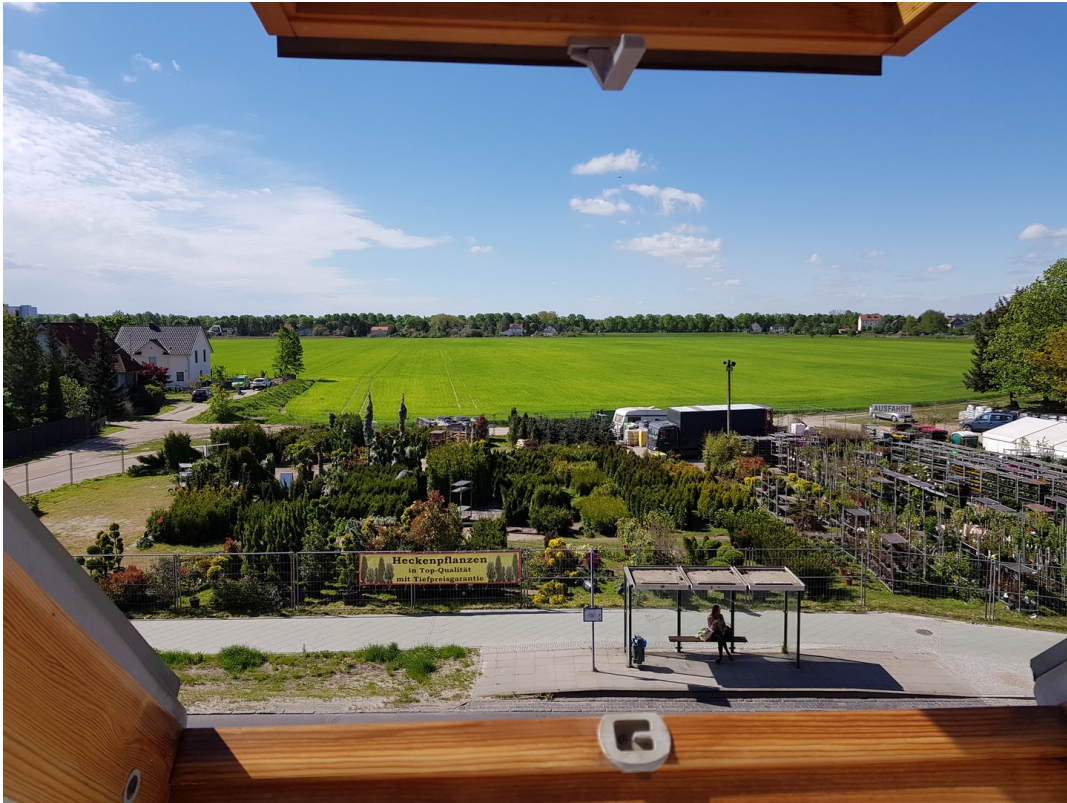
Blick zur Strasse