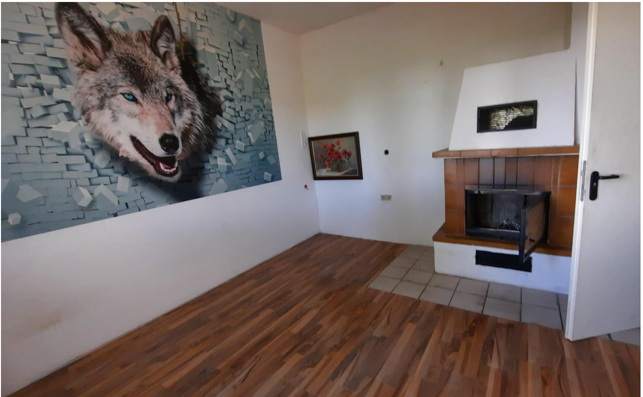
EG Raum 3