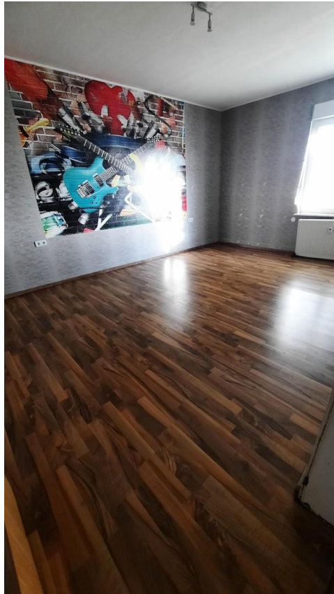
EG Raum 1