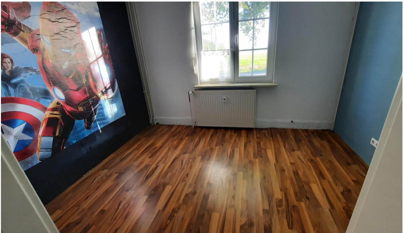
EG Raum 2