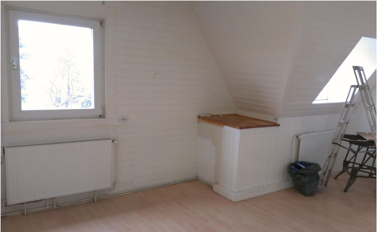
Küche, ohne Einbauten OG