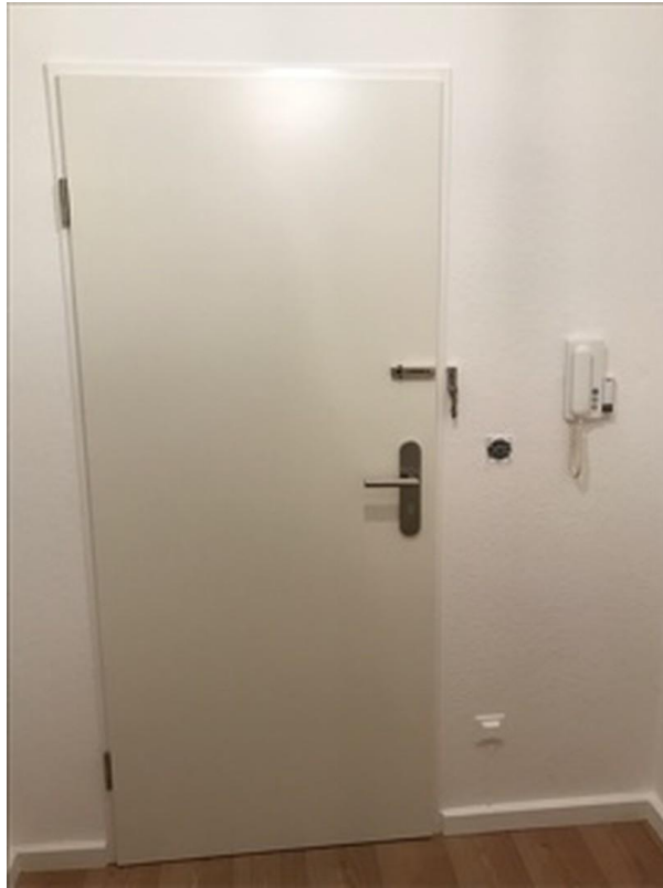
Eingang mit Gegensprechanlage