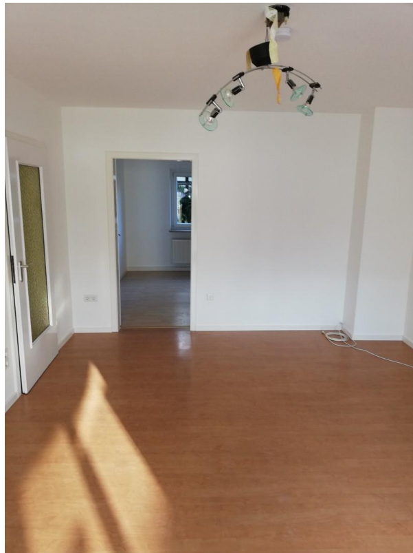
Wohnzimmer Richtung Schlafz.