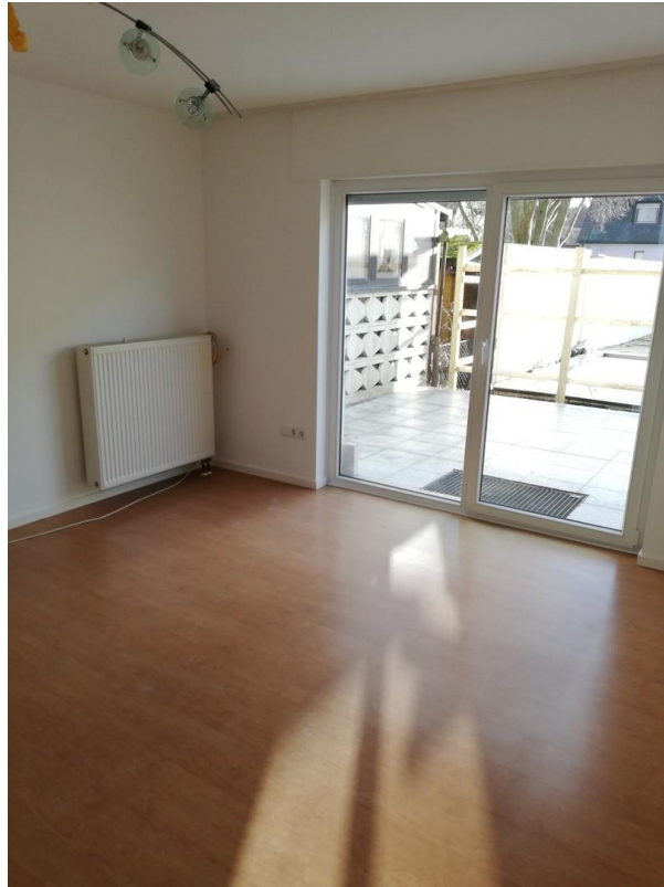
Wohnzimmer Richtung Terrasse