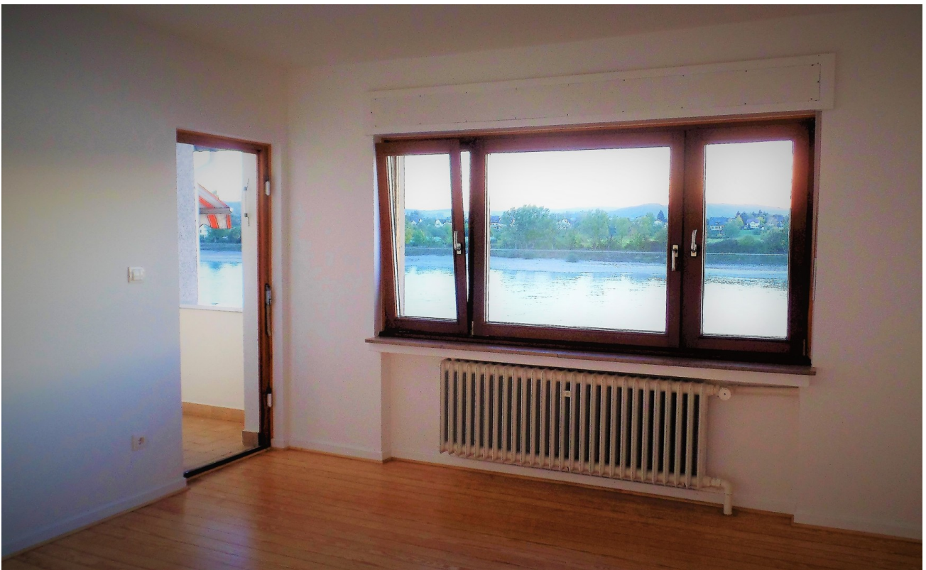
Wohnen - Beispiel aus 2.OG