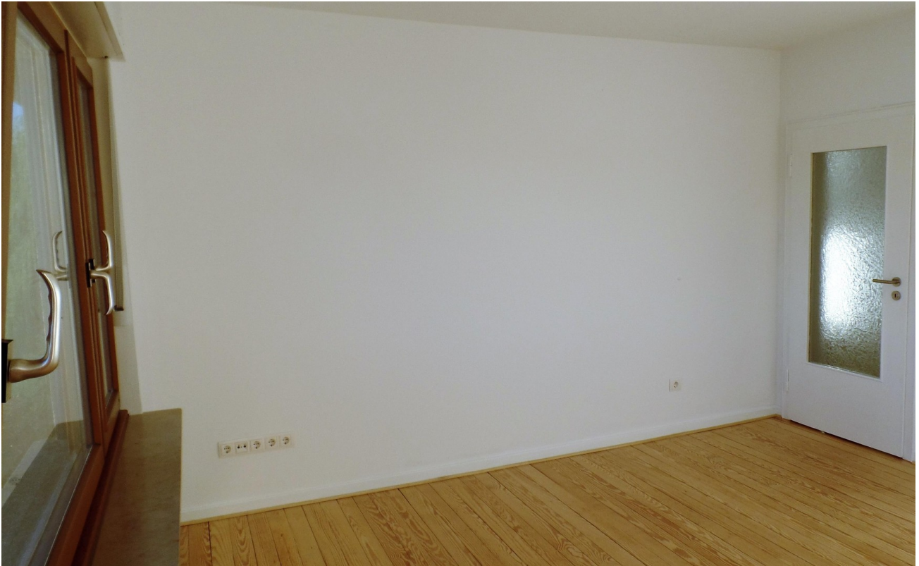
Schlafen - Beispiel aus 2.OG