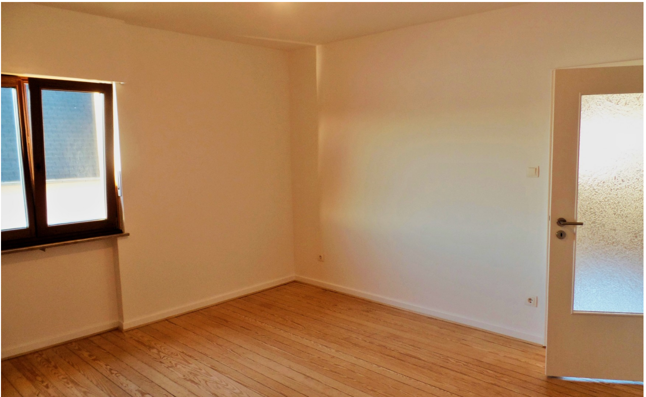
Zimmer - Beispiel aus 2.OG