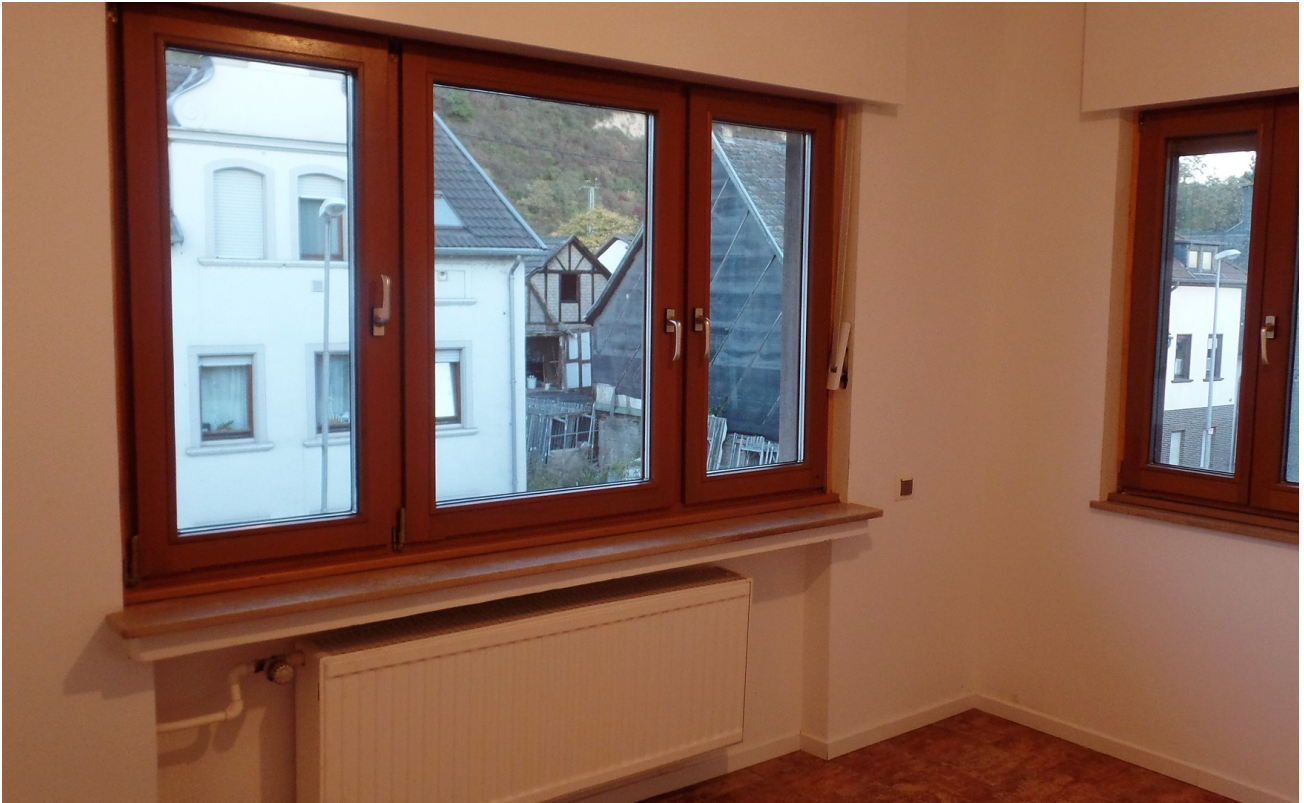
Küche - Beispiel aus 2.OG