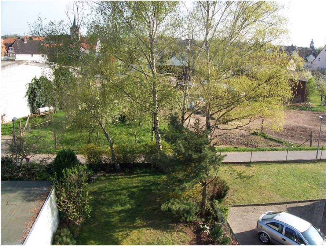
Blick auf Grünzone