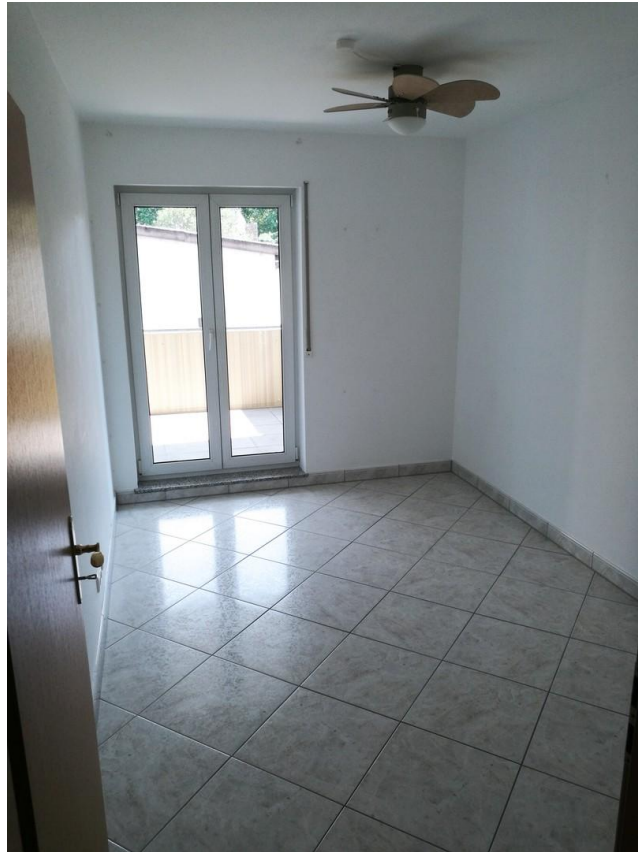
Kinderzimmer/ Arbeitszimmer 2