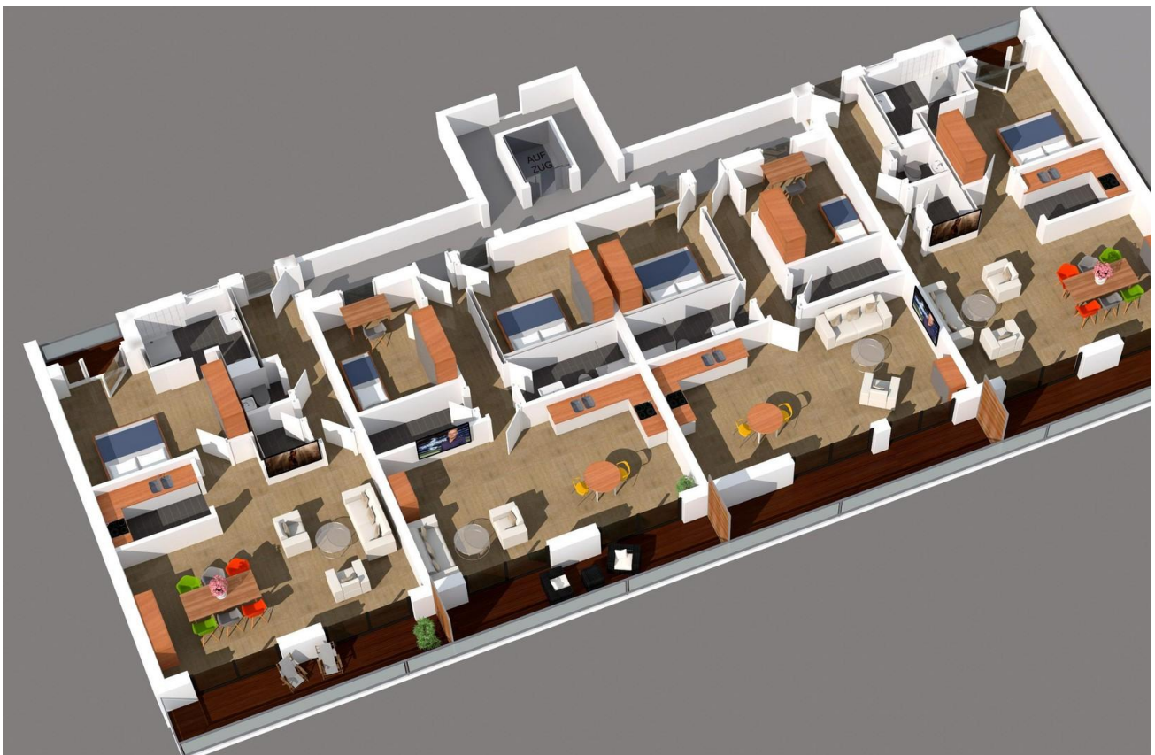
Visualisierung und Schnitt