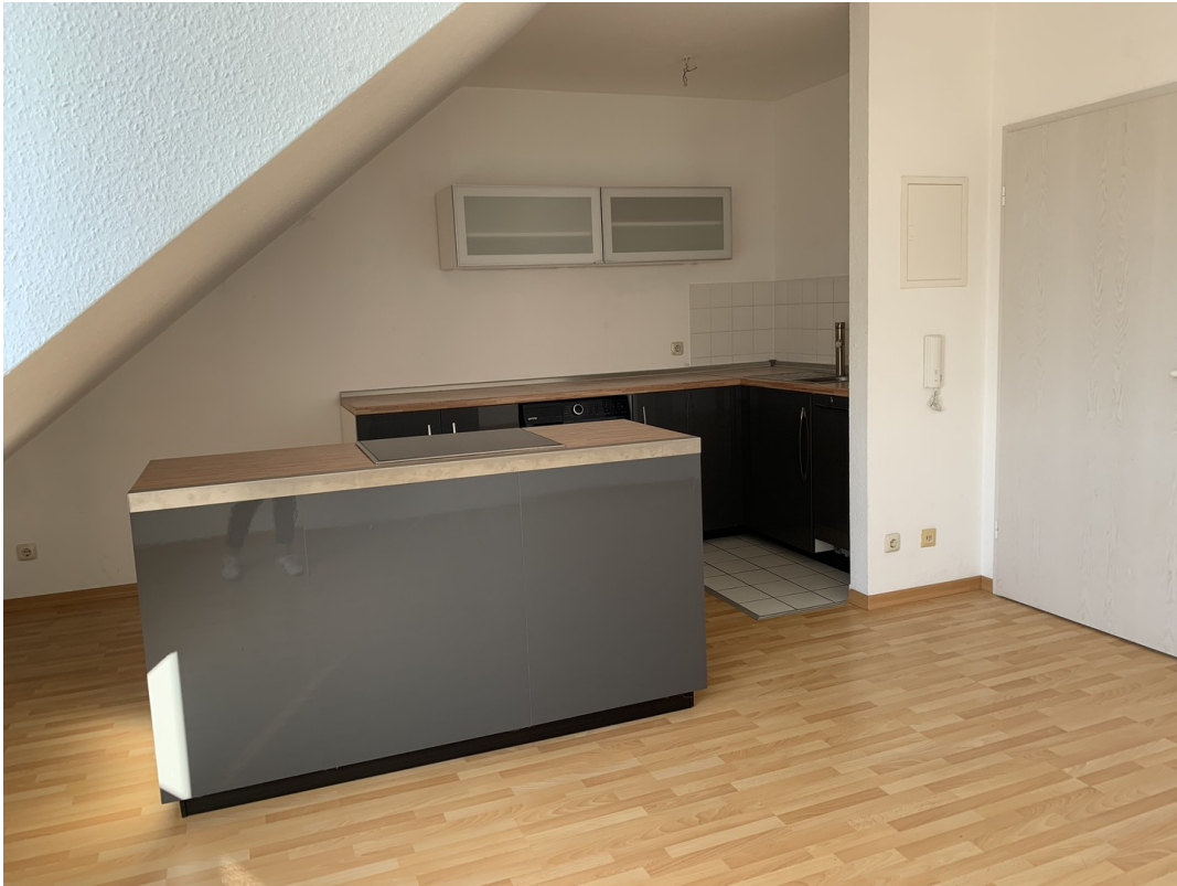
Küche inkl. aller Geräte