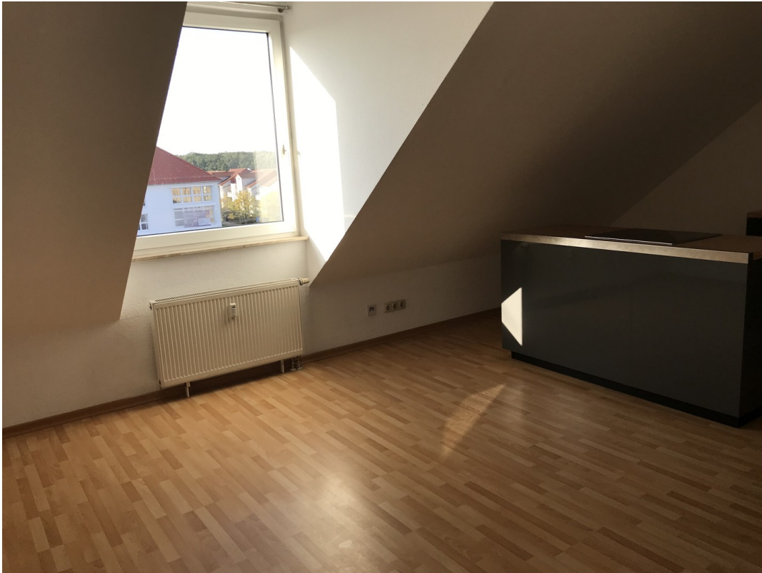
große Küche inkl. Essbereich