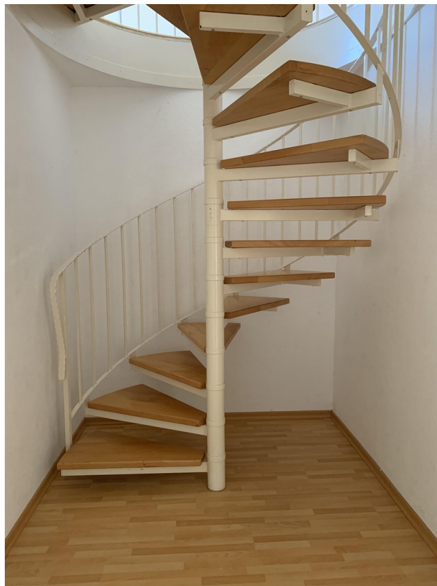
Wendeltreppe ins Studio