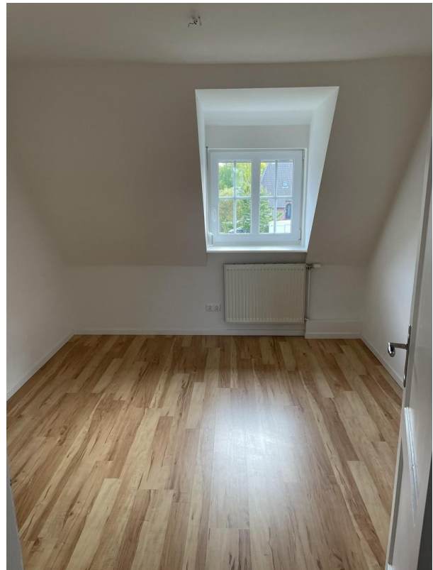
1. OG: kleines Zimmer