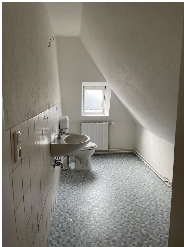
1. OG: WC