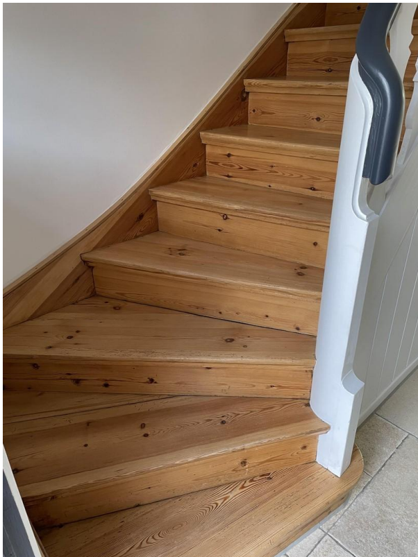
Holztreppe in das 1. OG