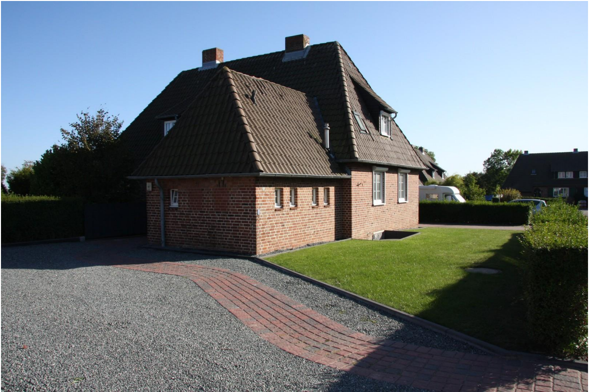
Blick aus Nordwesten