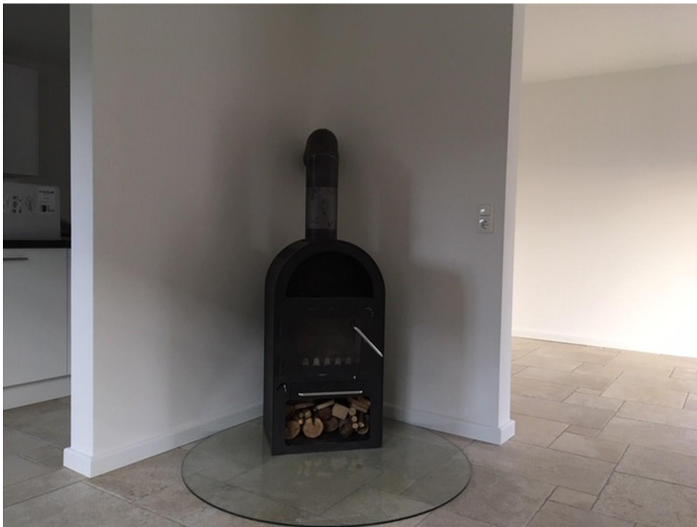
EG: Ofen im Wohnzimmer