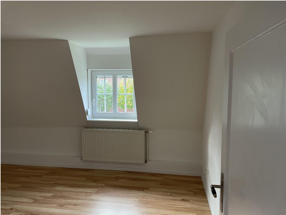
1. OG: großes Zimmer