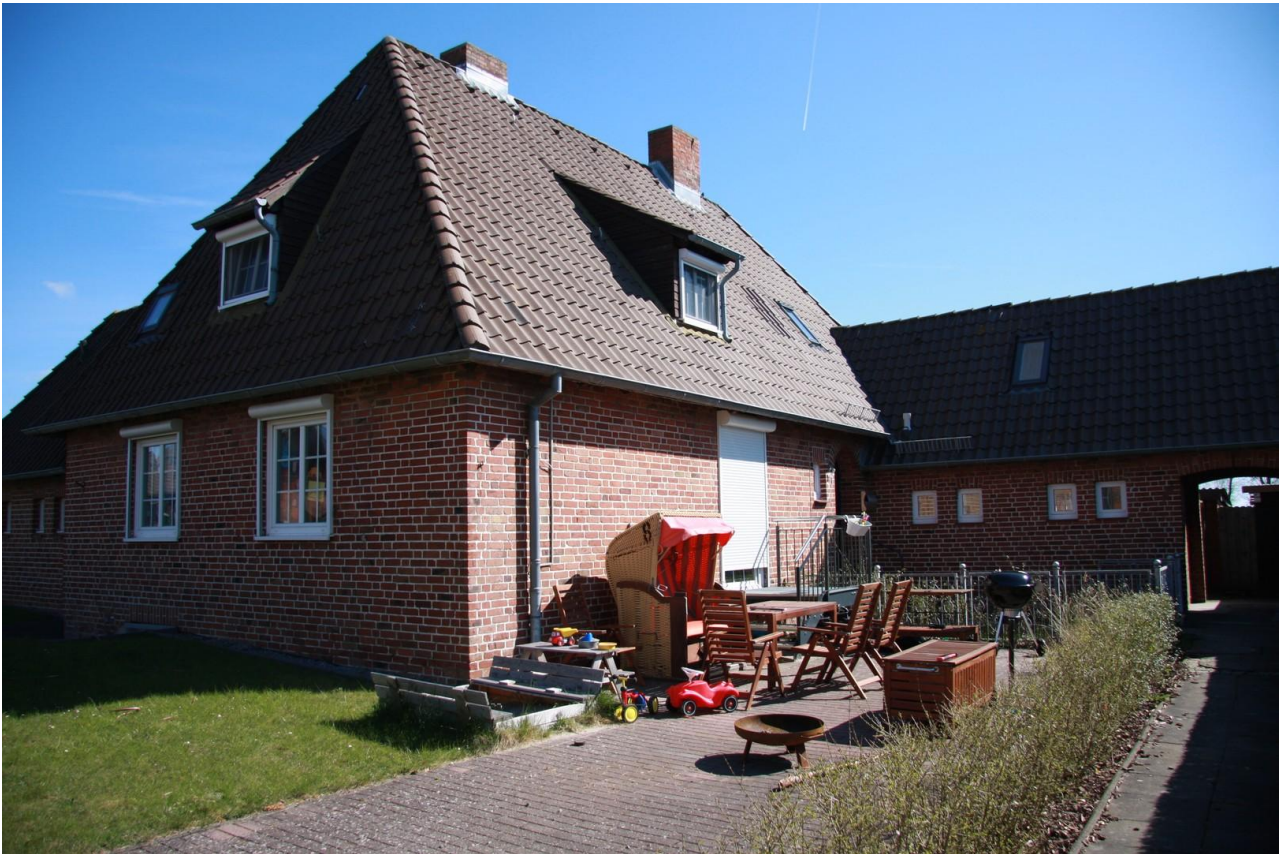
Blick aus Südwesten