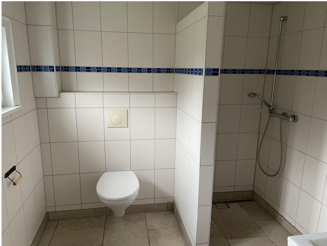
EG: Duschbad mit WC