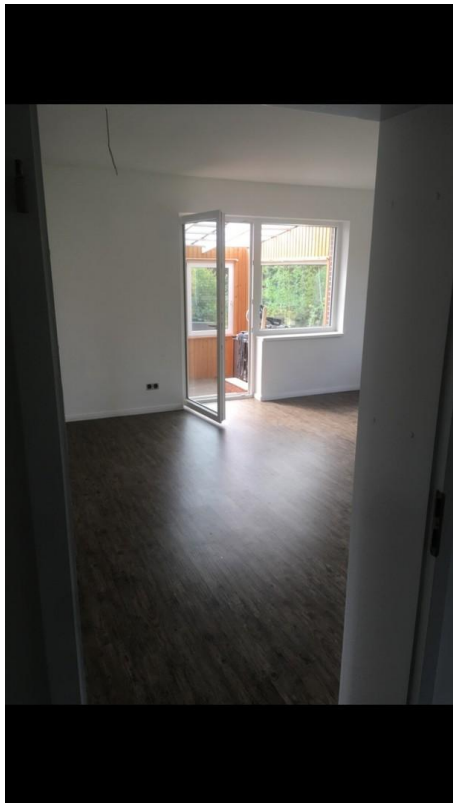
Wohnzimmer Zugang Wintergarten