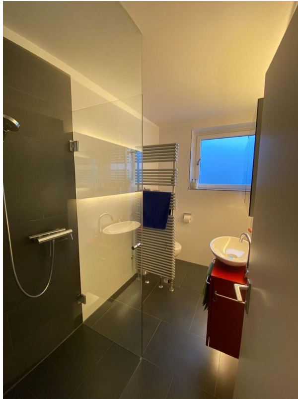
Bad, Dusche links