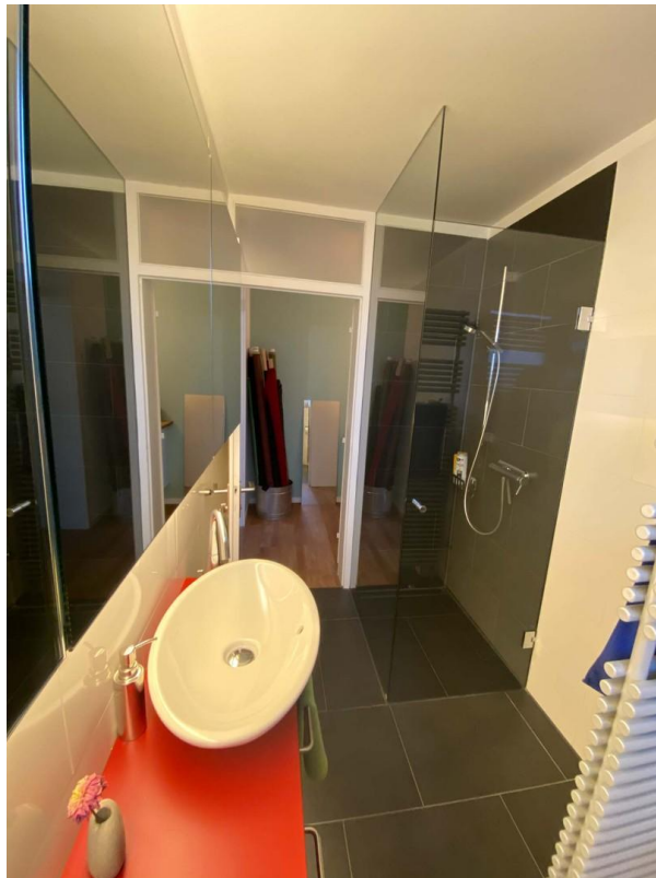
Bad, Dusche rechts