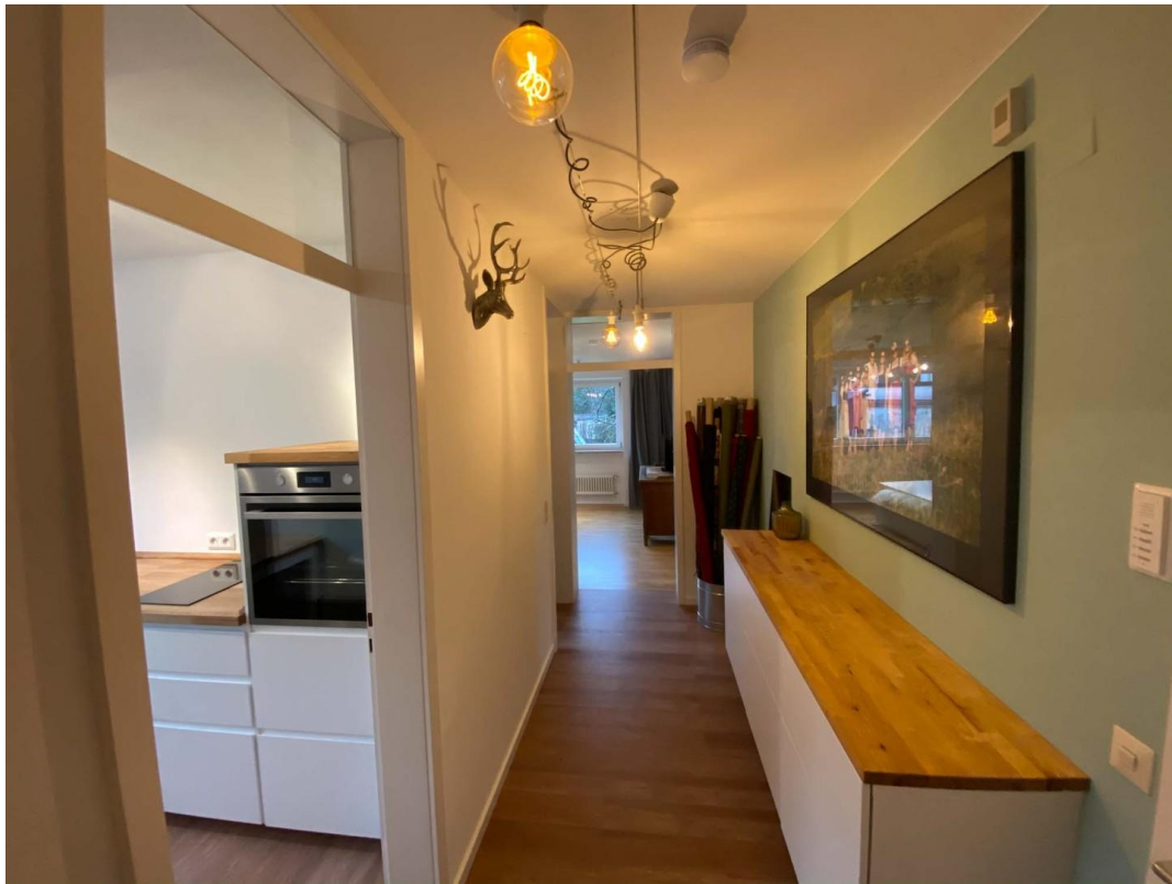
Flur, links Küche