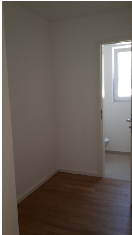
Flur mit Garderobenplatz + WC