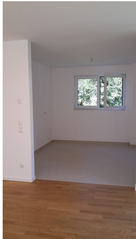
offene Küche zum Wohnzimmer