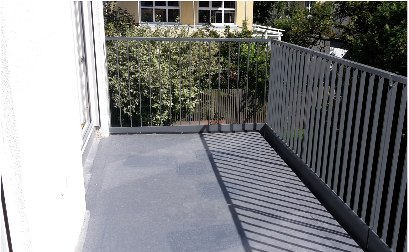
Balkon Blick Richtung Nord/Ost