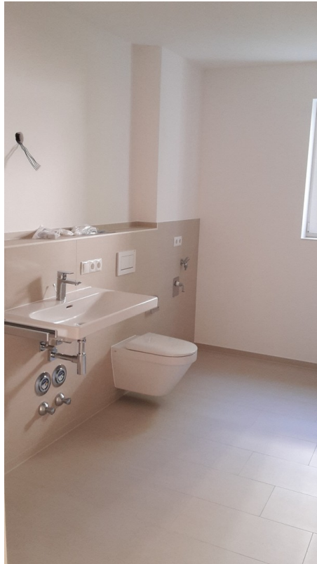
Bad mit Waschmaschinenanschluss