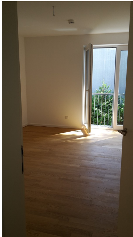
Kinder-/Arbeitszimmer 2 x