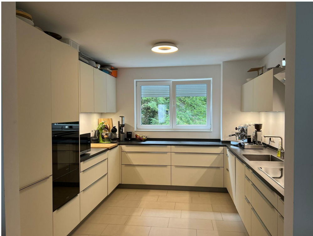
Einbauküche zur Ablöse