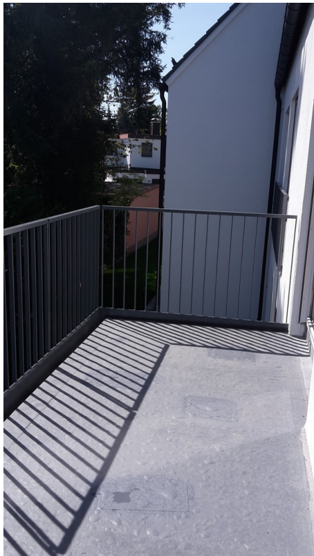
Balkon Blick Richtung Süd