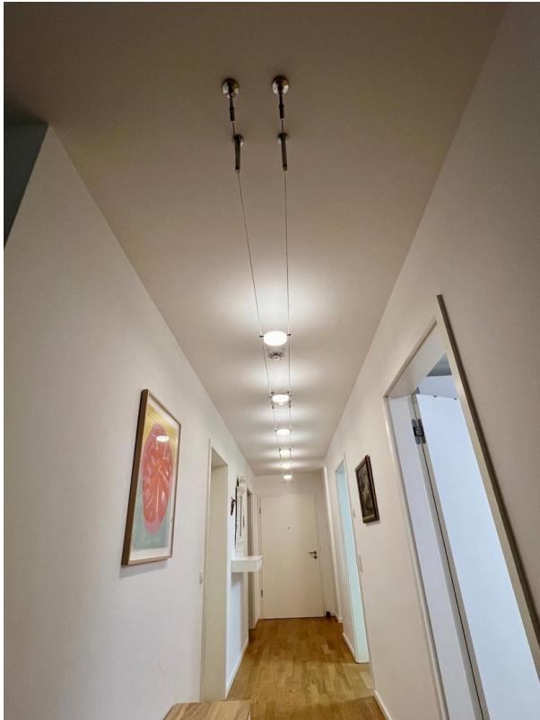
Deckenleuchte zur Ablöse