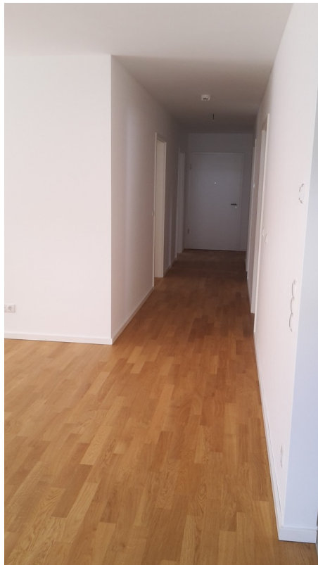
Flur Blick Richtung Eingang