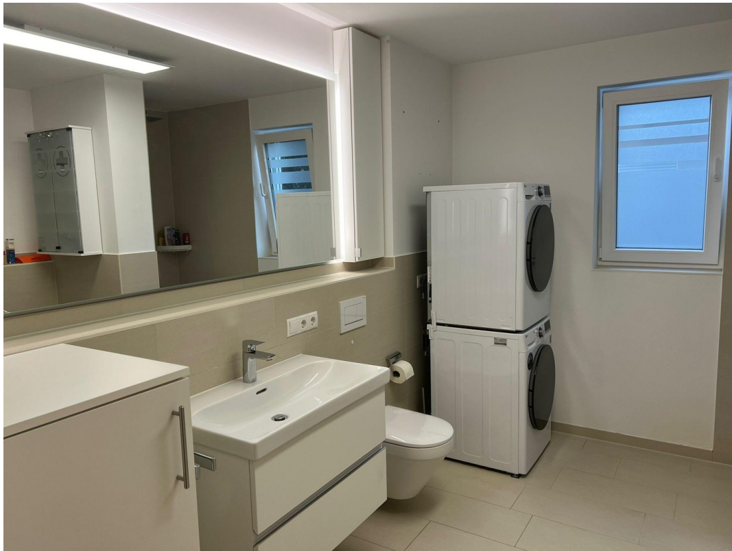
div. Badmöbel zur Ablöse