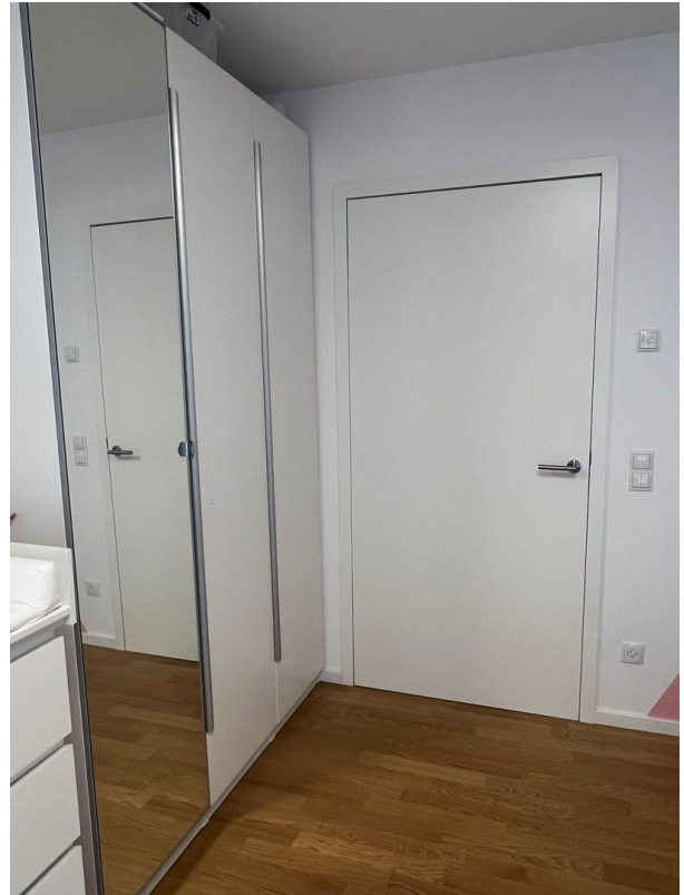
div. Einbauschränke zur Ablöse