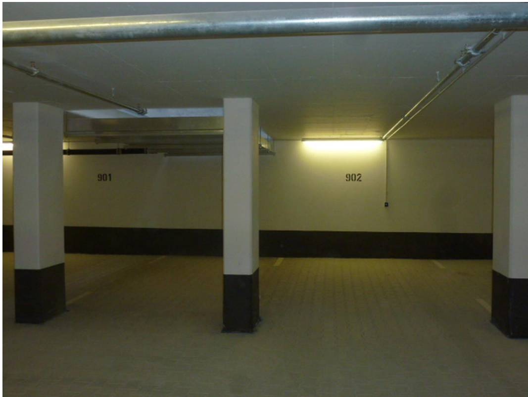
Tiefgarage m. E-Anschluß