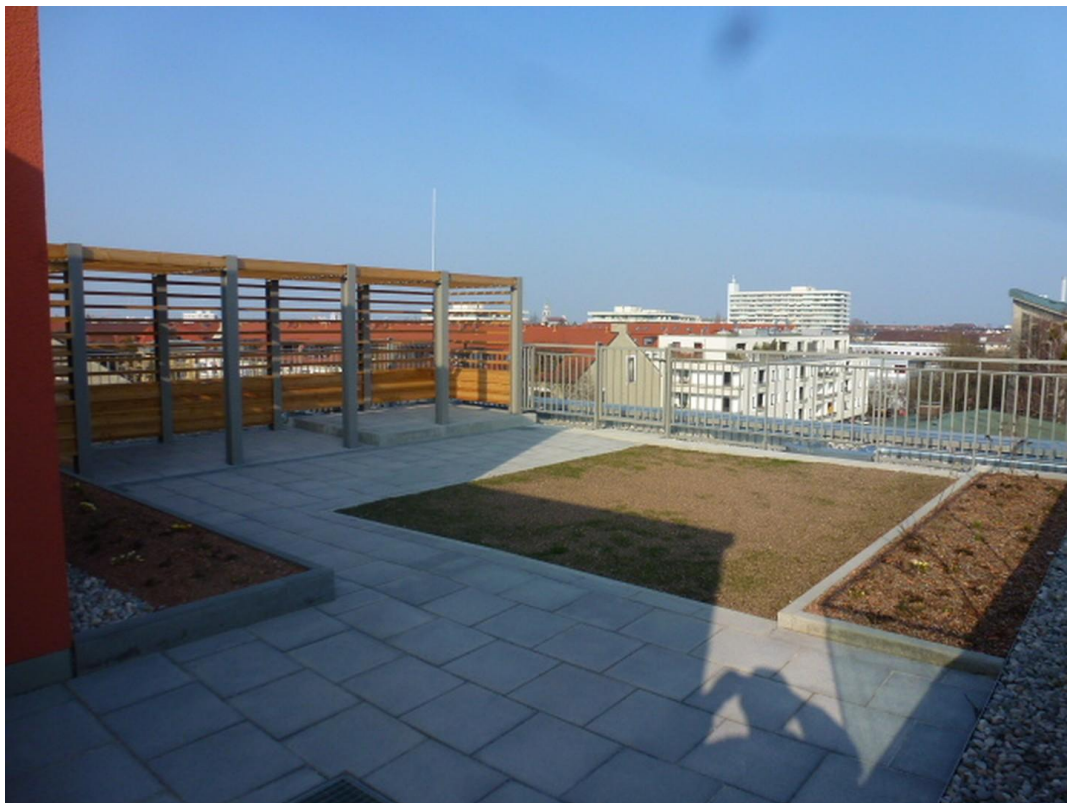
Dachterrasse für alle Bewohner