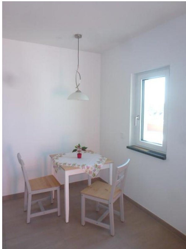
Eßbecke neben Einbauküche