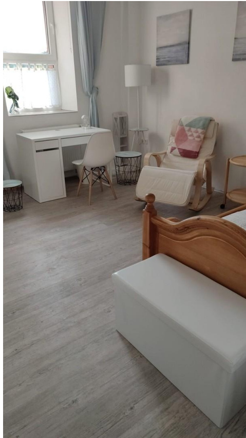
Zi 2 mit Storage-Box