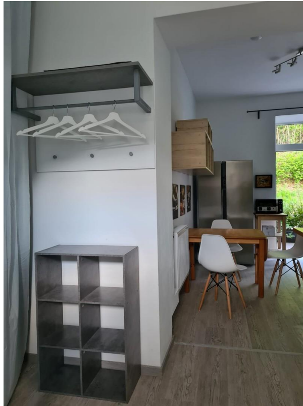
Eingang mit offener Küche