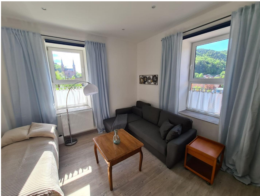
Zi 1: Tagesbett + Schlafcouch