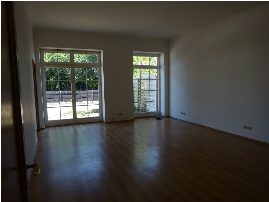
Schlafzimmer I, Terrassenblick