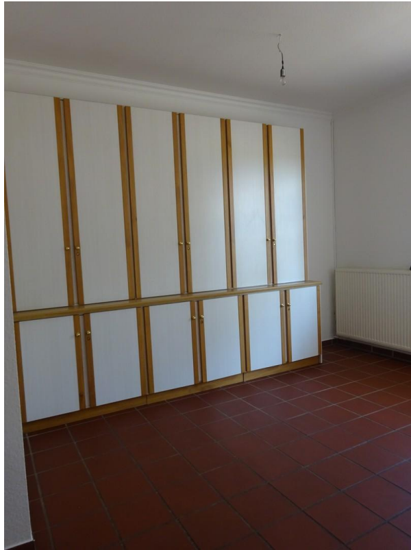
Küche / Einbauschränk