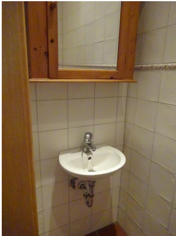
Gäste - WC