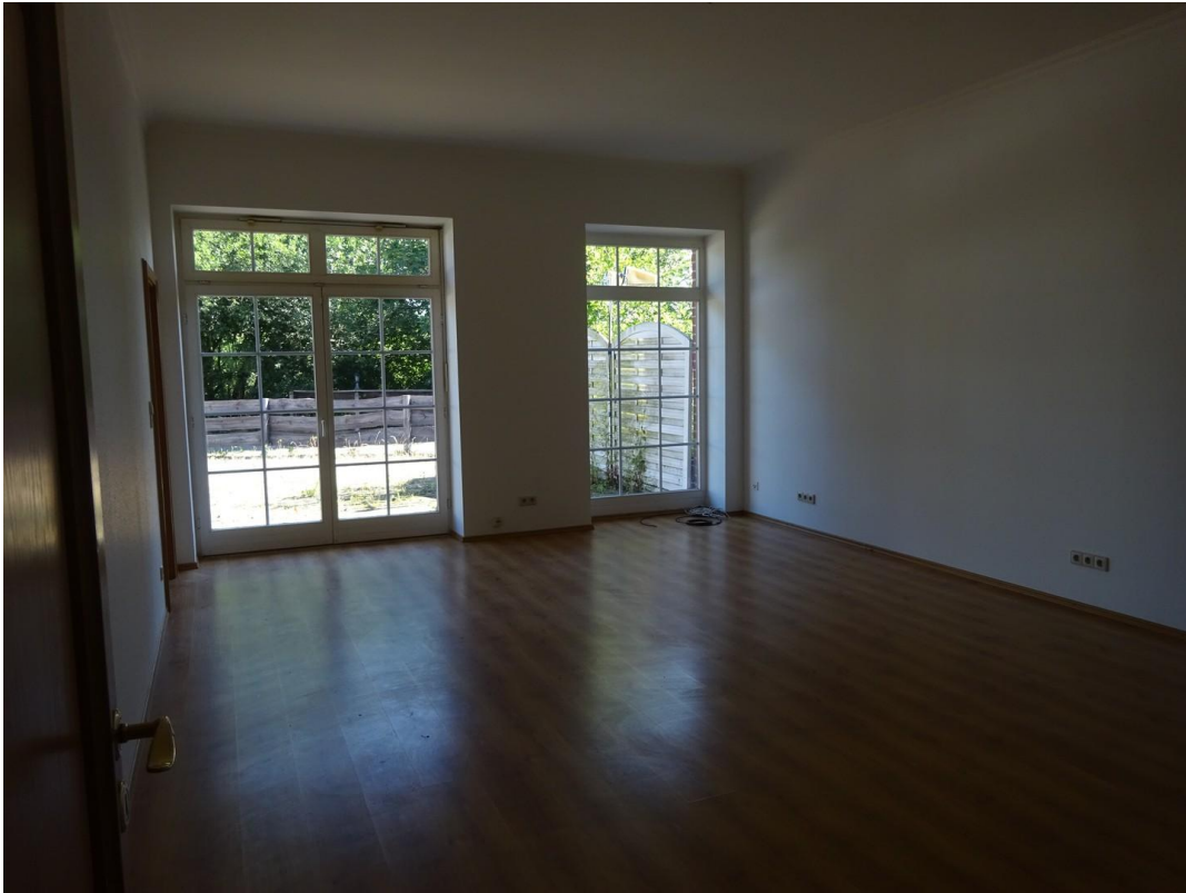
Schlafzimmer I, Terrassenblick