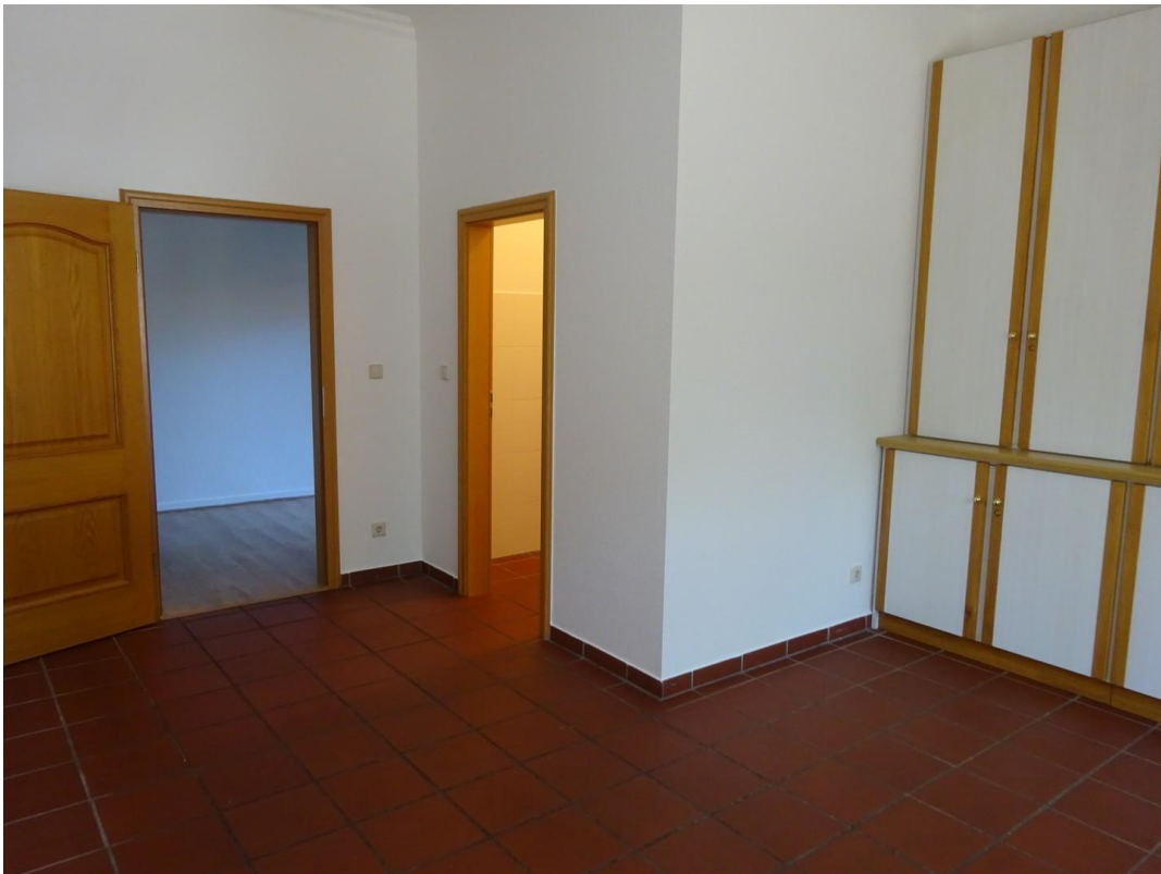
Kücheneingang / Speisekammer