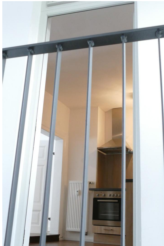
Blick durch die Eingangstür