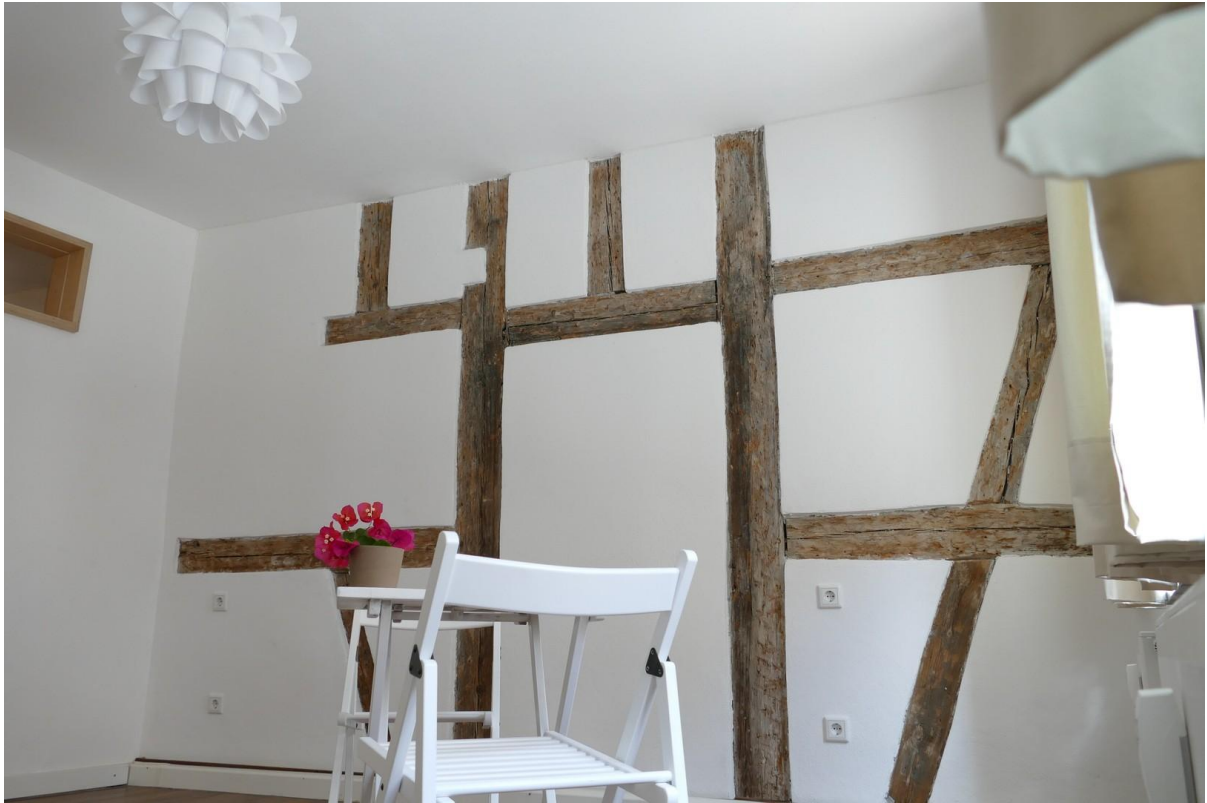
Wohn- und Schlafbereich