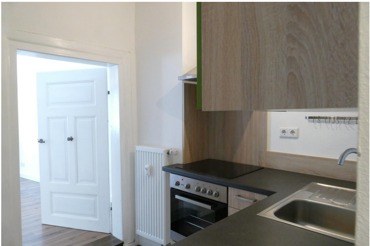
Essbereich mit Einbauküche