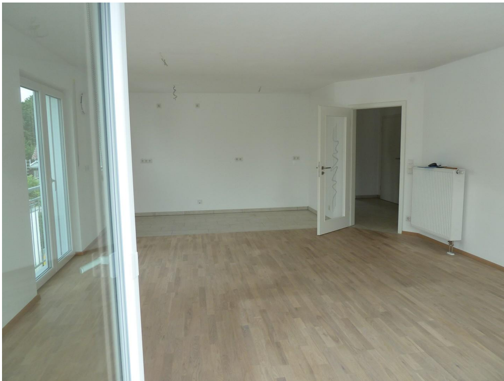
Wohn-Esszimmer ohne Küche