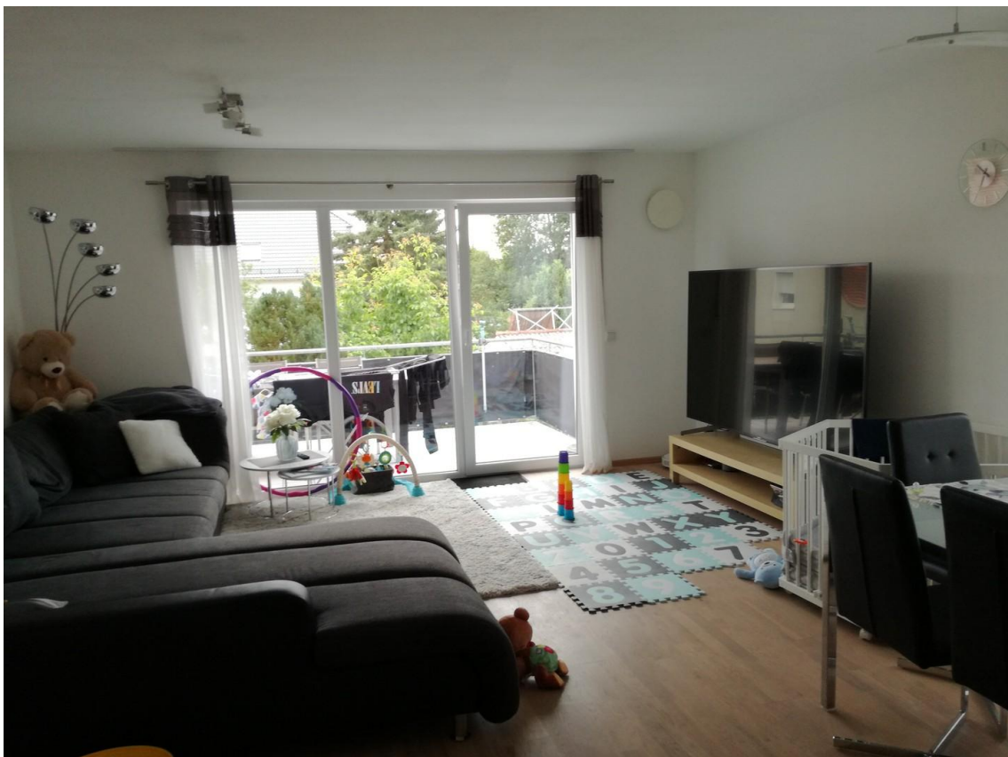
Wohn-Esszimmer mit Balkon