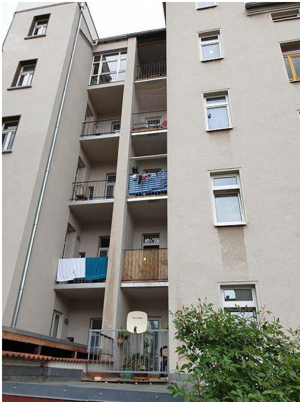
Hofansicht mit Balkonen