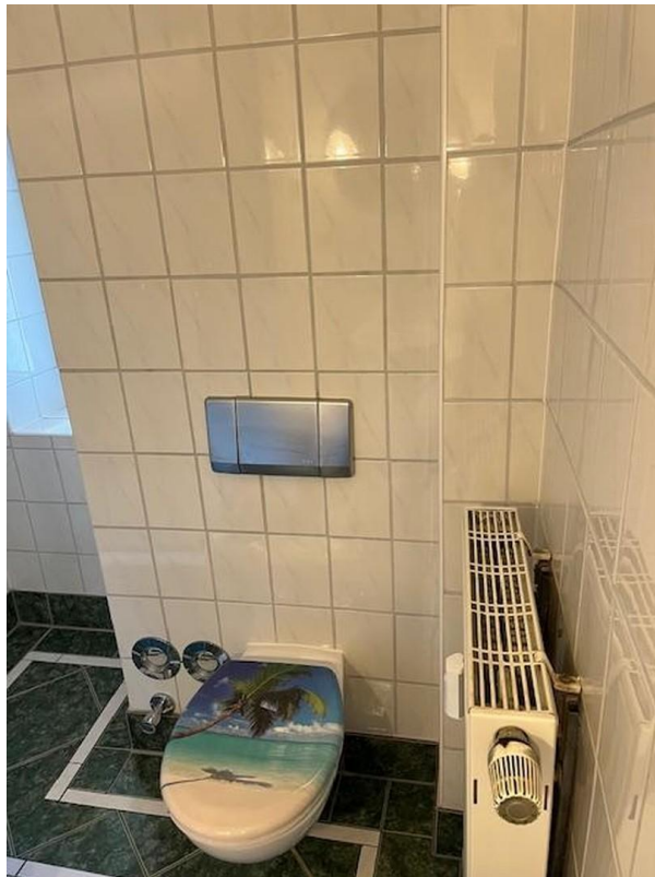
Bad 2. Ansicht