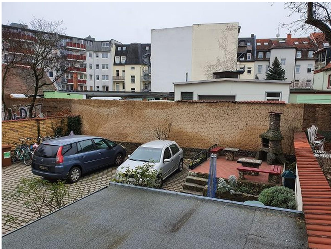
Hofansicht mit Stellpätzen