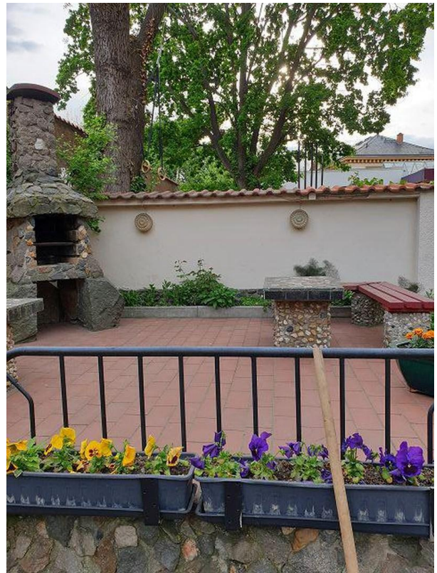
Hof mit kleinem Grillplatz