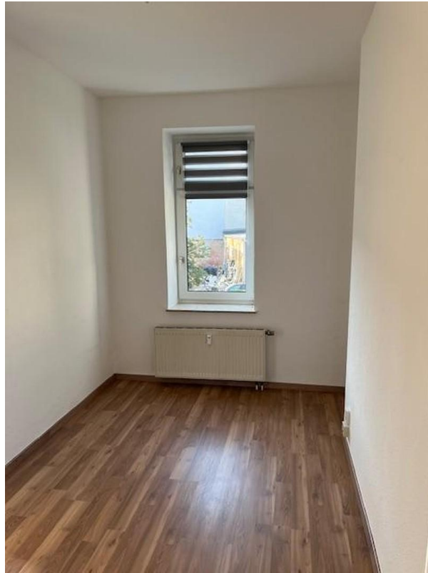
Zimmer 1 mit Balkon