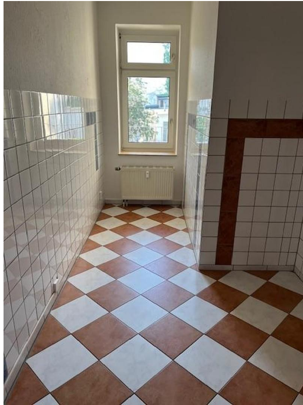
Küche Ansicht 1