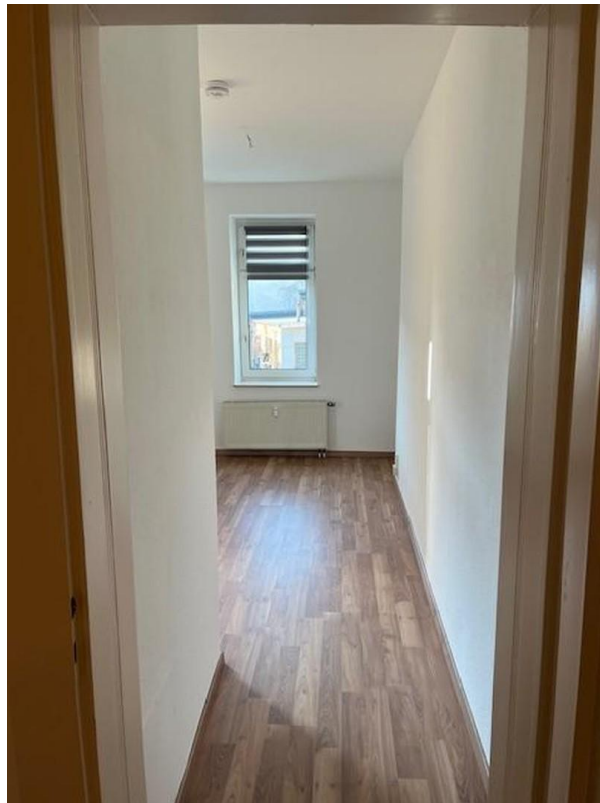
Zimmer 1 Ansicht 2