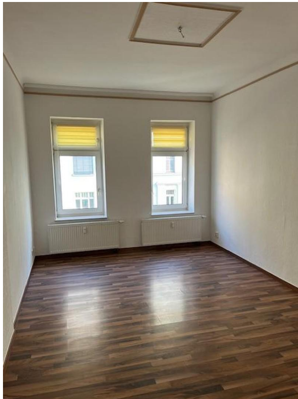
Wohnzimmer Ansicht 1