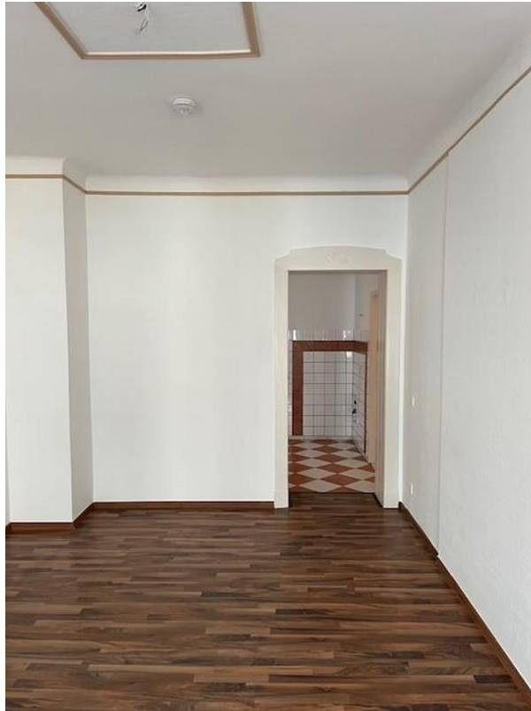
Wohnzimmer Ansicht 2