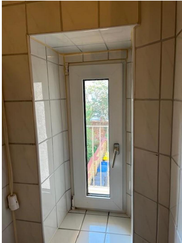
Bad mit Fenster