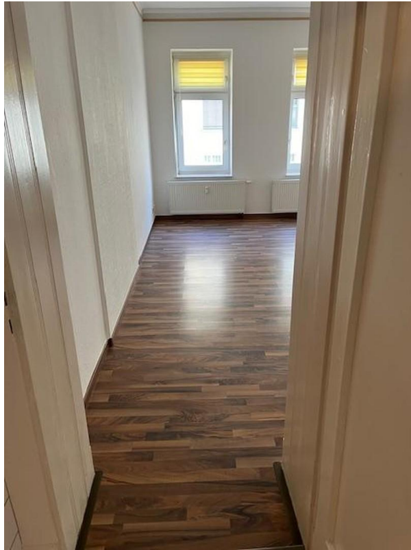
Wohnzimmer Zugang über Küche