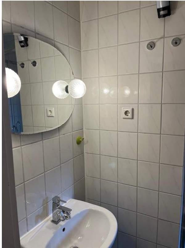
Bad mit Spiegel