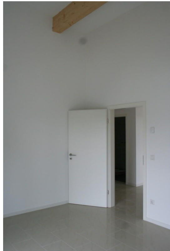
Teilansicht hohe Wohnräume