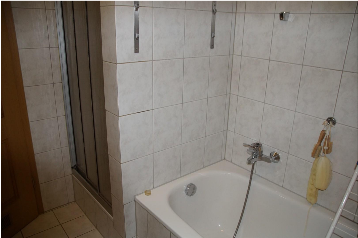
Badewanne mit Dusche