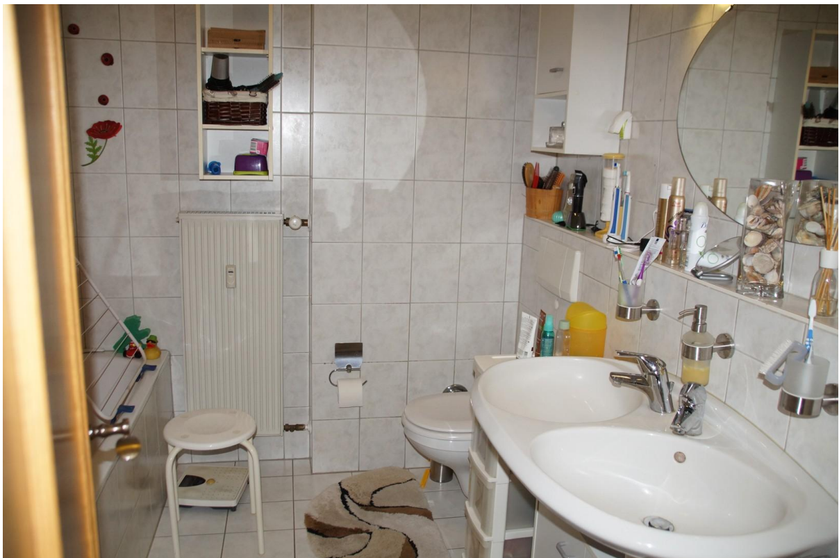
Badezimmer mit WC