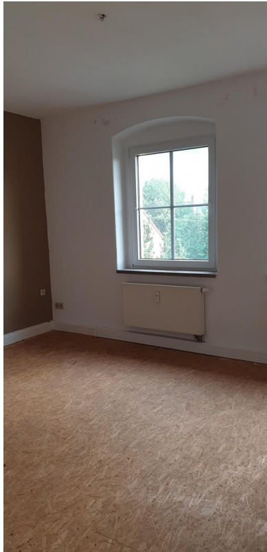
Blick in die Stube