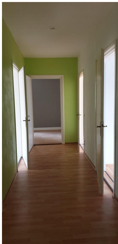
Blick in die Wohnung