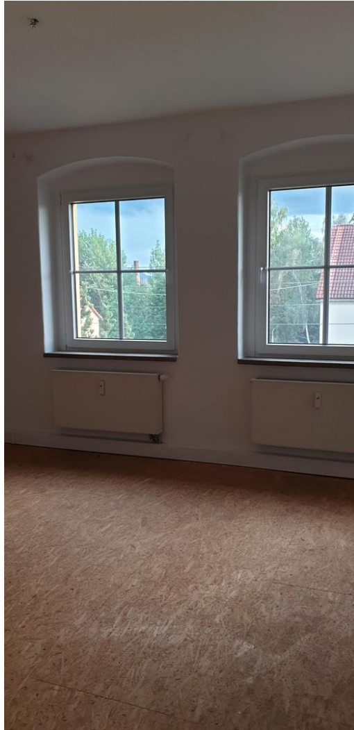
Blick in die Stube