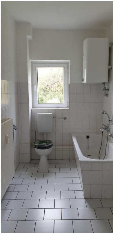
Blick in das Bad