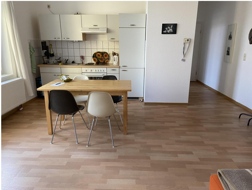
Wohnzimmer mit Einbauküche