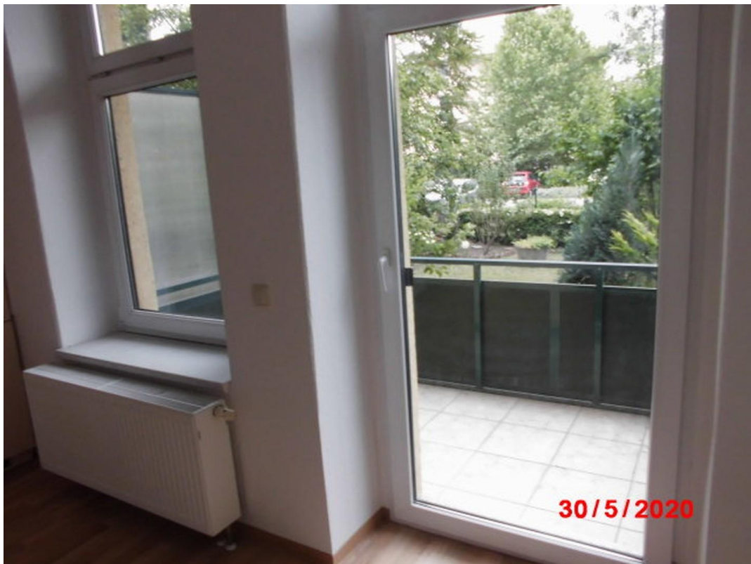
Blick zum Balkon