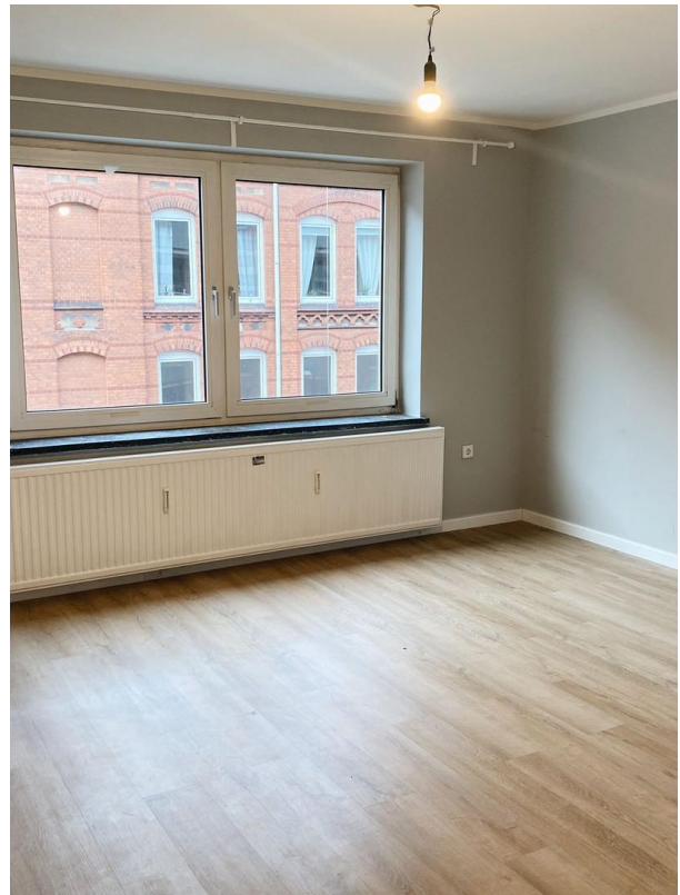
Wohnzimmer Blickr. Straße