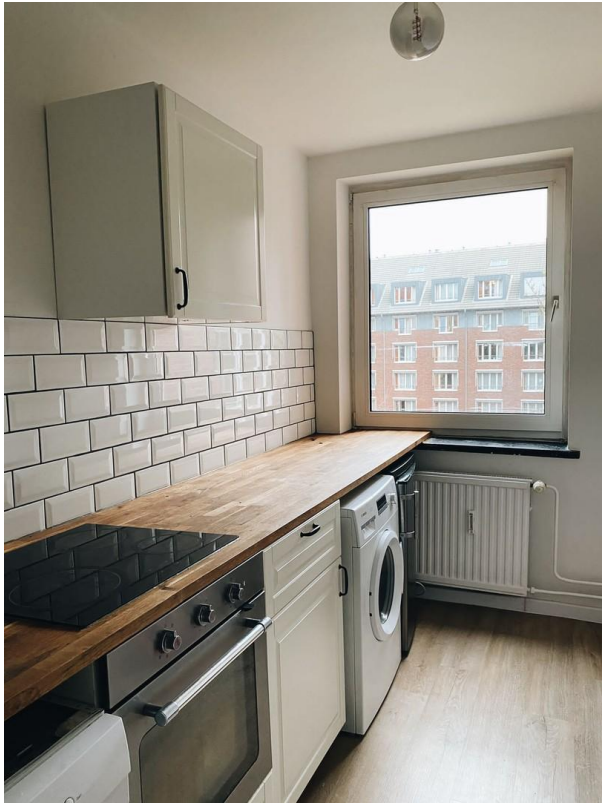
Küche Blickr. Hof