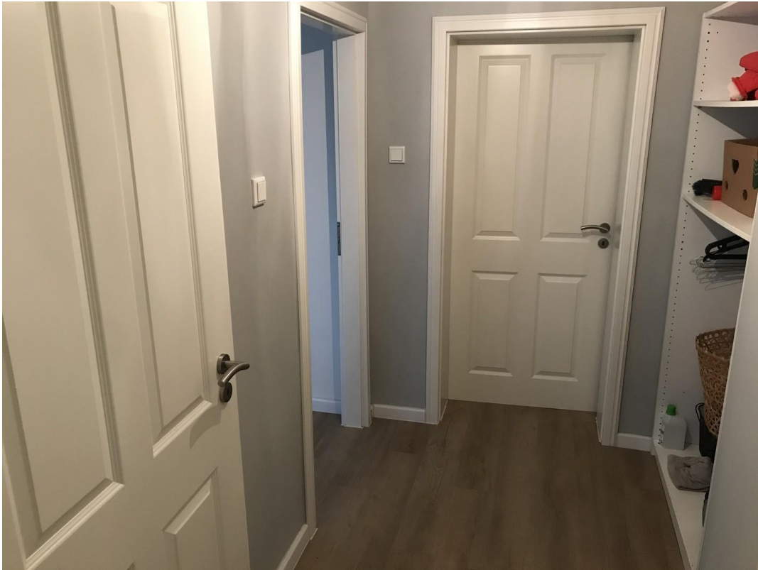
Flur Blickr. Schlafzimmer