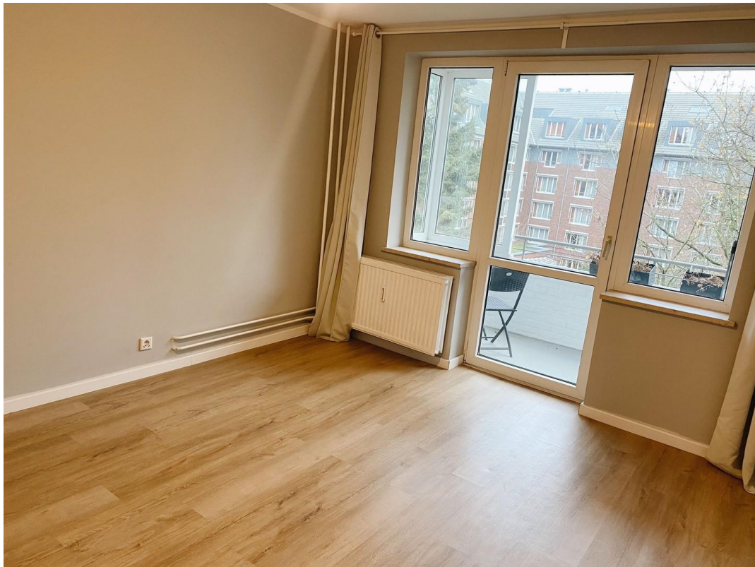
Schlafzimmer Blickr. Balkon