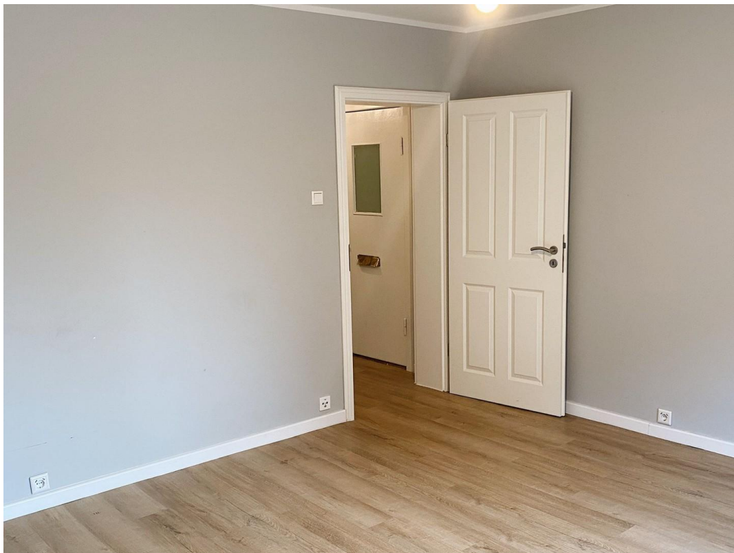
Wohnzimmer Blickr. Flur