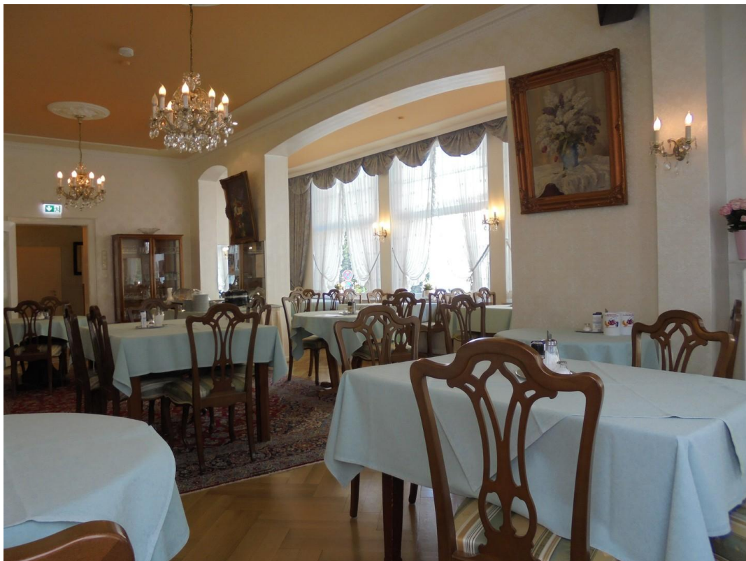
Speisezimmer 60m 2