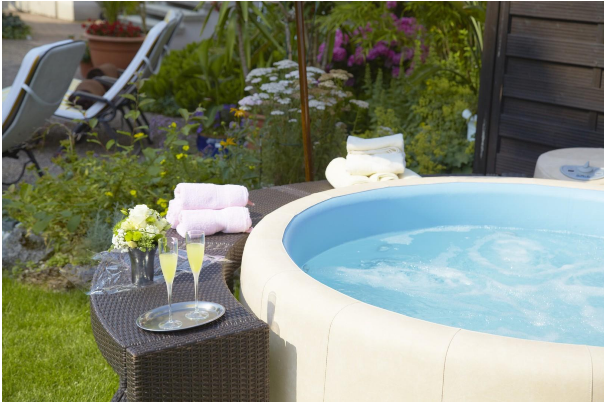
Whirlpool im Garten