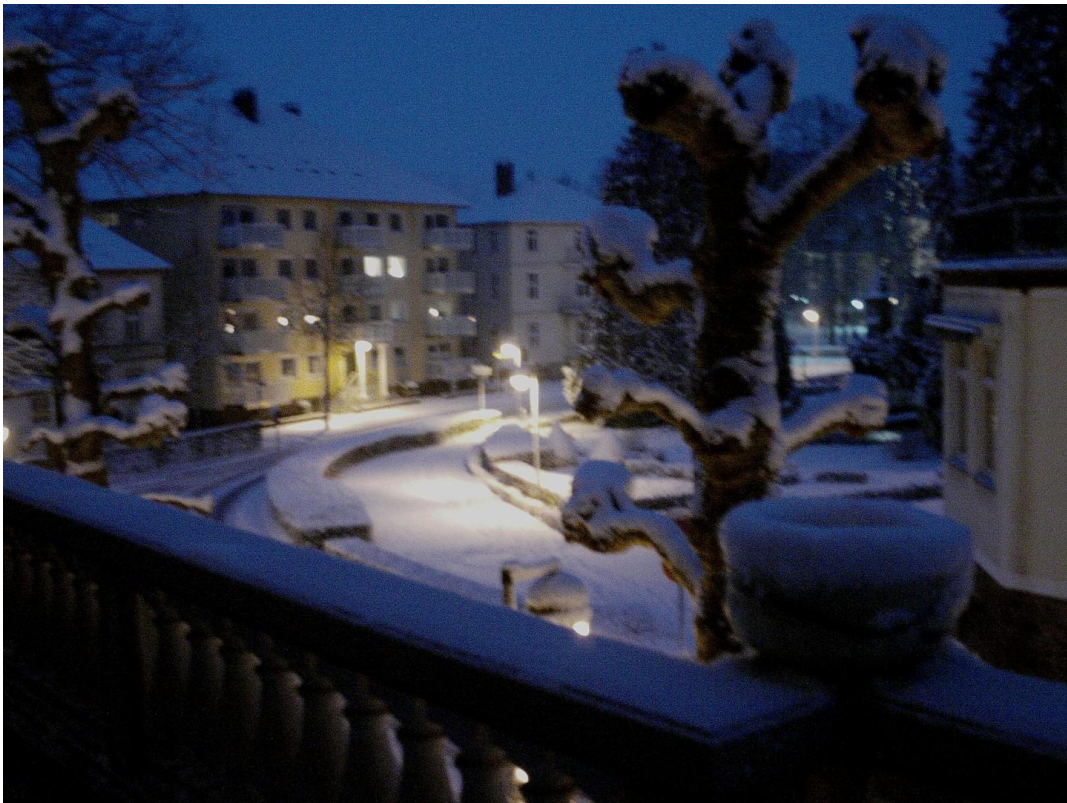
Winterausblick von Terrasse