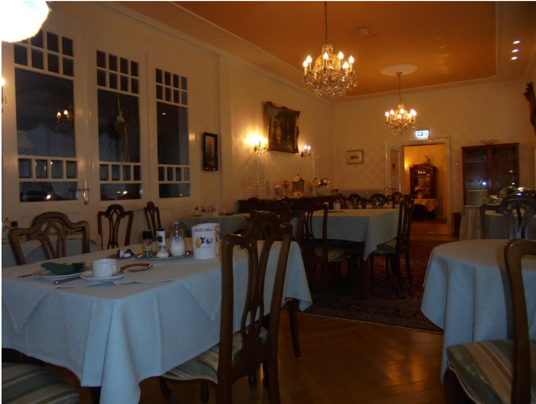
Speisezimmer am Abend