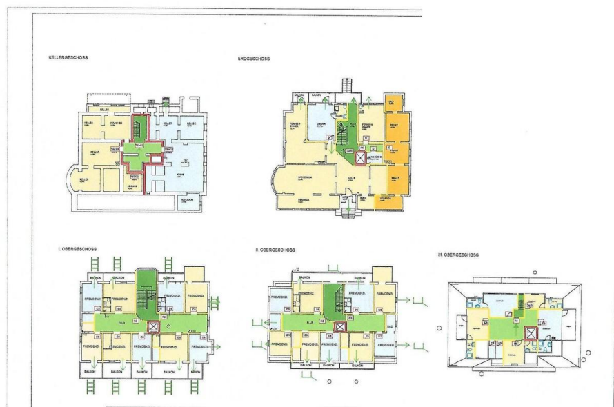
Grundrisse des Hauses