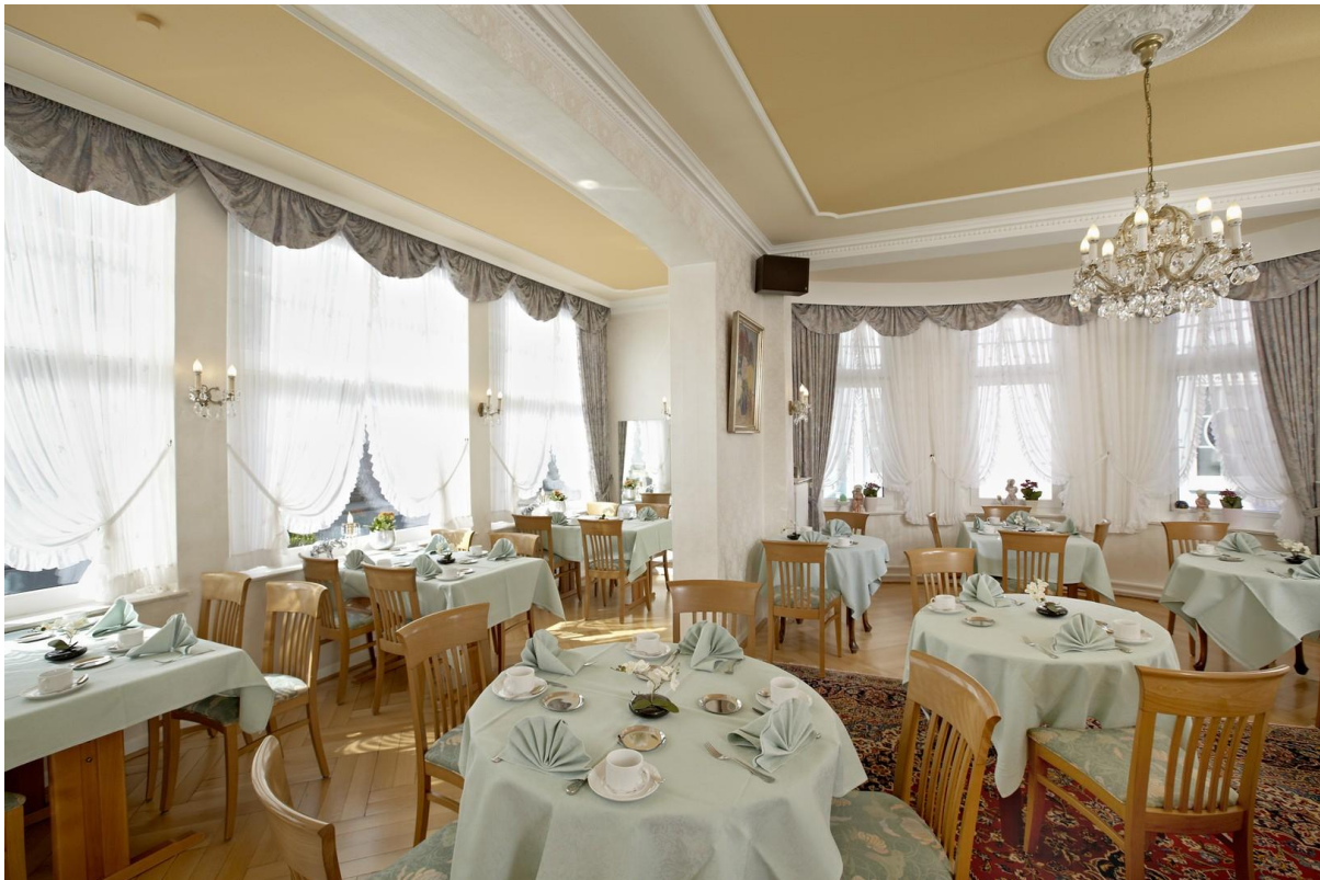
Speisezimmer 60m 2