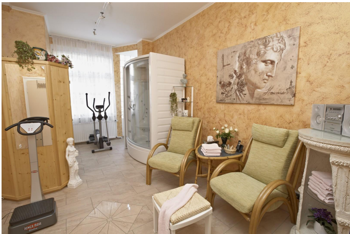
Sauna & Dampfbad