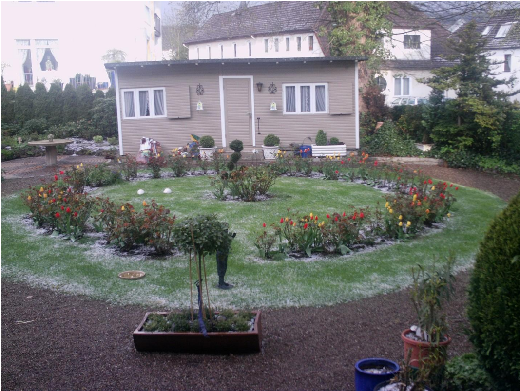
Gartenhaus Garten im Winter