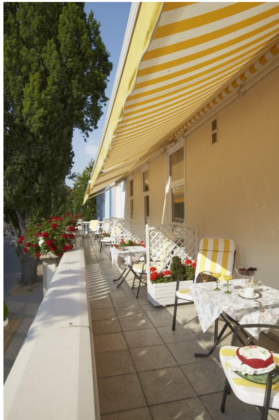
Terrasse 1. Etage