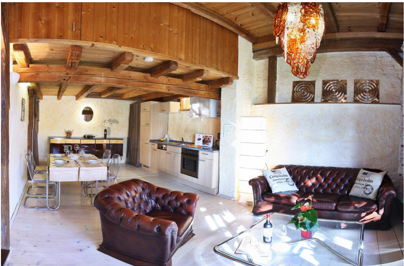
Wohnen Essen Kochen