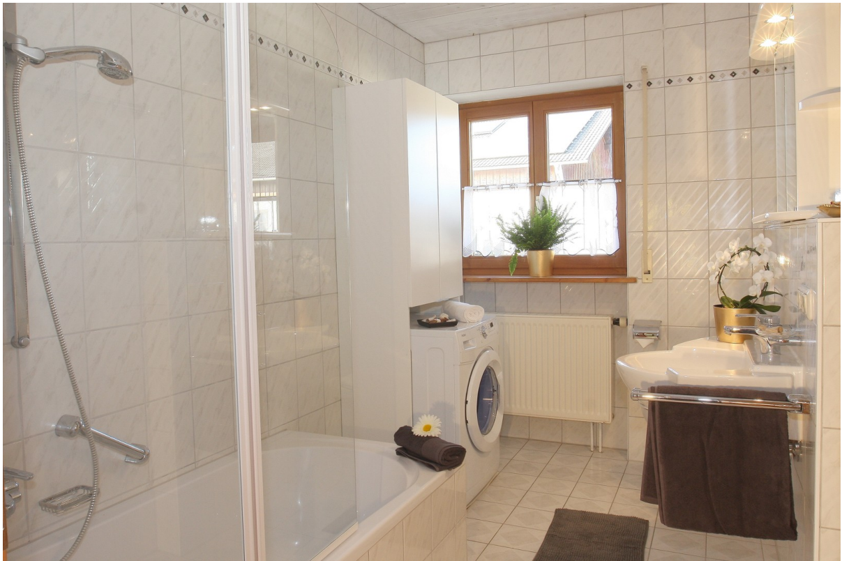
Bad: Wanne, Dusche, Rolladen