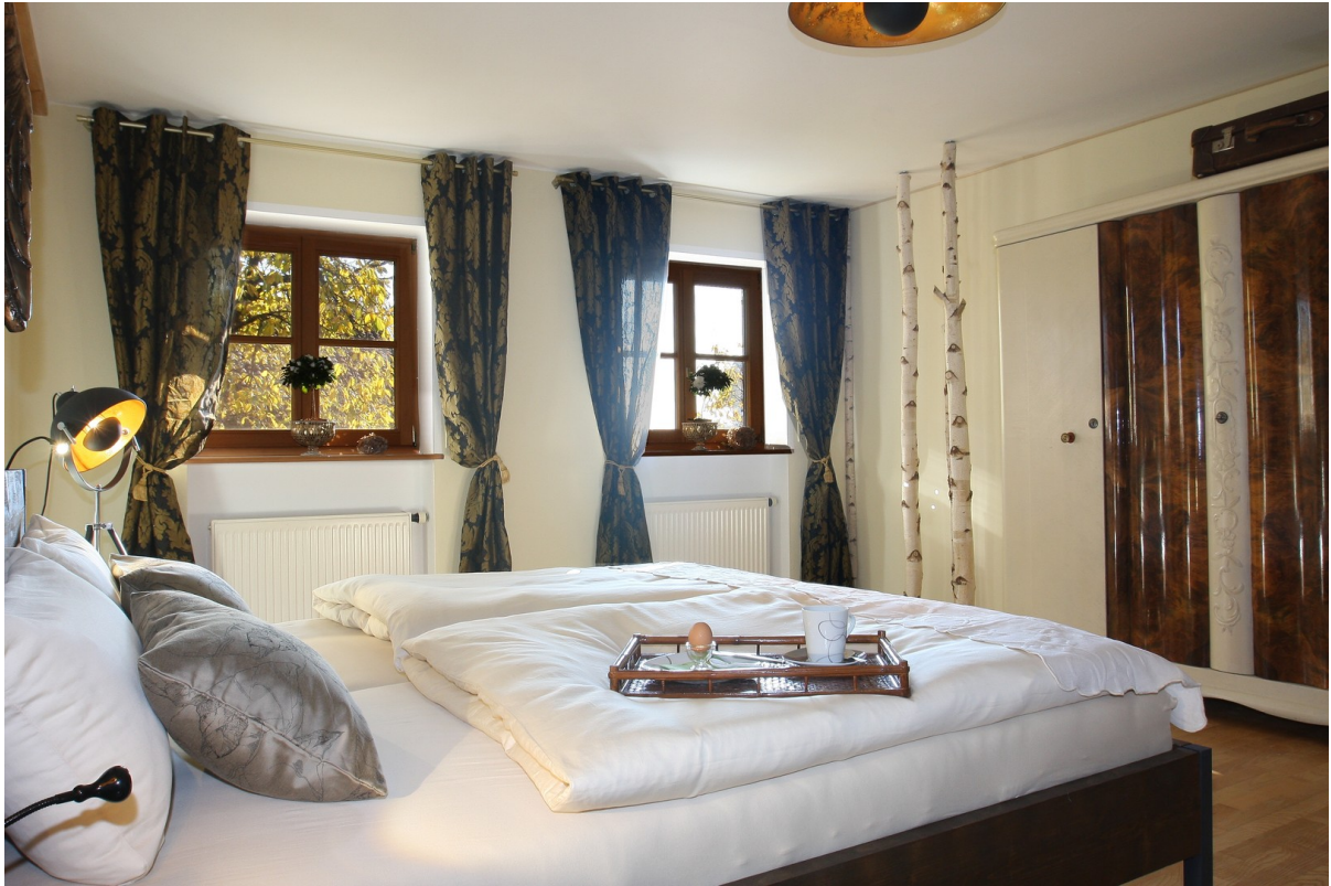
Schlafzimmer mit Rolläden