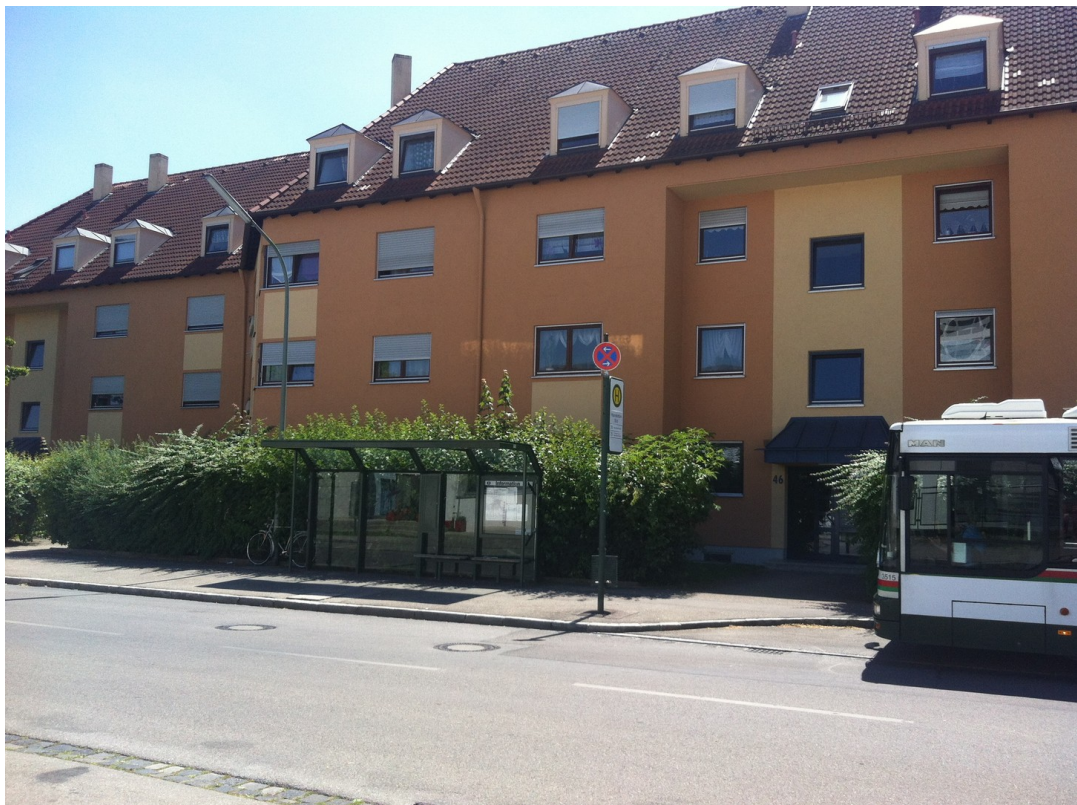
Bushaltestelle direkt vorort