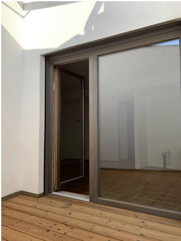
Austritt zum Lichthof