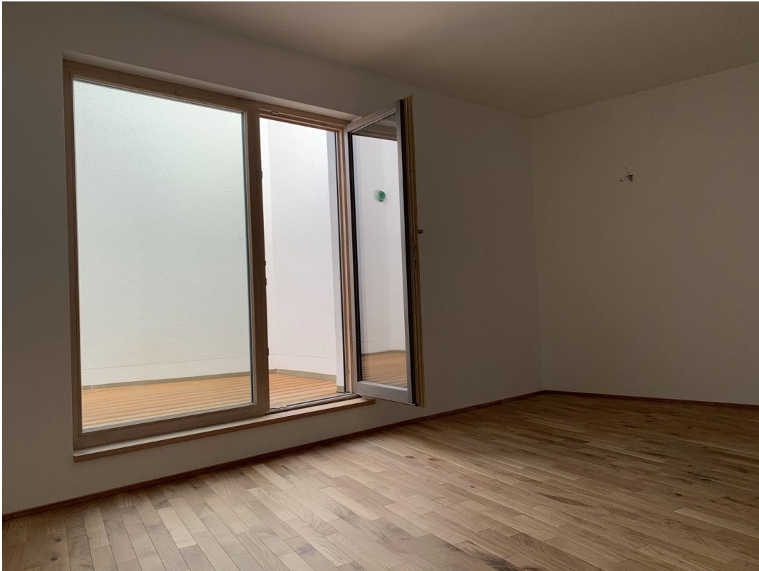
Blick in den Lichthof