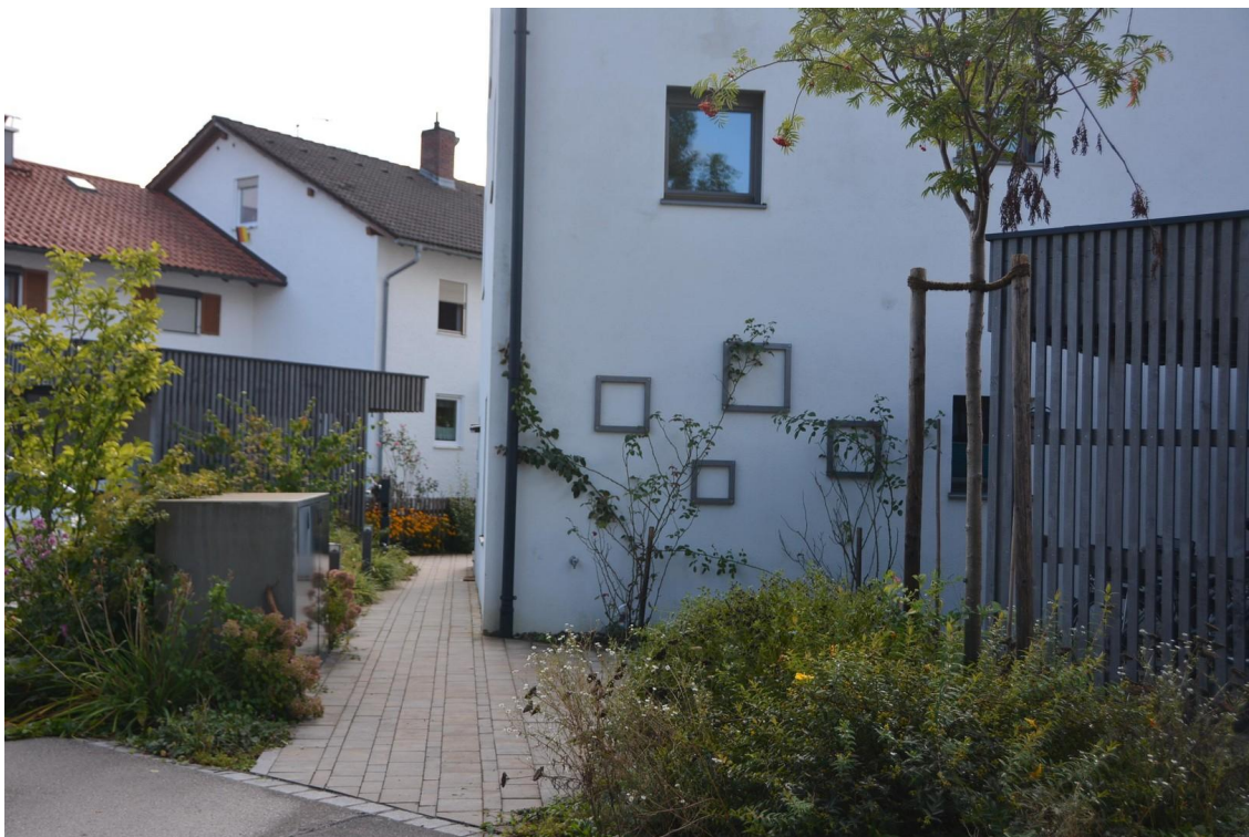
Fußweg zum Hauseingang