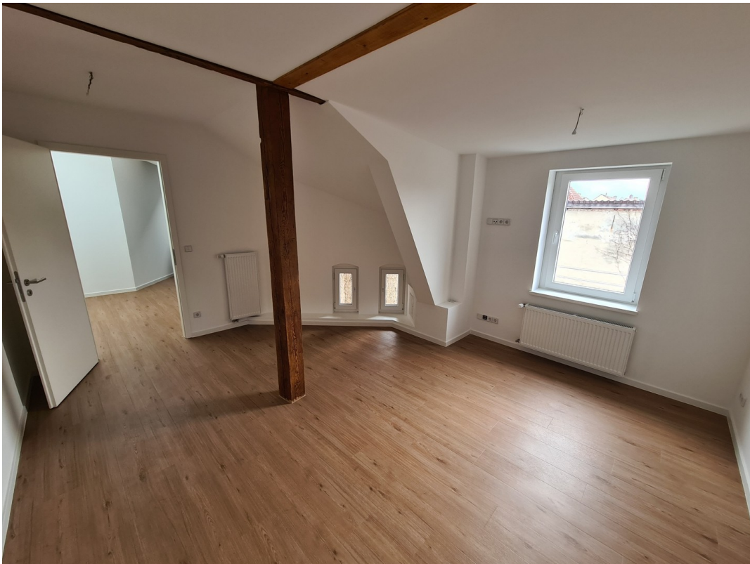
Schlafzimmer zum Innenhof