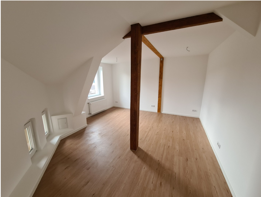
Schlafzimmer zum Innenhof