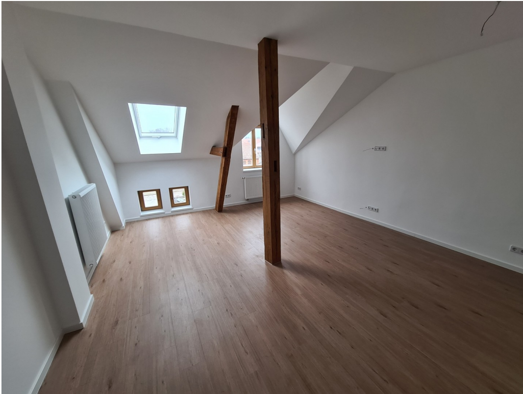
Wohnzimmer mit Blick zum Markt