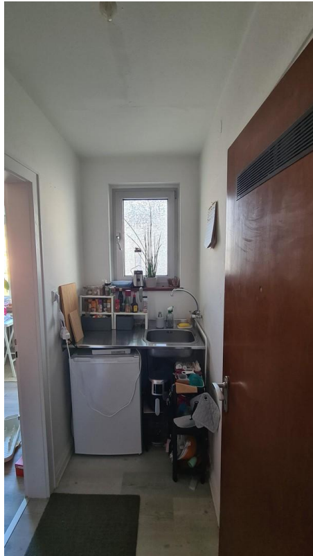
Eingang- und Küchenbereich 2