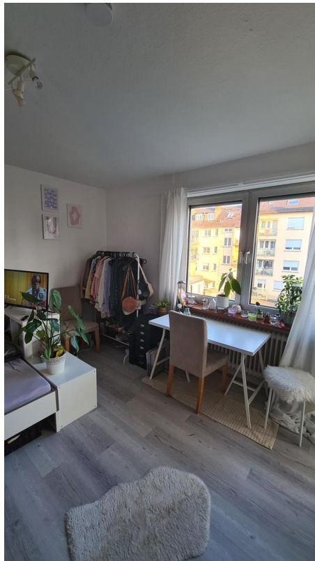
Wohn- und Schlafzimmer 3