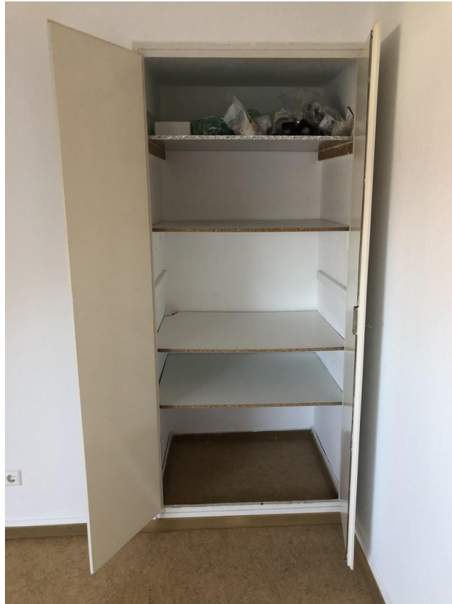
Einbauschränk im Schlafzimmer