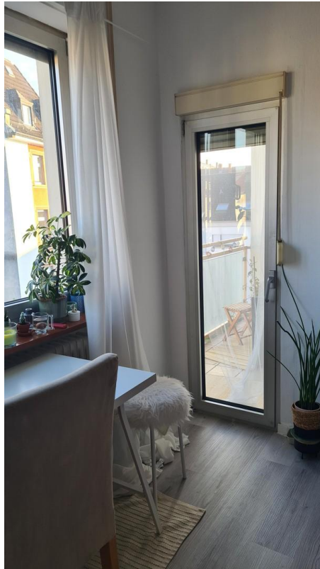
Wohn- und Schlafzimmer 4