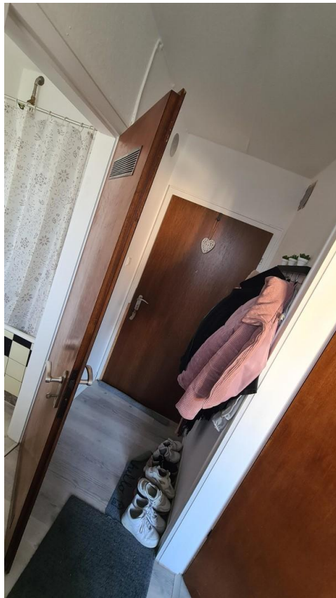
Eingang- und Küchenbereich 1