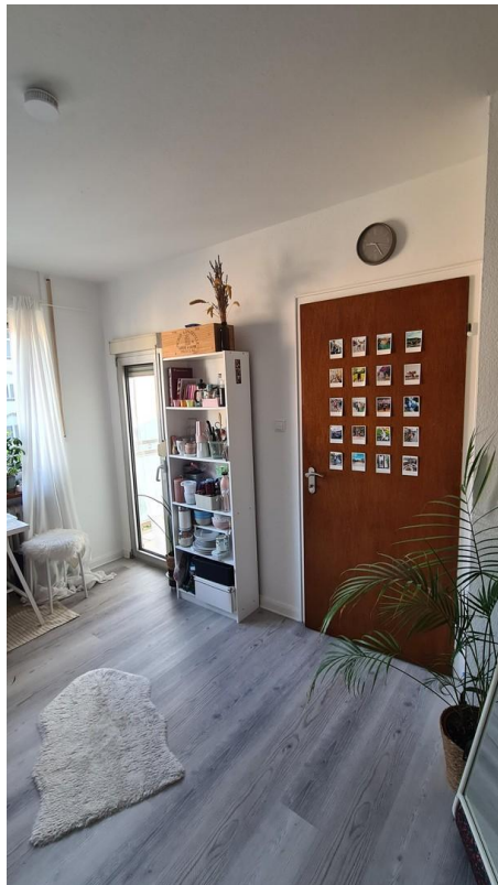
Wohn- und Schlafzimmer 1