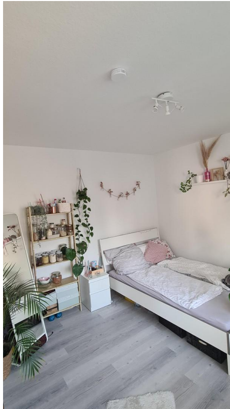
Wohn- und Schlafzimmer 2