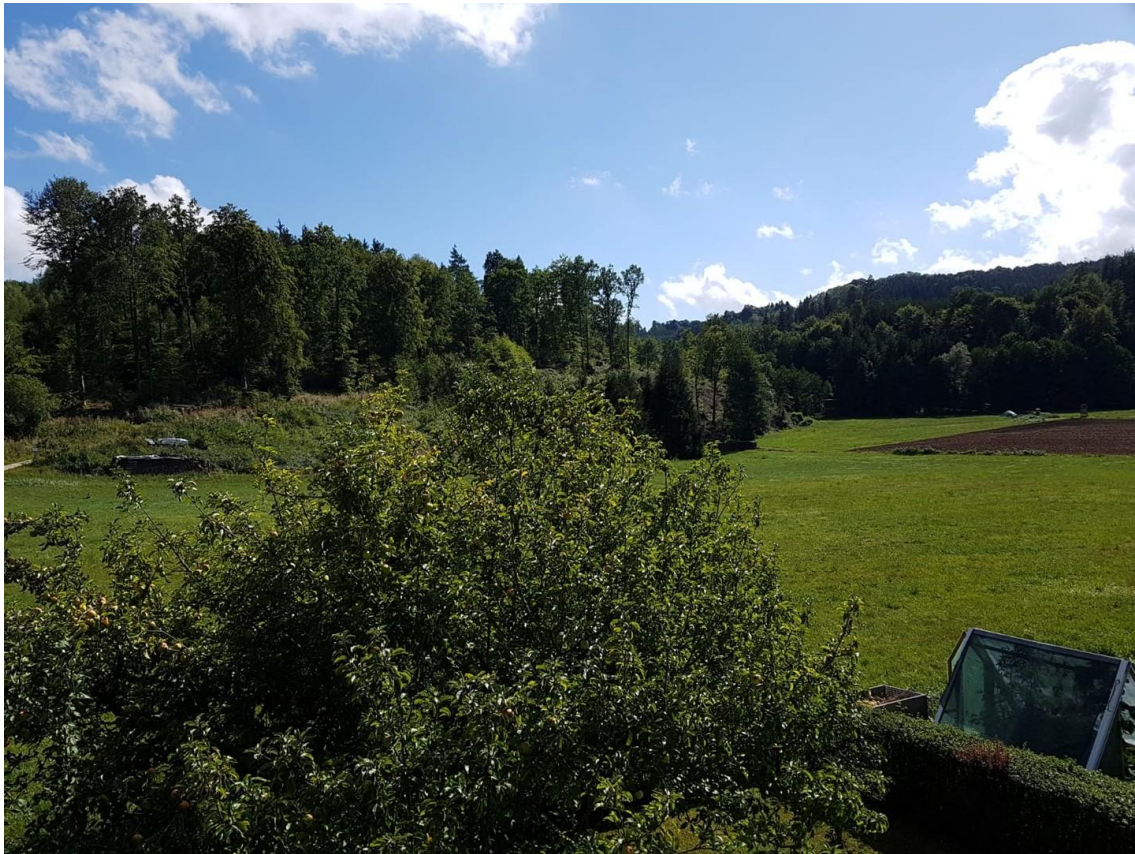
Blick aus dem Wohnzimmer