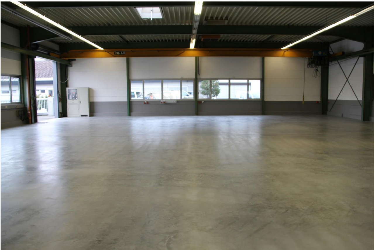
Hallenteil 1 von 2