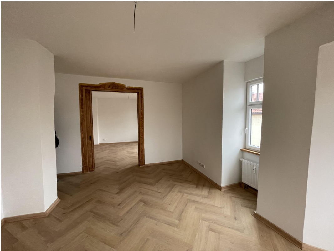
Wohnzimmer Zugang Esszimmer