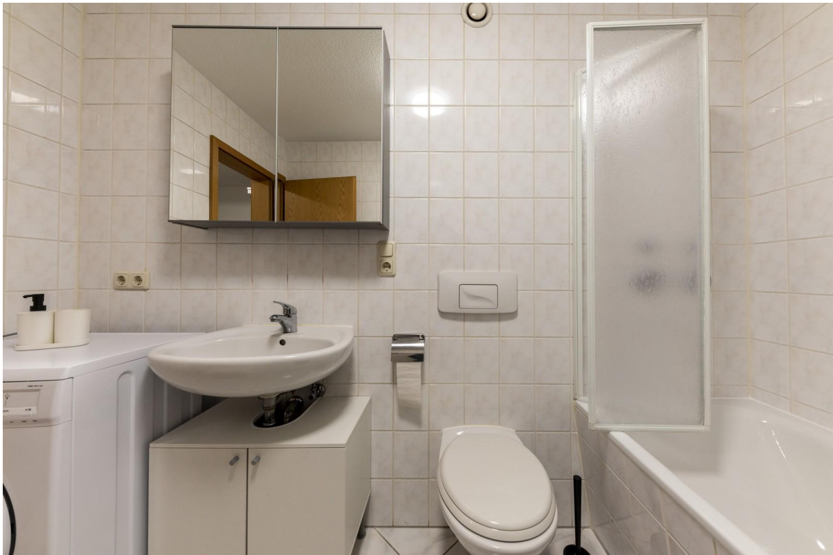
Bad / WC