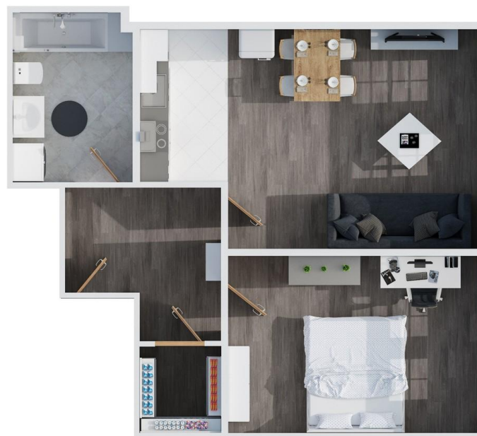
Grundriss Top View