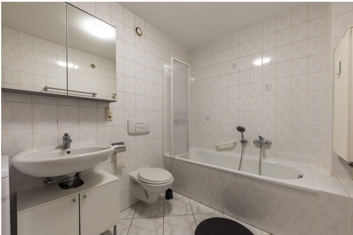
Bad / WC