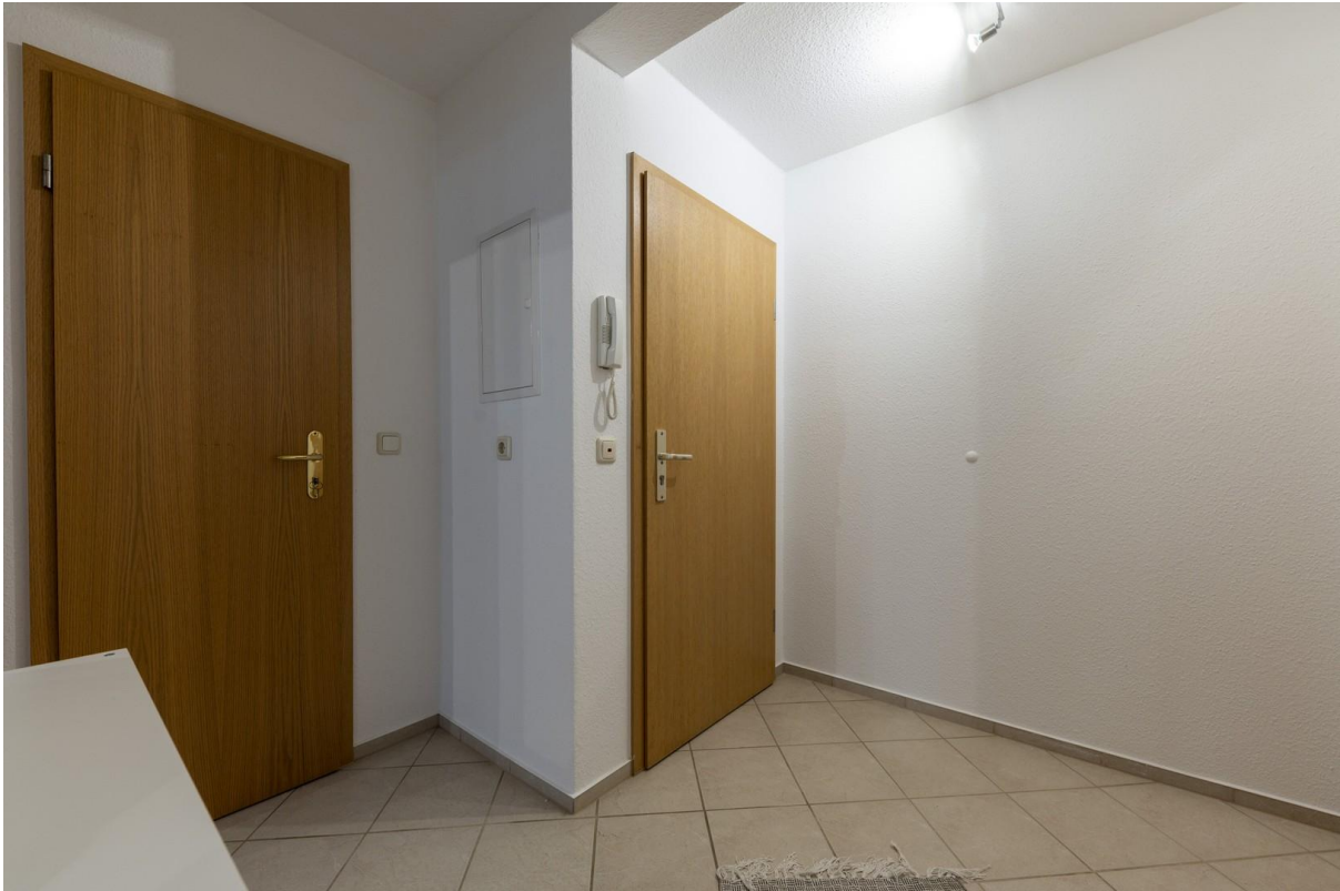
Flur / Lobby