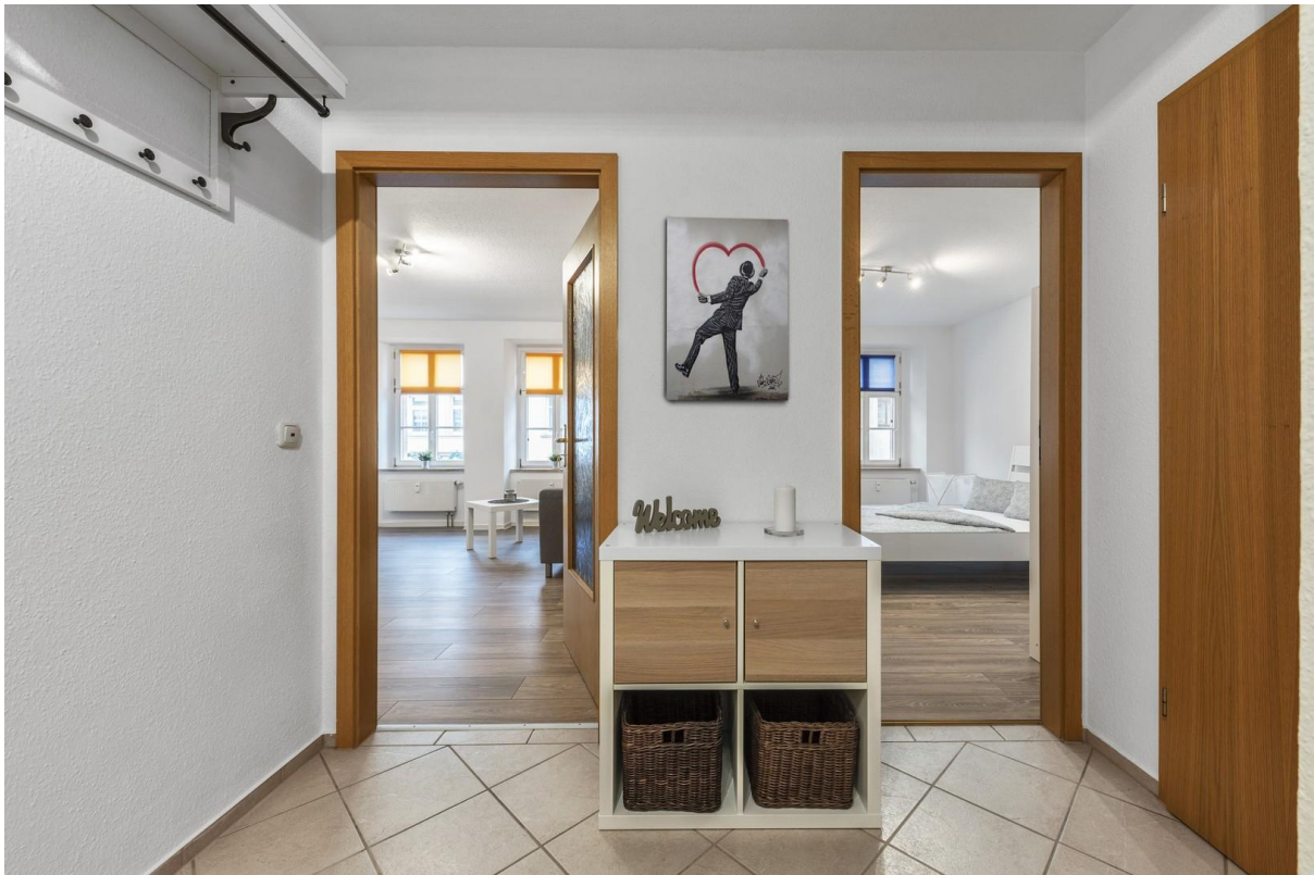
Flur / Lobby