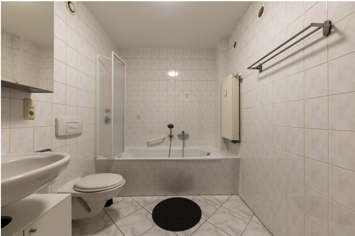
Bad / WC