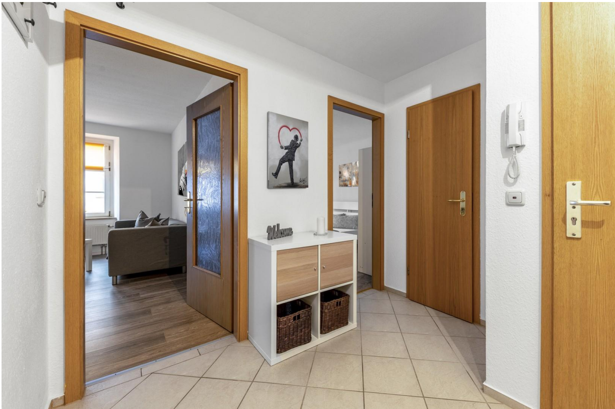
Flur / Lobby