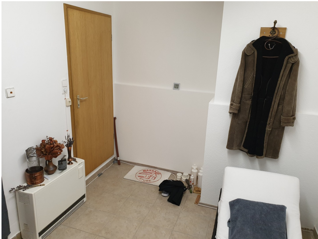
Ausgang zum Flur u. Haustüre