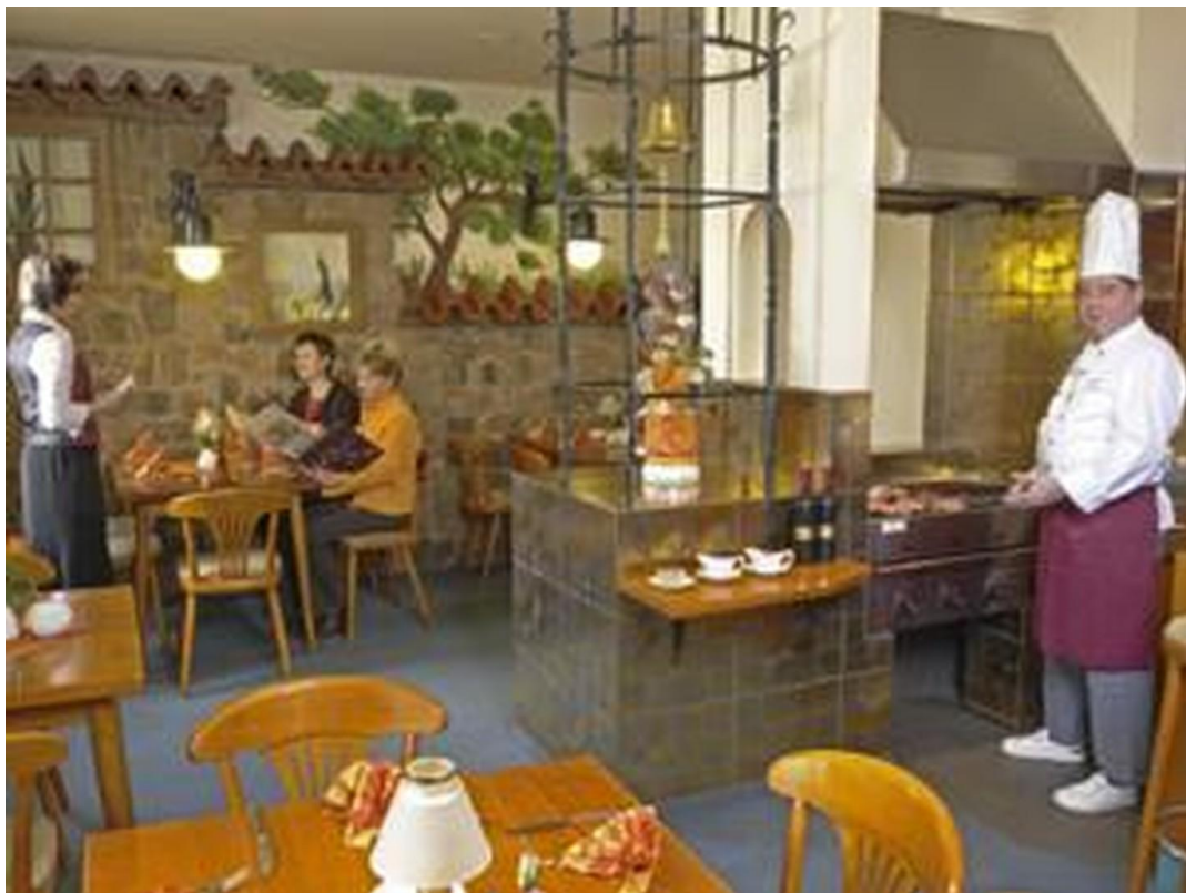
direkt vom Grill