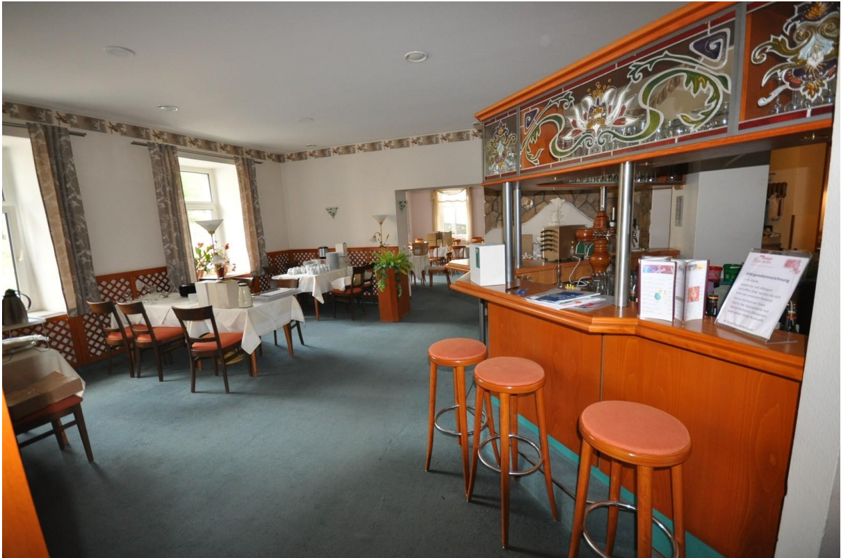
Gastrobereich mit Theke