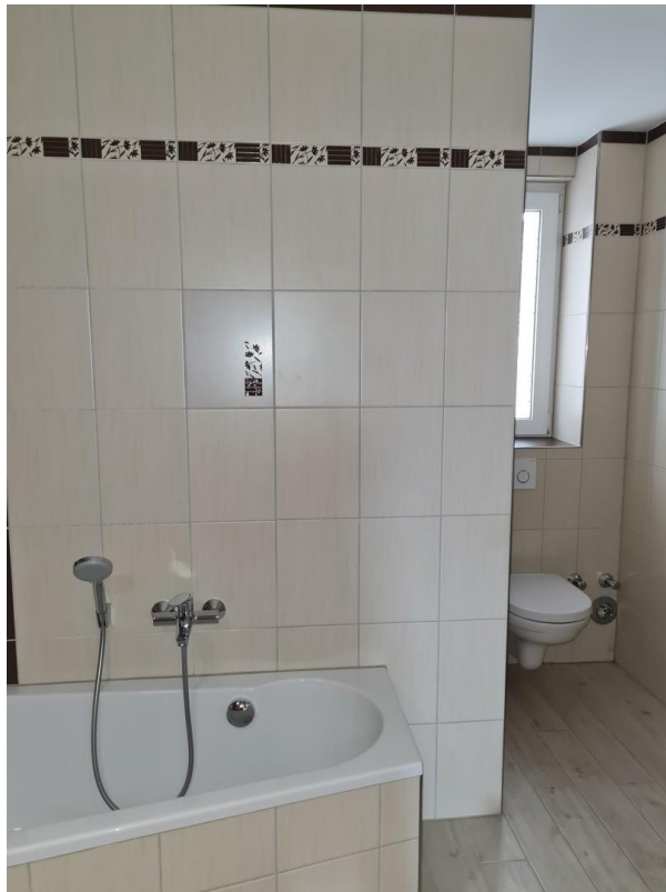
Bad mit Fenster