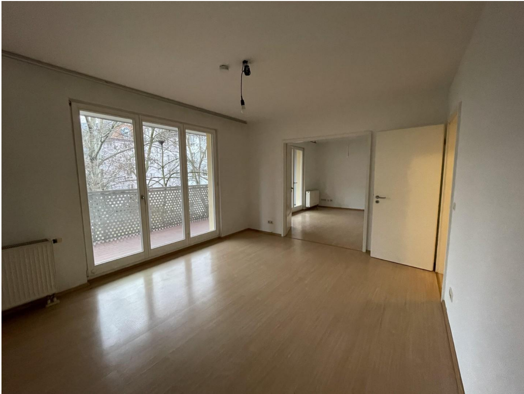
2 Zimmer mit Flügeltür