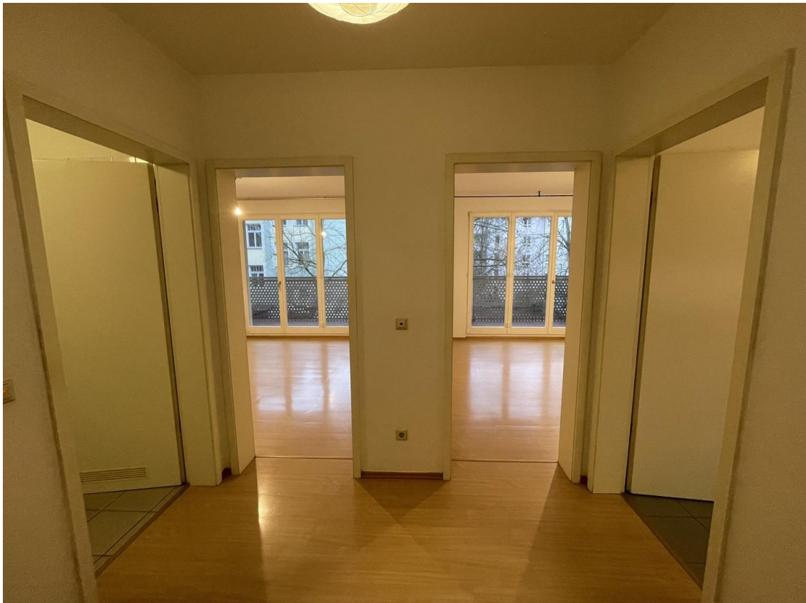
Fluransicht, li Bad, re Küche