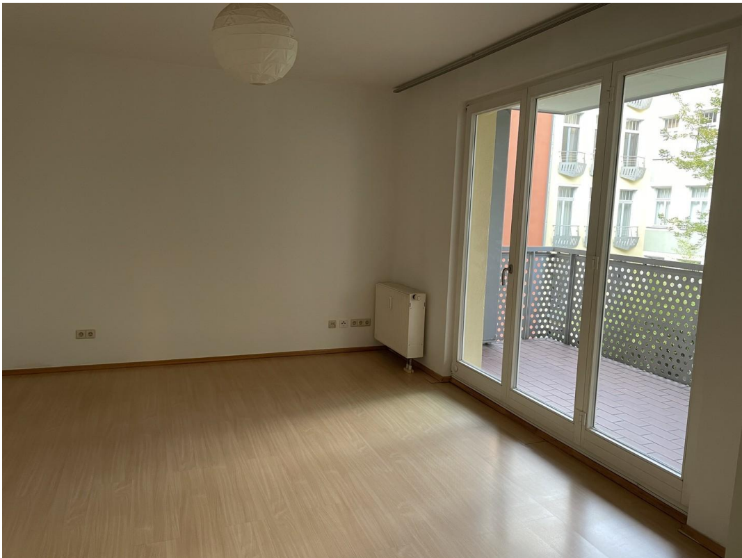
Zimmer 1, 18qm