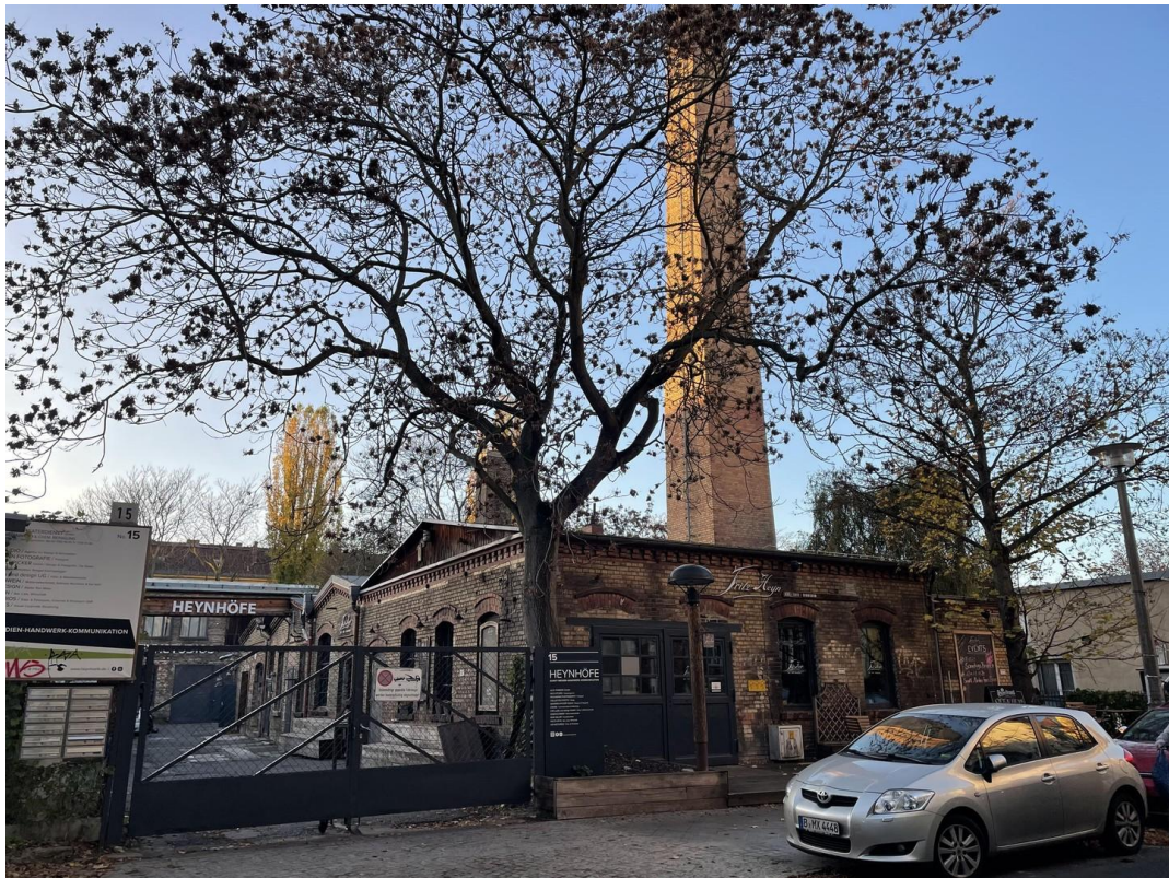
interessante begehrte Wohnlage