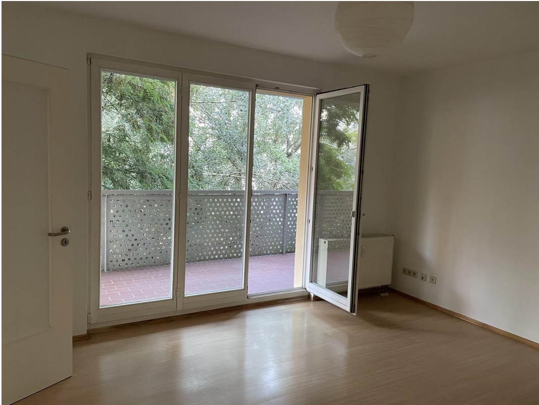
Zimmer 2, 18qm