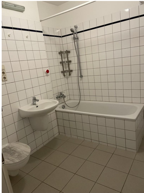
Wannenbad, WM Anschluss