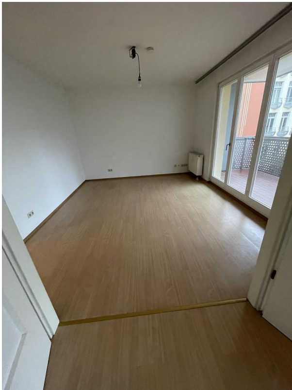
2 gleich große Zimmer