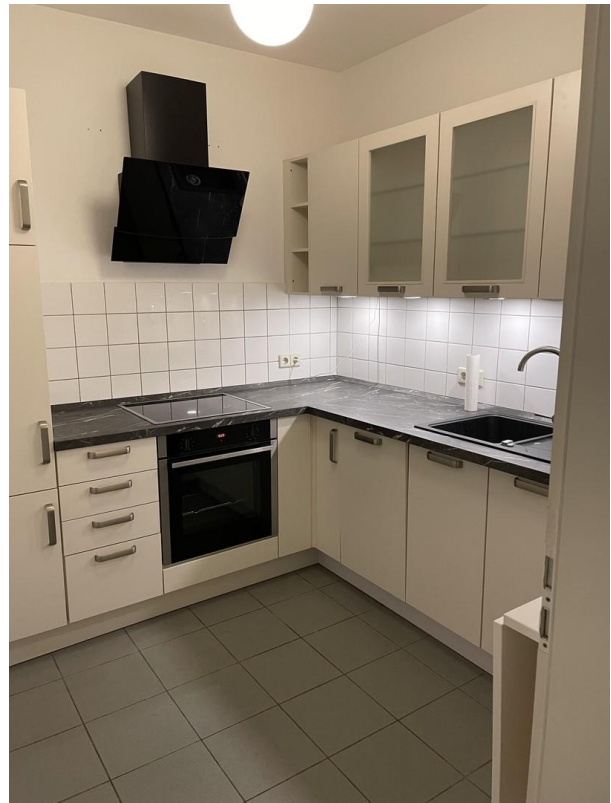
Einbauküche mit GS, Indherd