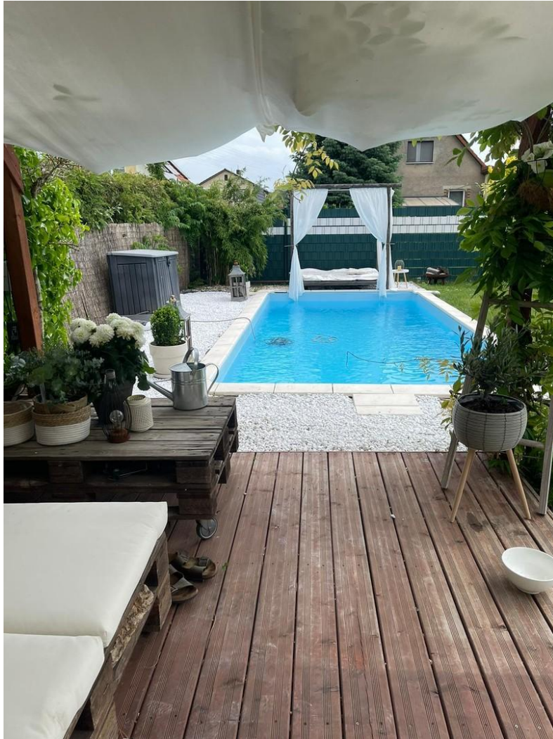
Pool Lounge Außenküche