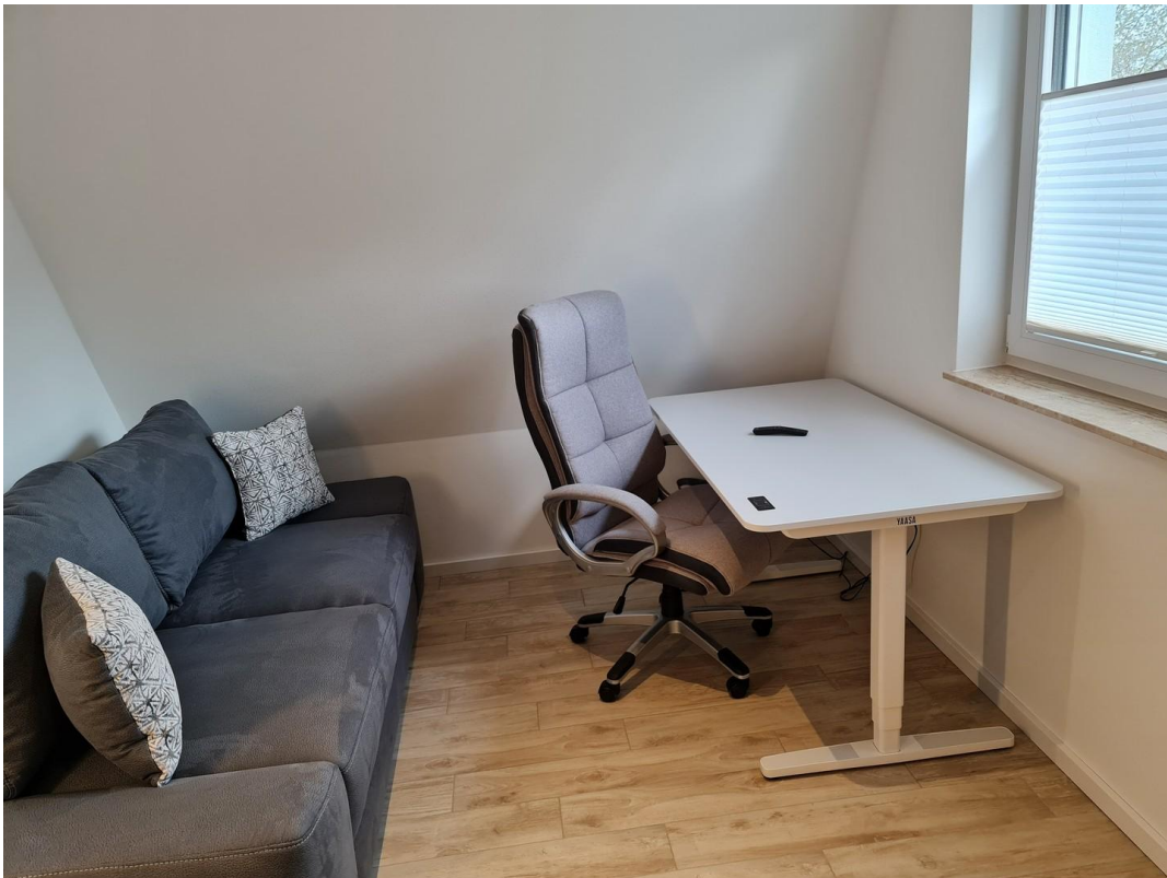
Arbeitszimmer mit Schlafcouch