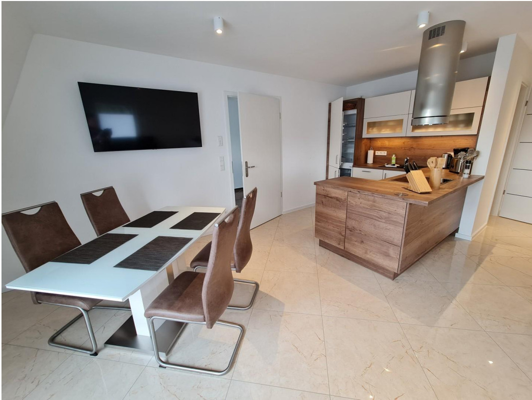
Küche mit Essplatz