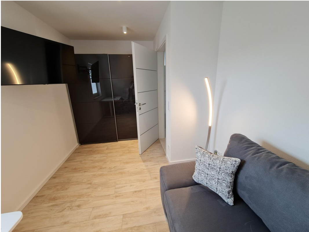
Arbeitszimmer mit Schlafcouch