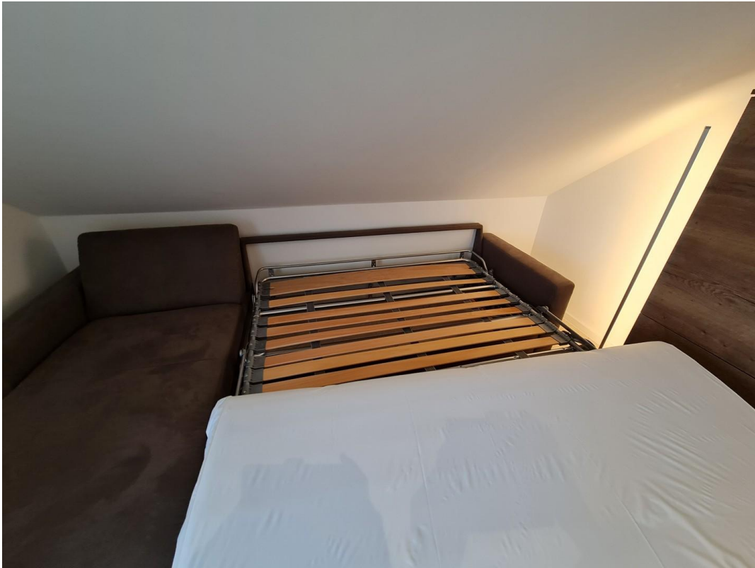
Bett mit Lattenrost Studio