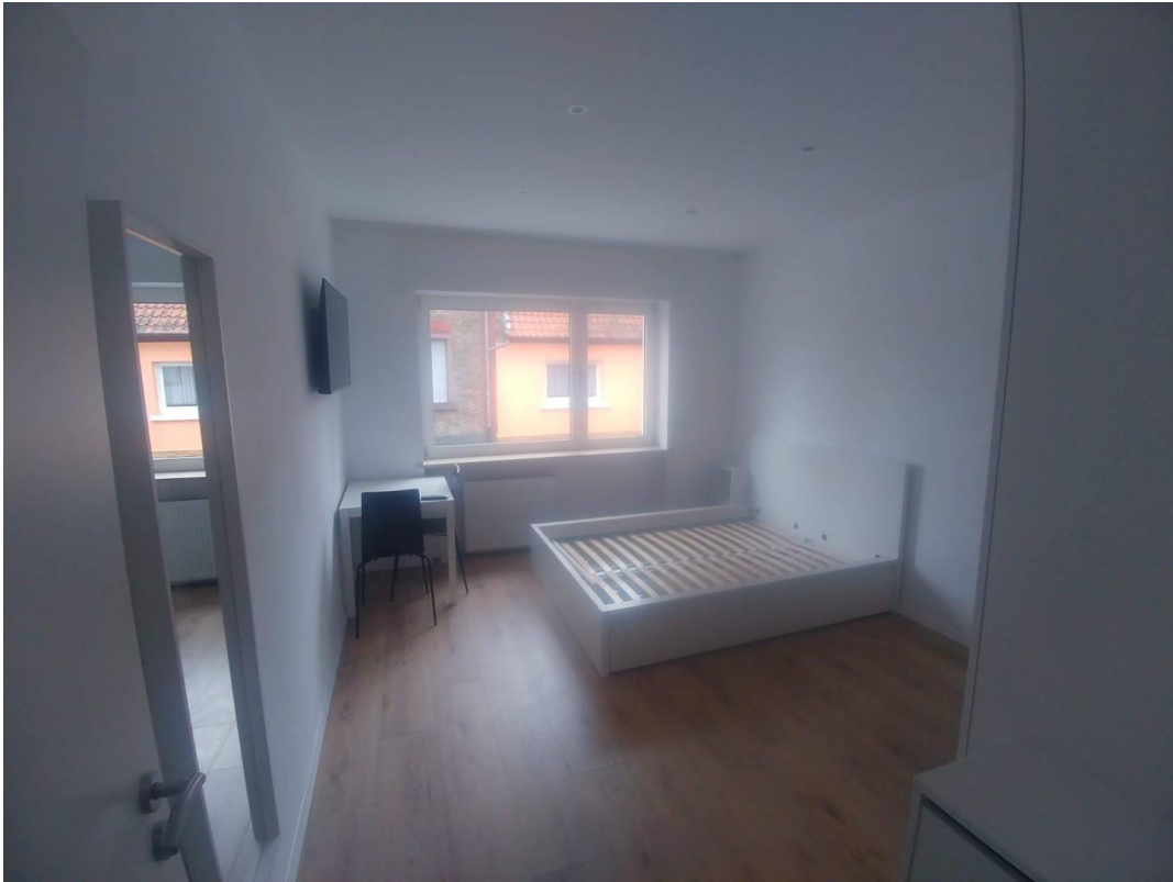
Wohn- / Schlafzimmer 2