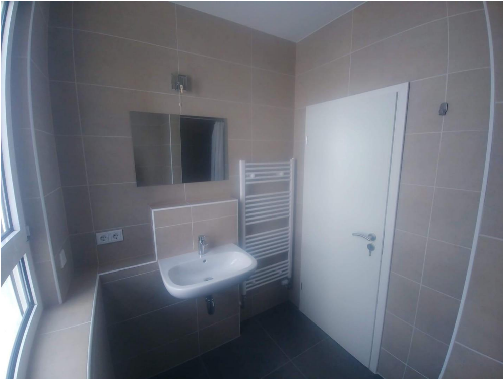
Bad / WC 2