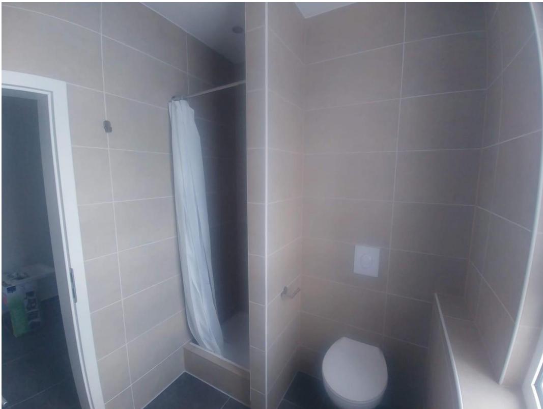
Bad / WC 1