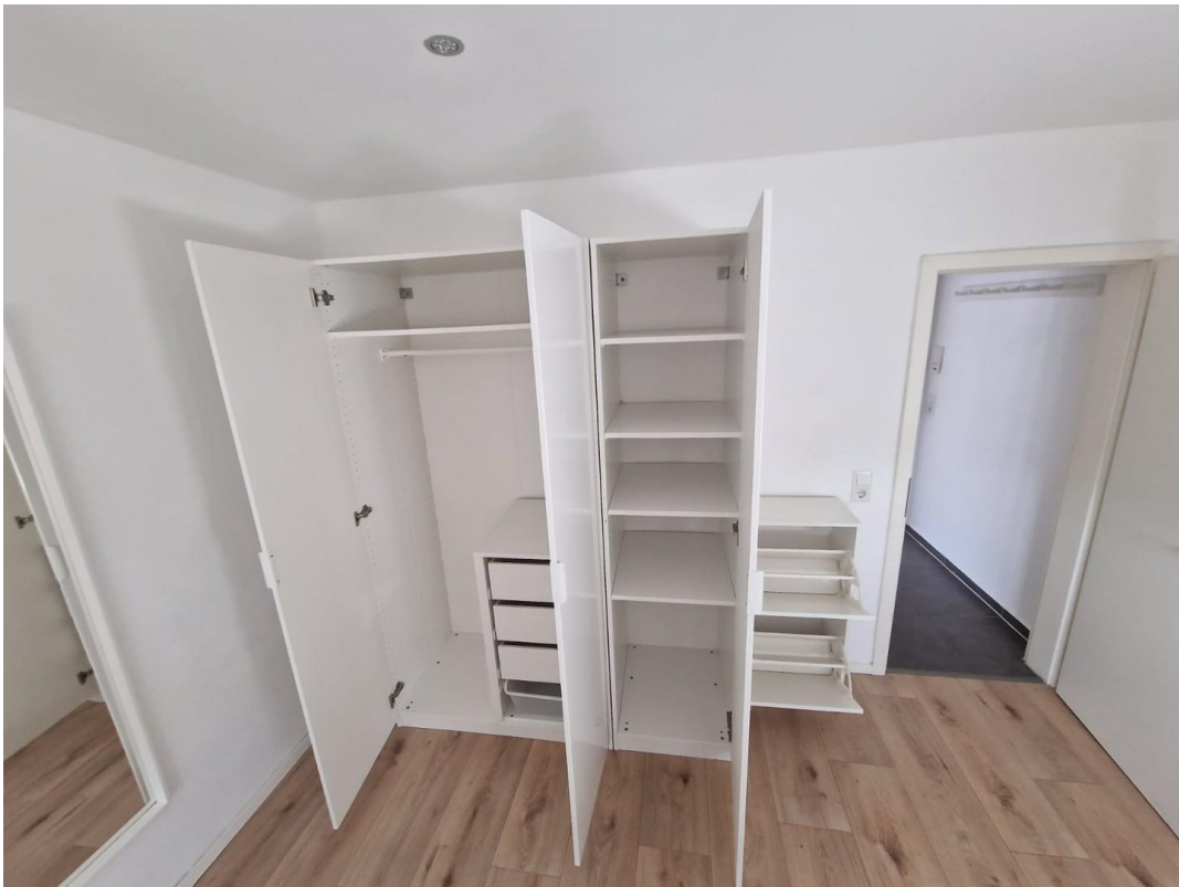
Wohn- / Schlafzimmer 5