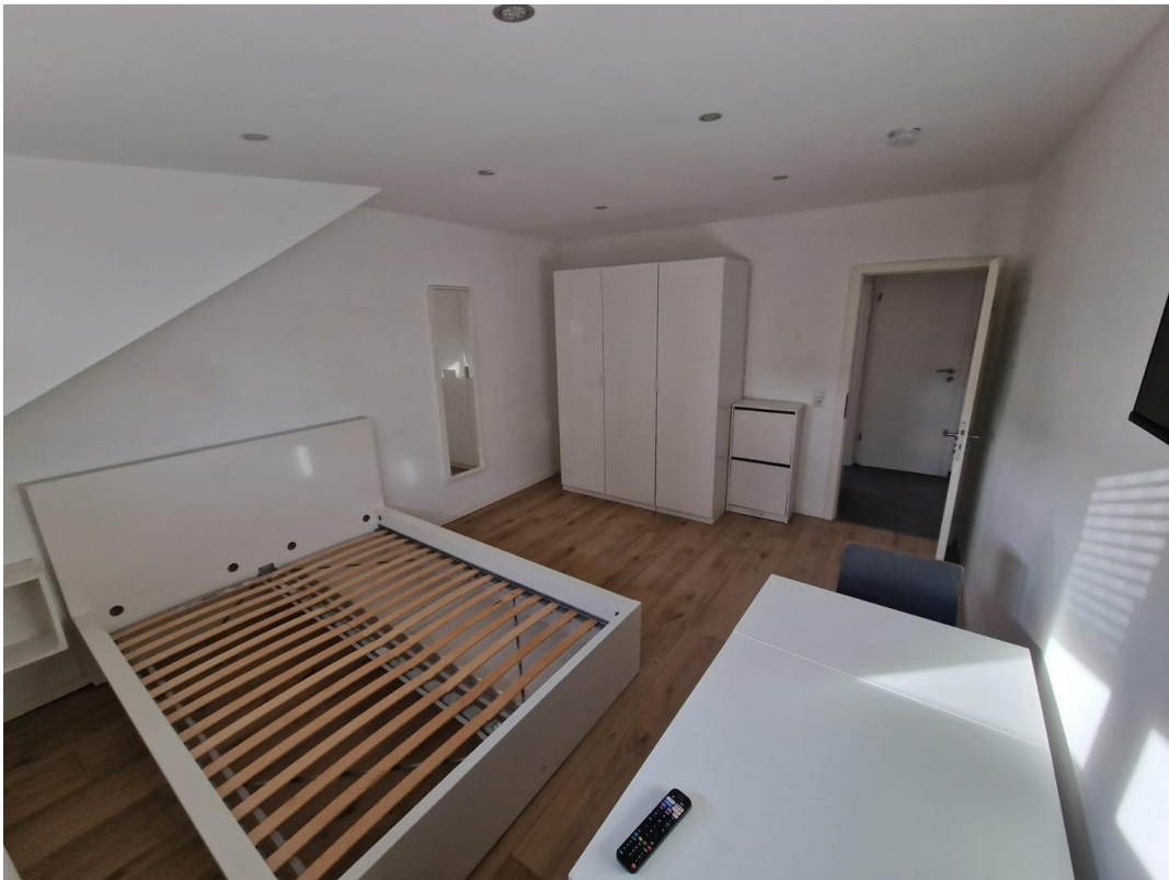
Wohn- / Schlafzimmer 3