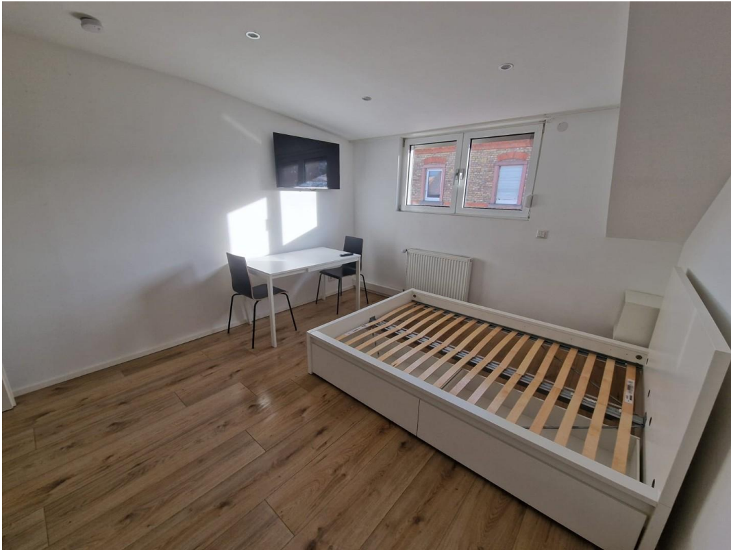
Wohn- / Schlafzimmer 4