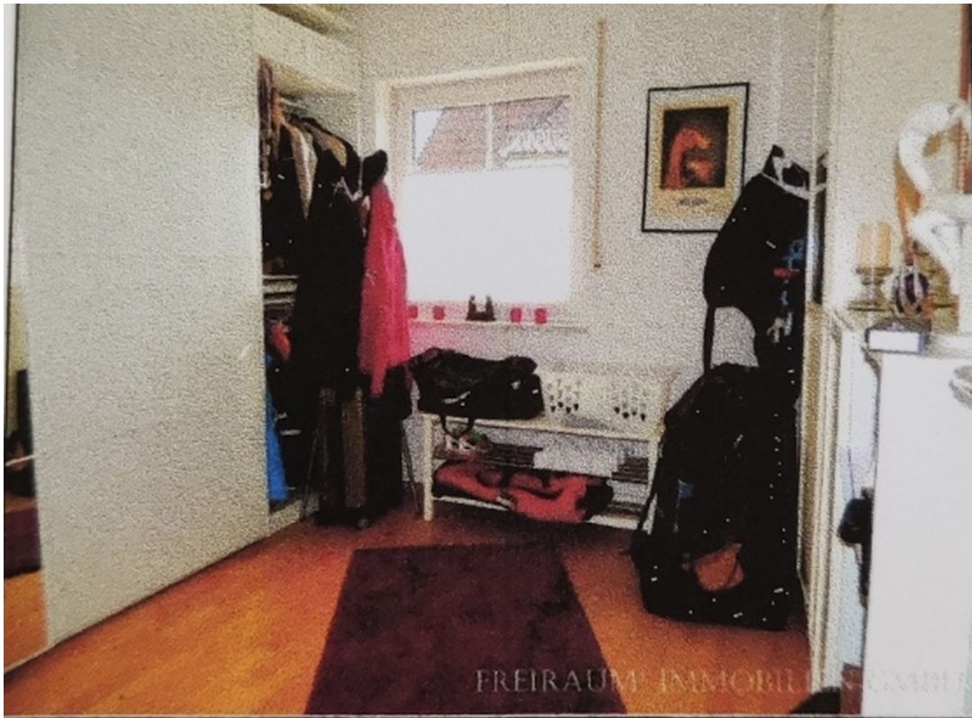
Schlafzimmer I. OG