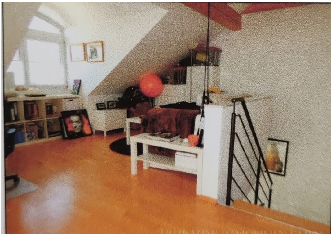
Galerie Wohnraum II. OG