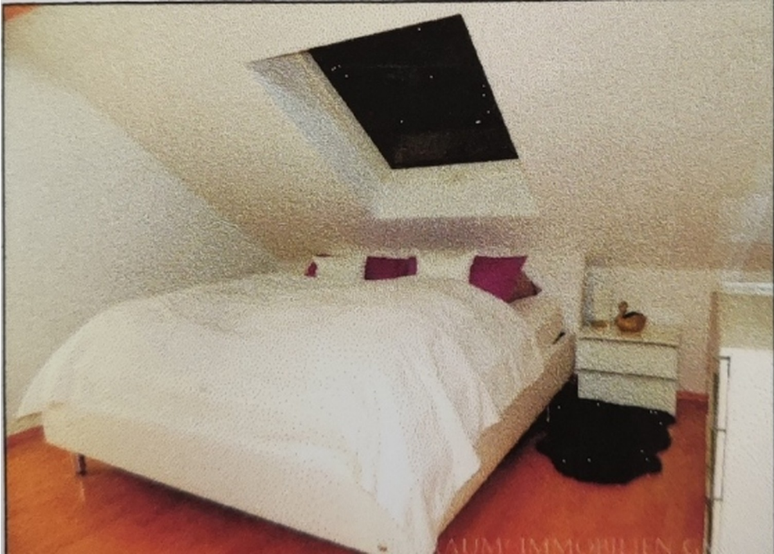
Schlafzimmer II. OG