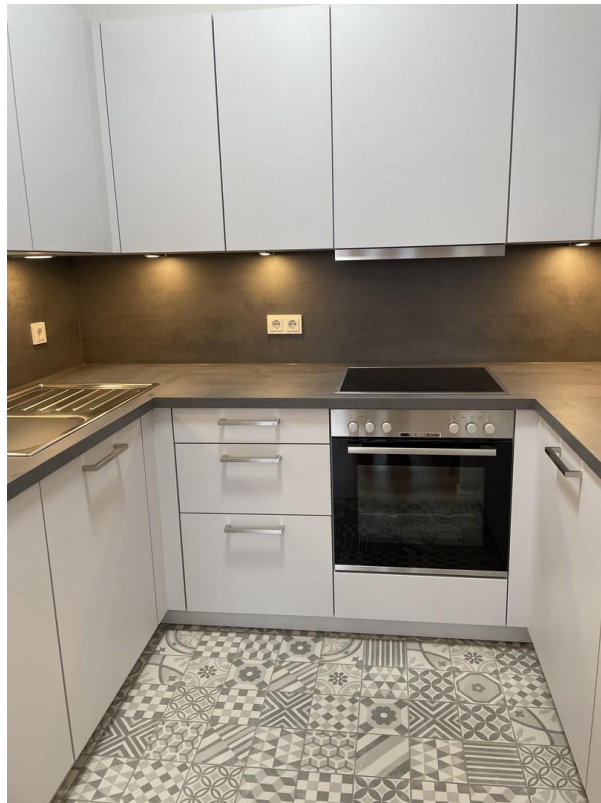
vollst. eingerichtete Küche