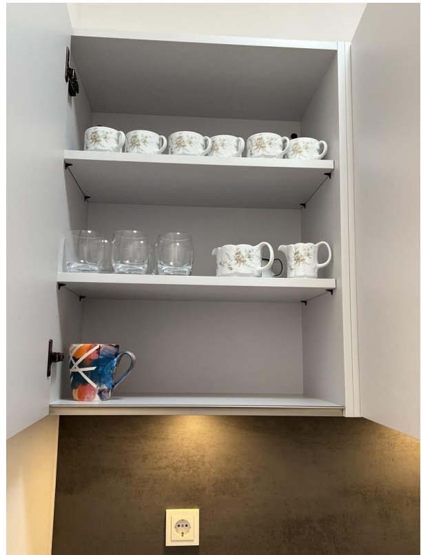
Kristallgläser u. Rosenthaler