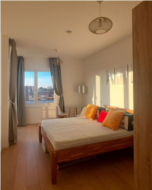
Schlafzimmer kl. Schreibtisch