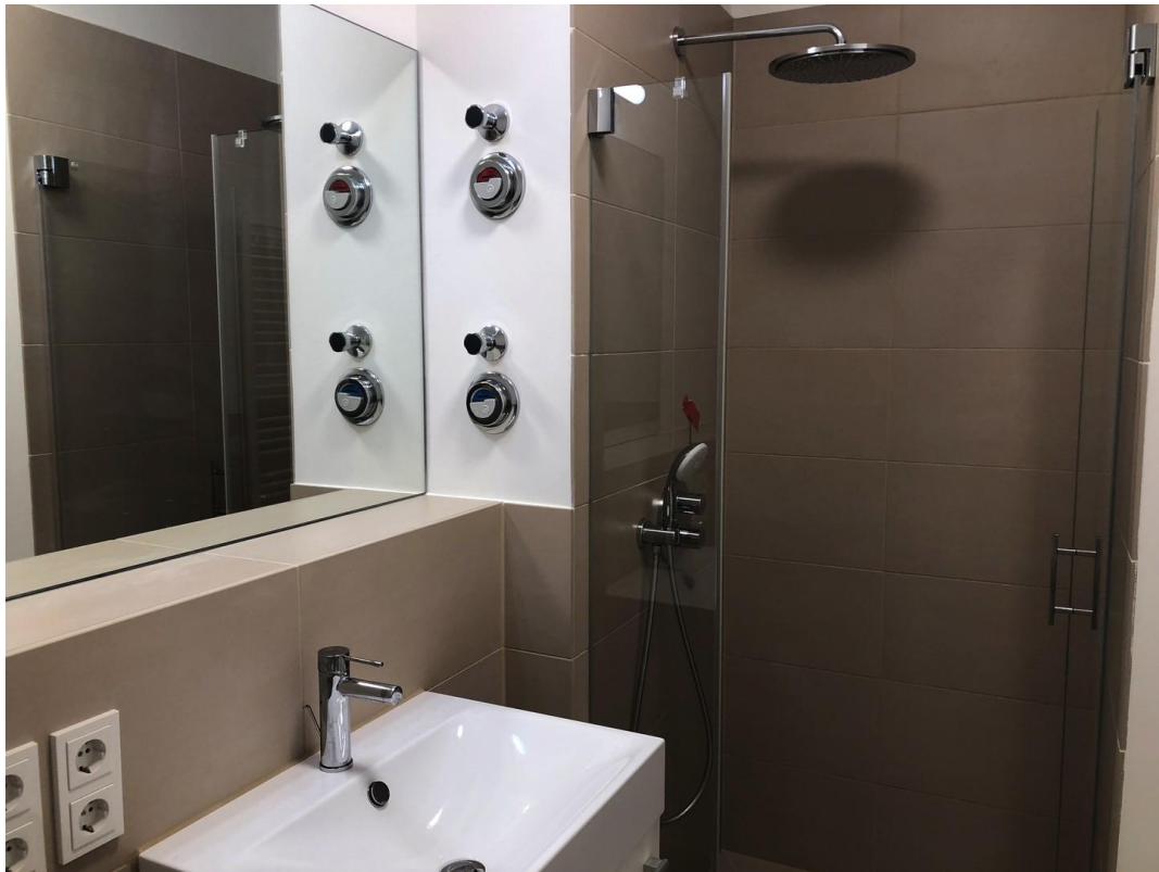
Badewanne u. zusätzlich Dusche